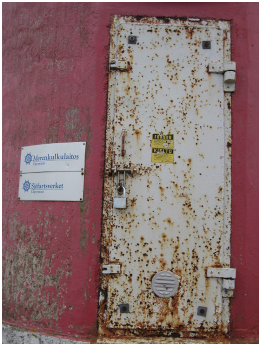
Majakan ovi, Utgrynnan, Merenkurkku.