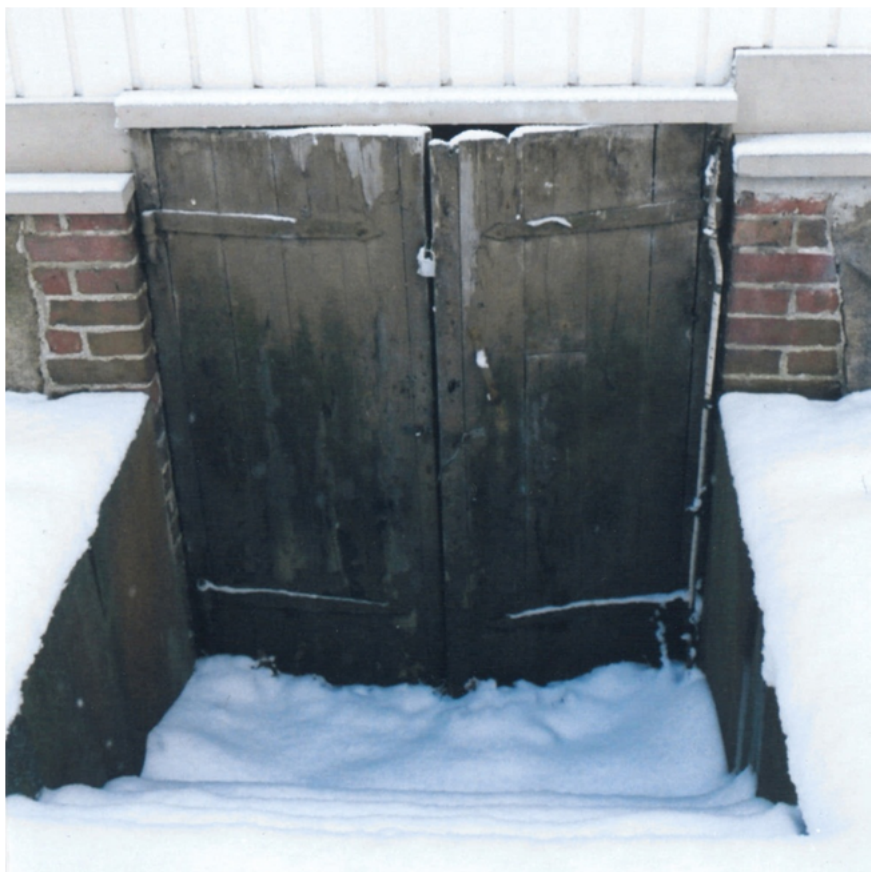
Kellarin ovi, Arvidssoninkatu 1, rak. 10, Turku.