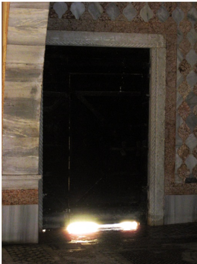
Sisäpihan ovi Canal Grandelle päin, Galleria Giorgio Franchetti alla Cà d'Oro, Venetsia.

Kuvani juhla kirjassa ovat syntyneet suurimmaksi osaksi vahingossa, en ole tarkoittanut niistä mitään sarjaa. Kun puheeksi tuli juhla kirjain tekeminen kulttuuri historiaan, ajattelin, että voisin osallistua siihen joillakin kuvilla.