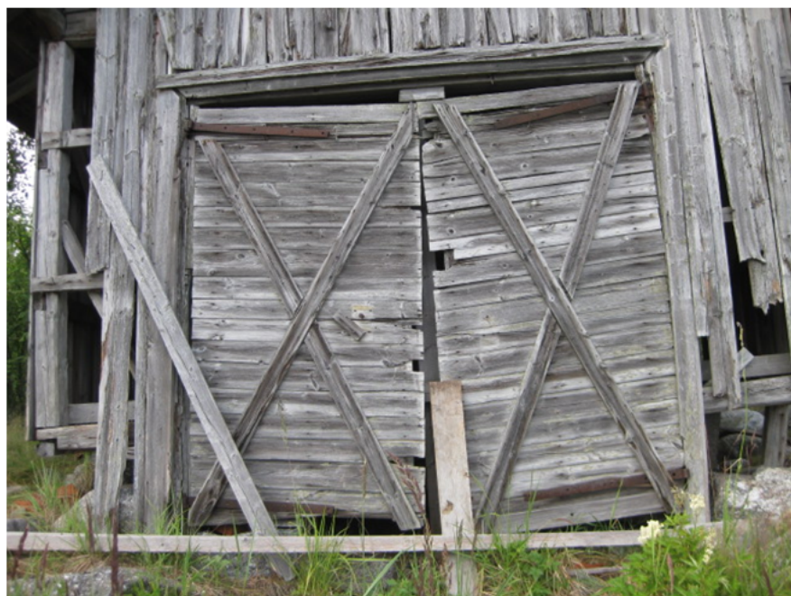
Venevajan ovi, Valassaaret, Merenkurkku.