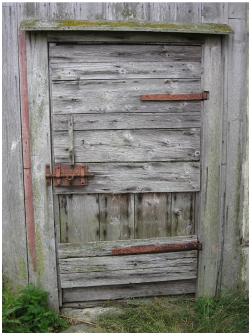
Kalastajamökin ovi, Utgrymanin saari, Merenkurkku.