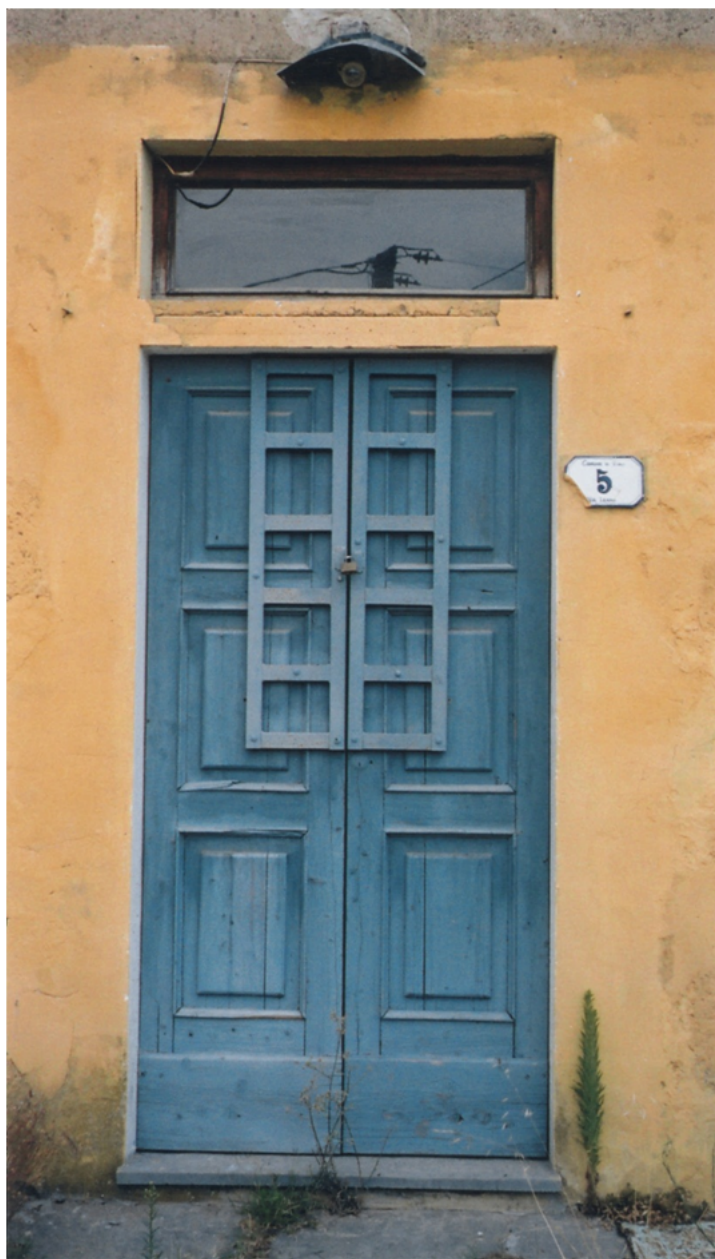
Varaston ovi, Vinian kylä, Toscana.