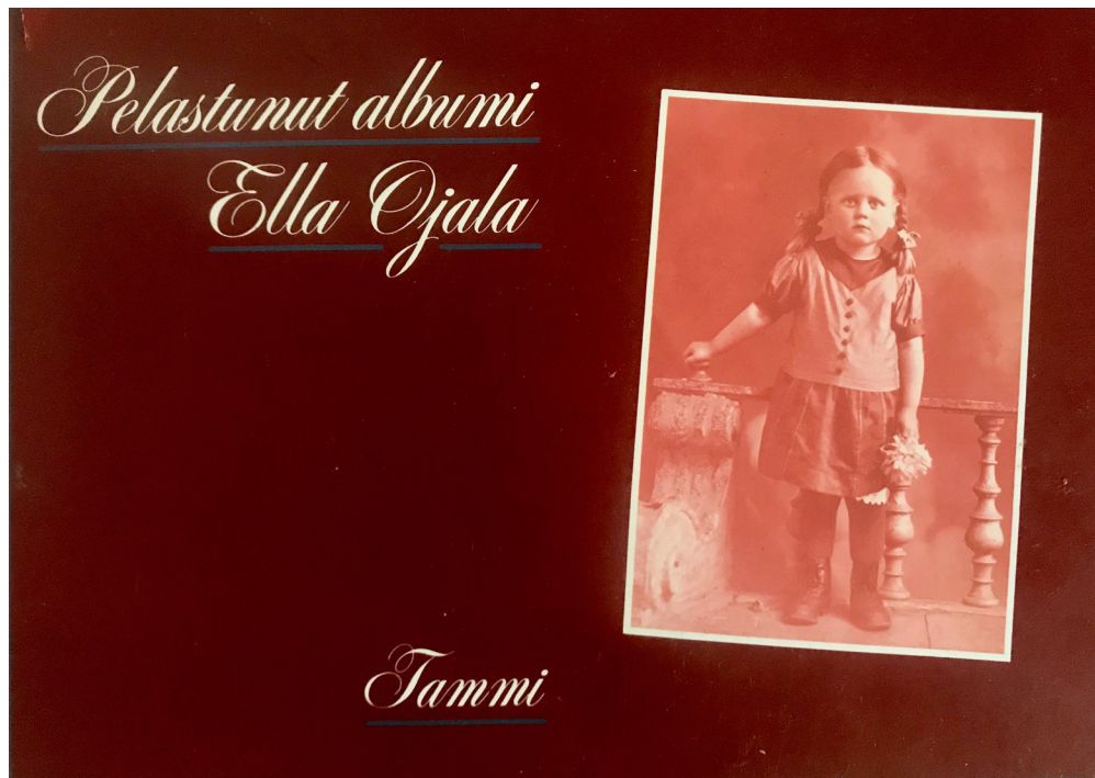
Kuva 4: Pelastunut albumi -valokuvateoksen kansikuva.