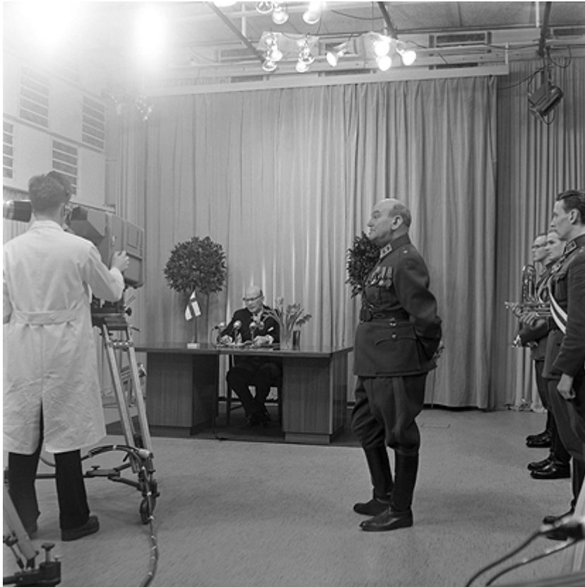
Presidentin uudenvuodenpuhe on institutionaalinen rituaali, josta sekä presidentti että Yleisradio hyötyvät. Kekkonen uudenvuodenpuhe 1958 myös televisioitiin ensimmäisen kerran.