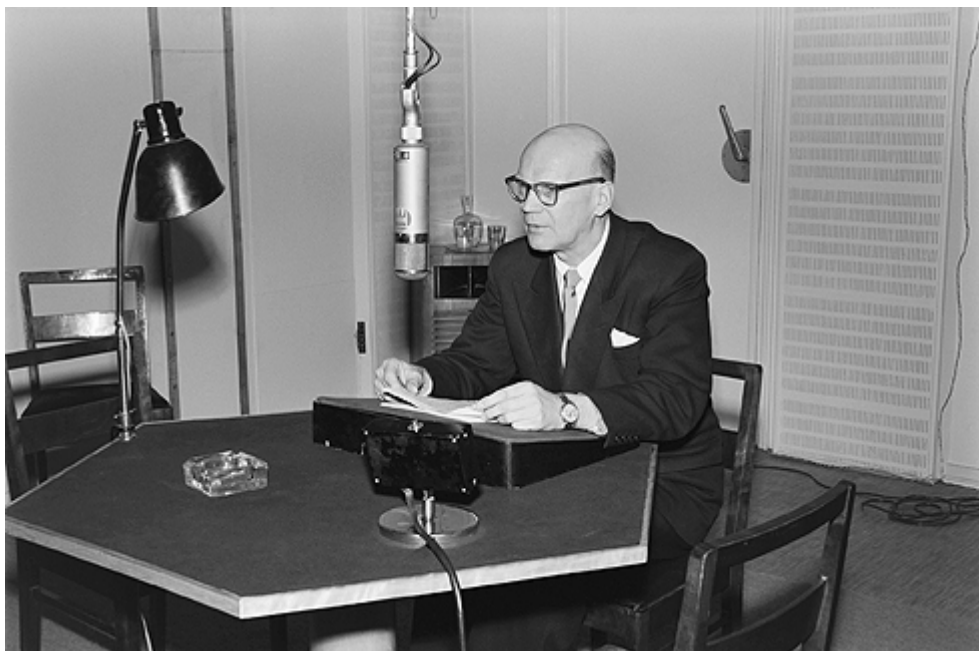
Kekkosen radiopuheiden retoriset tekniikat hioutuivat omanlaisikseen 1950-luvun aikana. Kuvassa presidenttiehdokas Kekkonen pitää radiopuhetta vuonna 1956.