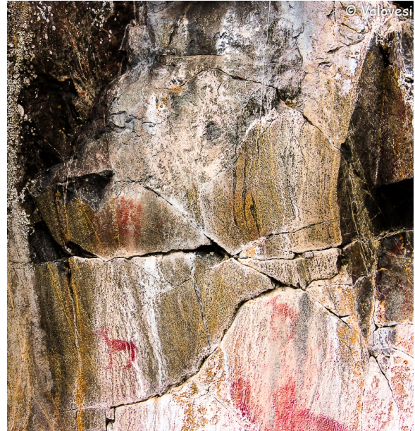
Kuva 4: Kämmenpainamat kuonossa ja 3 hirvää.

Maalauksista erottuu parhaiten kaksi hirvää ”kivi-ihmisen” poskessa ja nenän juuressa: molemmat matkalla luoteeseen, isompi seisomassa tanakasti maassa, pienempi hyppäämässä tai leijumassa. Hyppäävän alapuolella erottuu suurempi, hieman vaikeammin hahmotettava hirvi, joka vaikuttaa ennemminkin esiin hierotulta kuin maalatulta (kuva 4).