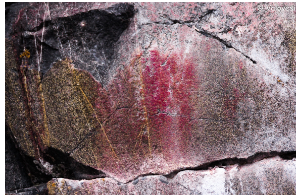
Kuva 5: Karhuntassut.

Hirvien yläpuolella, vasemmalla kalliossa on luontainen kohouma, joka muistuttaa tassua. Sen päälle, ja viereisen, vähäisemmän kohouman päälle on ilmeisesti painettu punaväriin kastetuilla karhun tassuilla kaksi jälkeä, jotka leveydeltään ja kooltaan muistuttavat karhun takatassuja (kuva 5). Painettuja ihmisen ja mesikämmenen jälkiä tunnetaan muualtakin maalauksiltamme. Siperiassa shamaaniin tiedetään pukeutuneen seremonioissa eläinten asuihin ja käyttäneen mm. karhun tassuja jaloissaan. Tassut sijaitsevat kallionlohkareessa, joka muistuttaa karhun päätä kuonoineen ja silmineen, jopa korvat on hahmotettavissa (kuva 4).