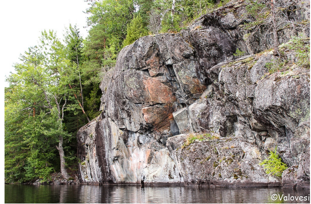
Kuva 1: Ukon profiili kallion kaakkoissivulla.

Suomen eteläisimmän kalliomaalauksen Pohjan Lammasjärvellä Raaseporissa löysi muusikko Sami Wirkkala suppilautaillessaan järvellä elokuussa 2016. Ensimmäisenä huomion kiinnitti suurinenäinen, punertava ukon profiili ylhäällä kalliossa (kuva 1). Se osuu monen muunkin silmään kaakosta päin kalliota lähestyttäessä. Samin ystävä teki maalauksesta ilmoituksen maakuntamuseoon, mutta sähköposti katosi jonnekin virastojen eetteriin. Suomen ensimmäisen kalliomaalauksen löysi säveltäjä Jean Sibelius vuonna 1911 Kirkkonummen Vitträskistä. Sibeliuksen puhelinsoitosta tehty muistiinpano unohtui Museoviraston edeltäjän laatikoihin kuudeksi vuodeksi kunnes arkeologi Aarne Europaeus kävi virallisesti toteamassa maalauksen aidoksi.