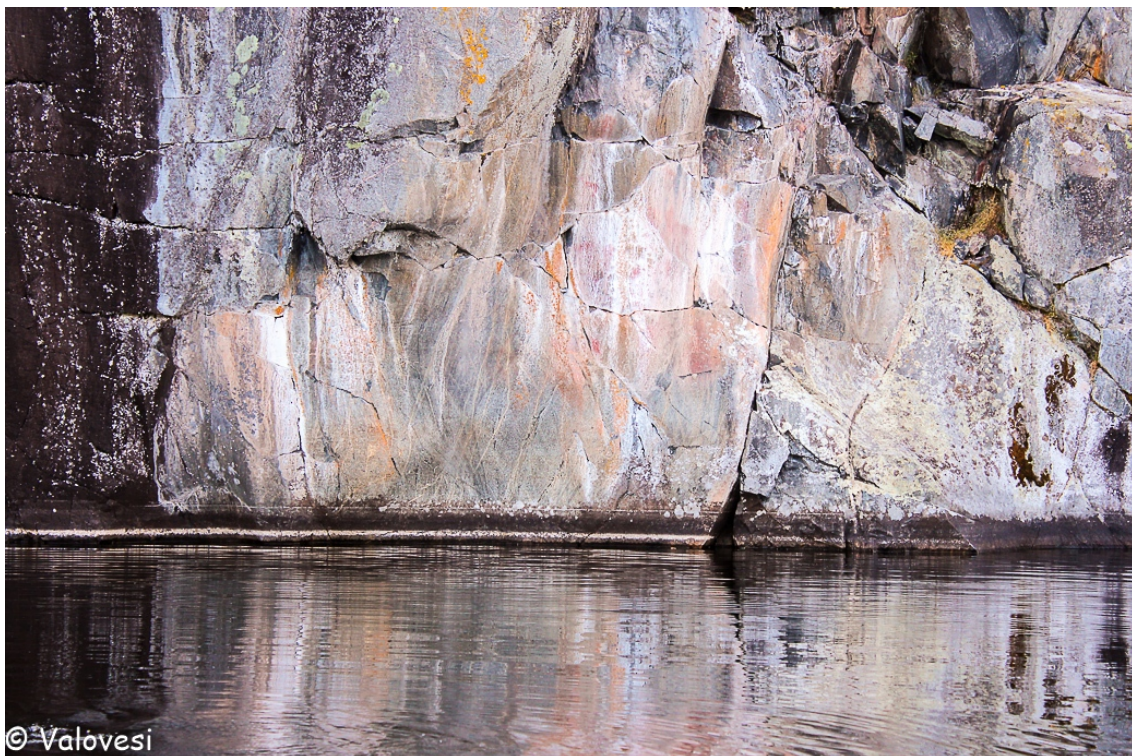
Kuva 2: Lammasjärven maalaus kallio

Maalauspaikka löytyikin heti kallion kulman takaa (kuva 2). Musta ja valkoinen valuma vuorottelivat hieman koverassa, sileässä kallion pinnassa, josta erottui punertavat, kallion halkeamista muodostuvat suuret kasvot. Lähemmäksi soutuessamme kallioista erottui selvästi kaksi punaista, maalattua hirvieläintä sekä joukko muita maalausjälkiä. Lahti on Natura -aluetta, eikä