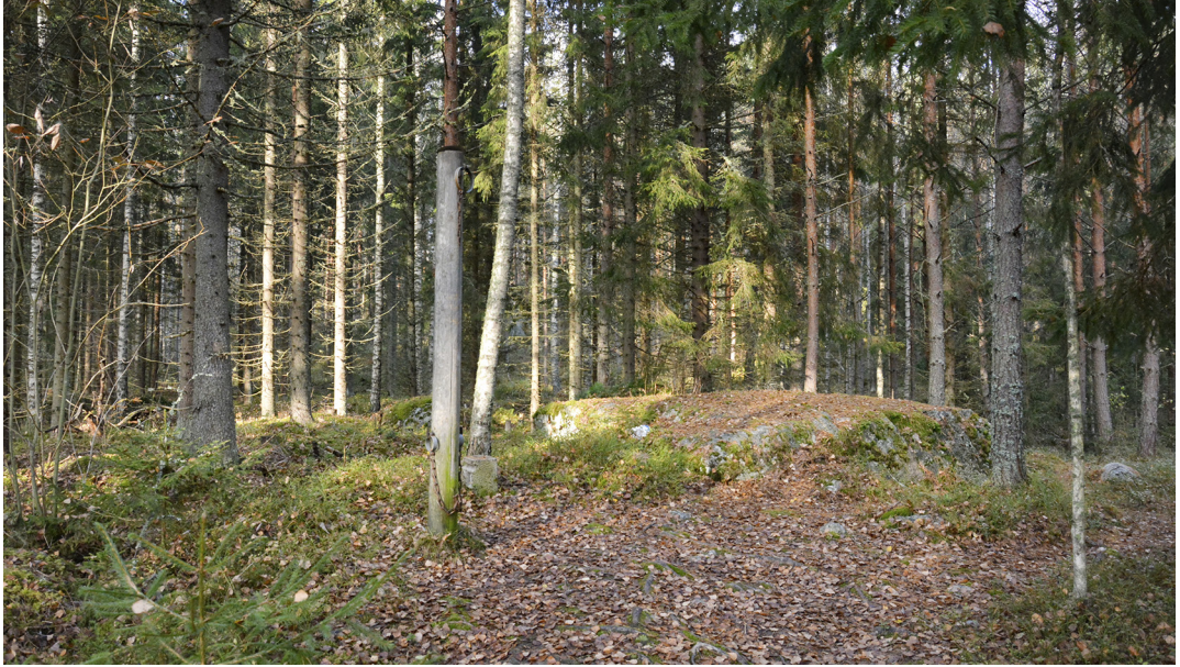
Kuva 5. Sastamalan Kilpijoella historiallisen kulkutien varrella sijaitseva rangaistuspaikka Ruoskamäki, jossa kerrotaan sijainneen mm. teilypöriä. Nykyisin paikalla sijaitsee muistomerkinä moderni paalu. Ympäristö on kuitenkin koskematonta.

Etenkin perimätiedon mukaan kirkkojen pohjoispuolelle voitiin haudata lähinnä rikkolisia ja itsemurhan tehneitä, mutta todellisuudessa pohjoispuolisella hautausmaalla sijaitti usein myös köyhille sekä palvelusväelle tarkoitettuja merkitsemättömiä rivihautoja. 78 Todennäköisesti juuri tällaista kirkon pohjoispuolelle tehtyä yhteishautaa on tutkittu mm. Pälkäneen rautiokirkon arkeologisissa kaivauksissa vuonna 2003. 79