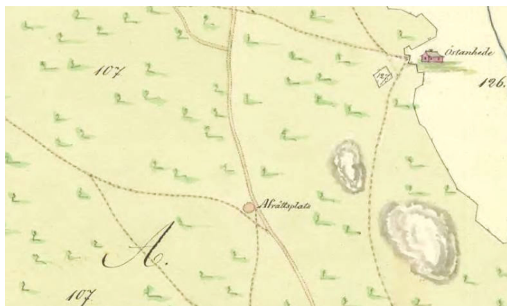
Kuva 4. Teiden risteykseen merkitty rangaistuspaikka Gävlen lähellä sijaitsevan Torsåkerin kartassa vuodelta 1815 (Lantmäteriverkets forskningsarkiv, Gävle; Karta V51-9:1 (1815) Torsåker, Gammelstilla Bruk).

Varhaismodernista Skandinaviasta ja Länsi-Euroopasta tunnetaan myös tapa käyttää teloituspaikeina esikristillisiä kalmistoja ja käytöstä jääneitä hautapaikko-