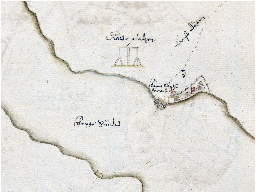
Kuva 1. Hirsipuu Ahvenanmaan Saltvikin pitäjän Haraldsbyn maakirjakartassa. KA MHA A2d: 114–115.

suuren kolmen markan sakon, jos tämä jätti ruumiin siunaamatta. 3 Saman lain mukaan myös vieraassa seurakunnassa kuolleiden matkalaisten ja kulkureiden kunnollisesta hautauksesta ja sielunmessuista oli huolehdittava, vaikka vainajan mukana olleesta omaisuudesta ei olisi saanut papille riittävää korvausta. 4 Esimerkiksi Someron talonpojat valittivat vuonna 1492 kirkkoherrastaan Mikaelista , joka oli lain vastaisesti jättänyt hautaamatta kuolleen matkalaisen tai pyhiinvaeltajan ( peregrinus ) ruumiin, jolta koirat olivat jo ehtineet syödä toisen käden. 5