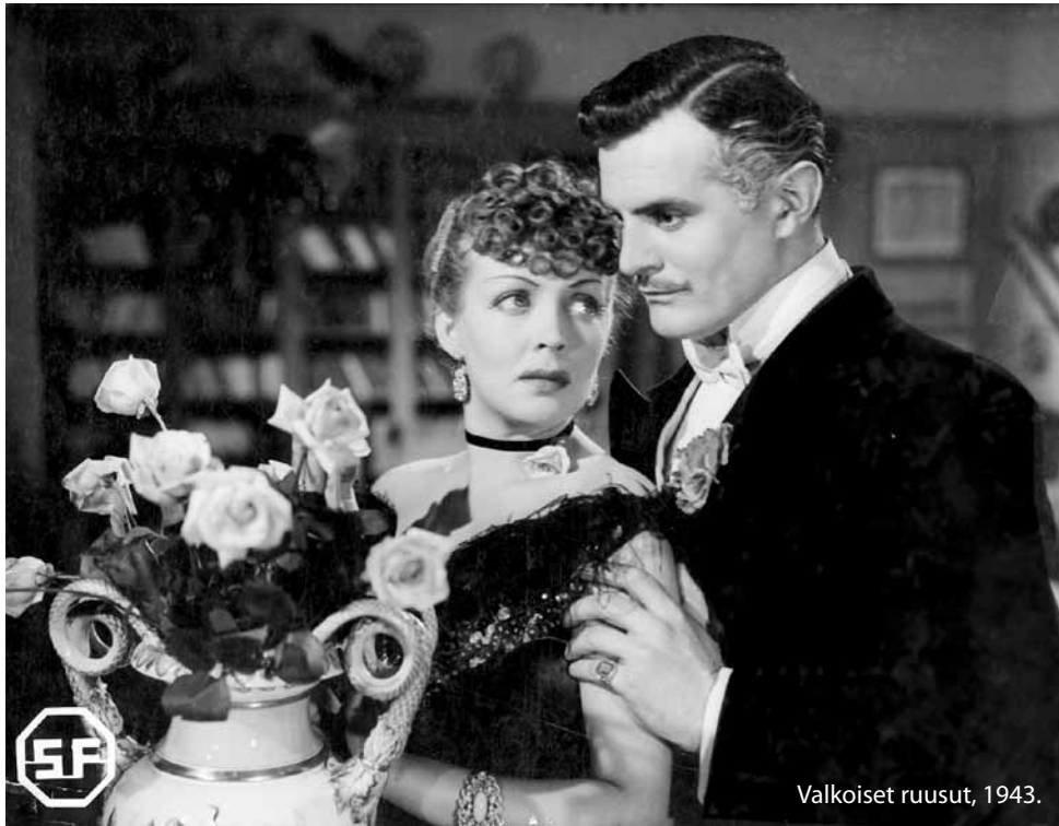
Valkoiset ruusut, 1943.

elokuva, siitä huolimatta, että se on ensi-iltakierroksensa jälkeen ollut nähtävillä vain lyhennettynä versiona. Poistetut katkelmat – kaikkiaan noin 15 minuuttia – ovat kuitenkin onneksi säilyneet. Nyt ne on palautettu paikoilleen Kansallisessa audiovisuaalisessa instituutissa. Tämän loisteliaan ”ohjaajan version” uutta ensi-iltaa saamme juhlistaa Turussa lauantaina 8. huhtikuuta.