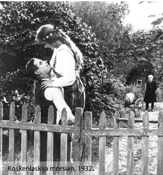
Koskenlaskija morsian, 1932.

Suomalaisen elokuvan festivaali juhlistaa Suomen itsenäisyyden merkkipäivää käännteentekevilla elokuvilla. Lähestymme itsenäistä Suomea siis nimenomaan elokuvan suunnasta: sarja on laadittu sillä periaatteella, että mukana on elokuvahistoriallisesti merkittäviä elokuvia, ei niinkään elokuvia, jotka kuvaavat historiallisesti merkittäviä tapahtumia – vaikka toki esillä on monta perinteistä historiallista elokuvaakin. Sarjassa on mukana sekä valkokankaalle tehtyjä näytelmäelokuvia, pitkiä ja puolipitkiä dokumenttielokuvia että televisioelokuvia. Näytelmäelokuvia on yksi jokaiselta itsenäisyyden ajan vuosikymmeneltä, ja ne on valittu siten, että kukin edustaa jonkinlaista elokuvatuotannon käännettä, murrosta tai huipentumaa, vaikkakin varsin erilaisin tavoin.