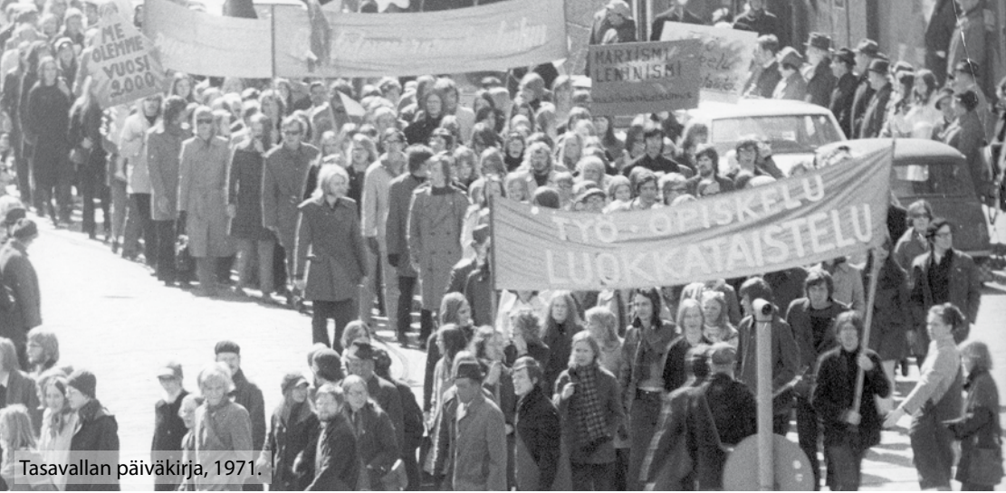
Tasavallan päiväkirja, 1971.