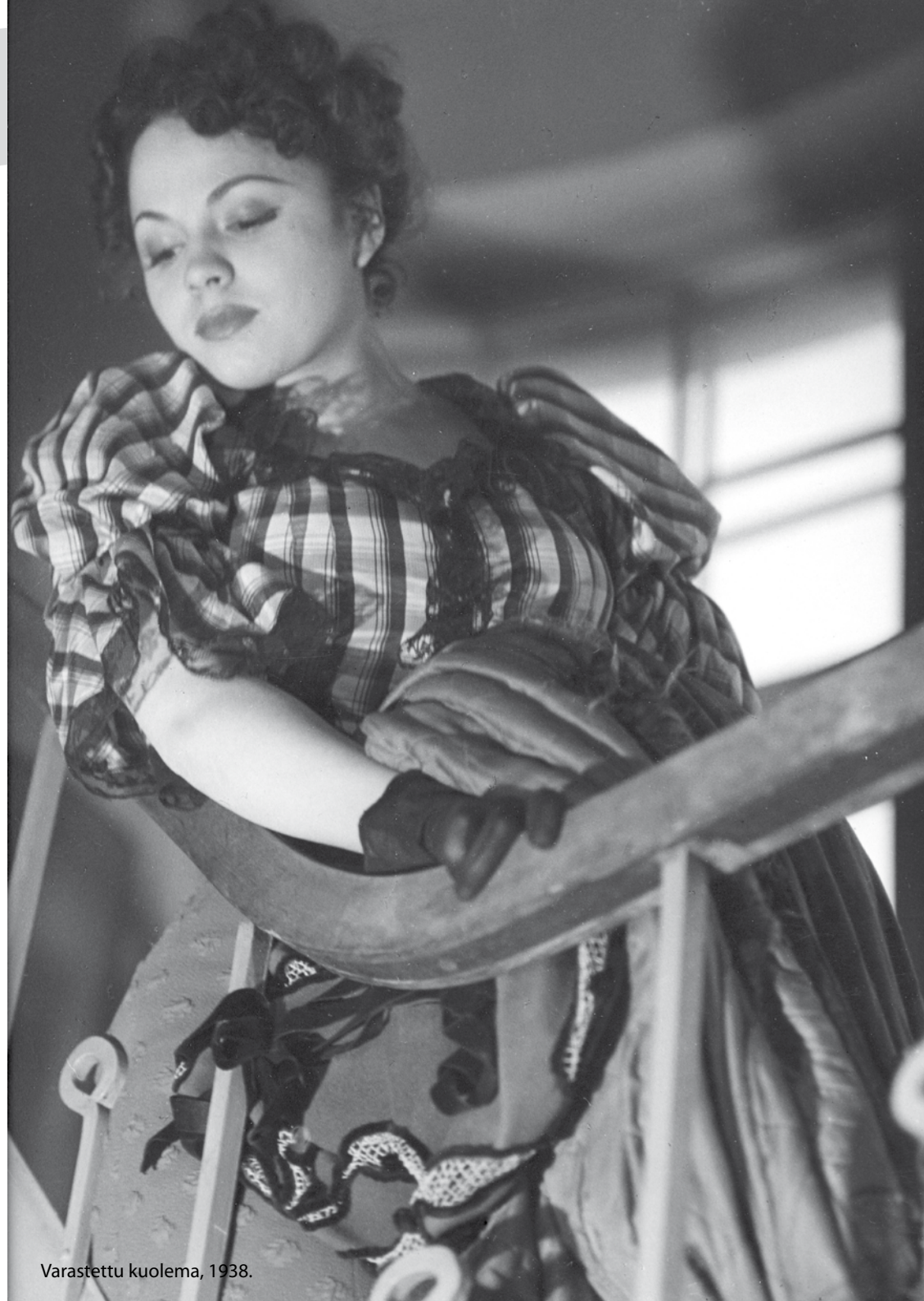
Varastettu kuolema, 1938.

Festivaalin erityistapahtumiin kuuluu myös Nyрки Tapiovaaran Varastetun kuoleman (1938) esitys. Tämä legendaarinen, villisti kokeileva jännityselokuva on vaikuttanut seuraaviin sukupolviin kenties enemmän kuin mikään muu kotimainen