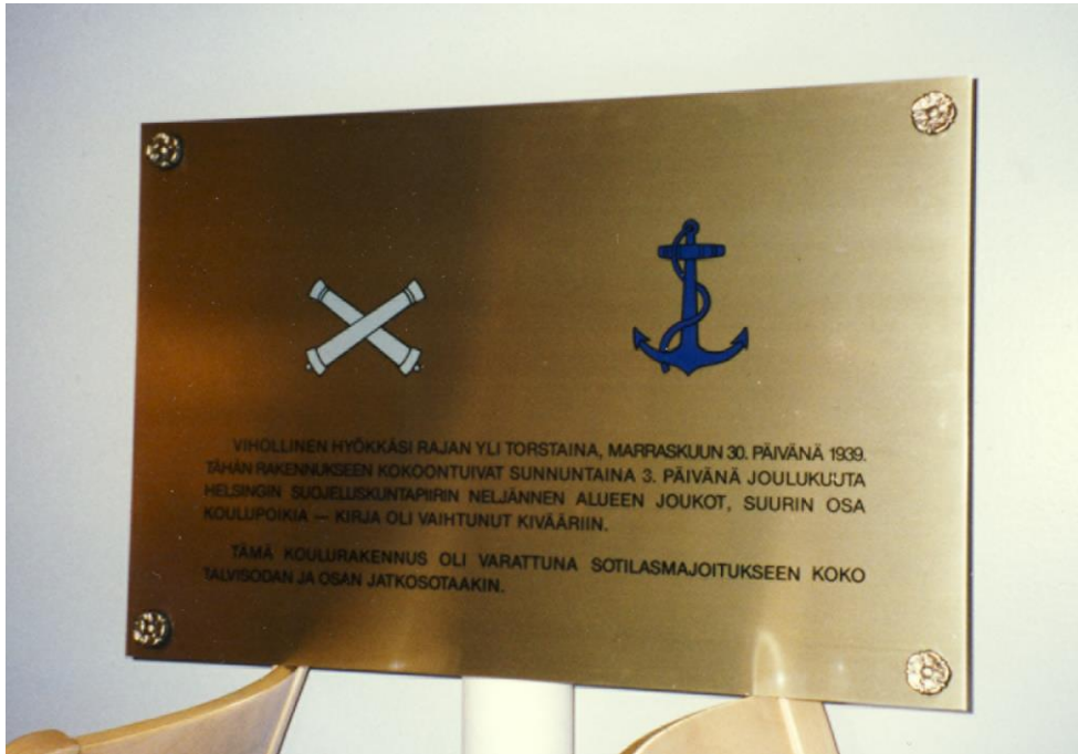
Kuva 6. Käpylän laivueen muistolaatta.

Laivue järjesti myös perustamisensa 50-vuotismuistojuhlan 3.12.1989. Juhlan ohjelmaan kuului seppeleenlasku Hietaniemen hautausmaalla, jumalanpalvelus sekä iltajuhla Katajanokan kasinolla. Ennen iltajuhlaa paljastettiin muistolaatta laivueen entisen majoituspaikan, nykyisen Käpylän peruskoulun aulaan. Muistolaatan paljastustilaisuudessa juhlapuheen piti yleisesikuntaeverstilutnantti Armas Salin, joka talvisodan aikana oli vastannut koulun muuttamisesta sotilasmajoituskäyttöön. 99 Laivueen perinnejoukon olemassaolo jäi kuitenkin lyhytaikaiseksi, sillä aiemmin kuvatun yhteiskunnallisen ilmapiirin muutoksen katsottiin mahdollistavan oman virallisen yhdistyksen perustaminen. Käpylän laivueen miehet olivatkin avainasemassa perustettaessa Helsingin suojeluskuntapiirin perinnekiltaa. 100