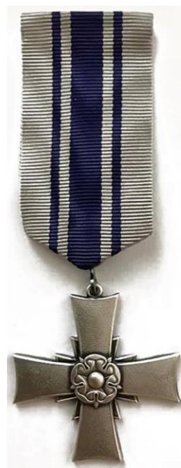
Kuva 13. Lottaperinnettiiton lippu ja ansioristi.

Lottaperinnettiiton paikallistason toiminta tapahtuu lottaperinneyhdistyksissä. Toiminnan eri muotoina ovat olleet esimerkiksi laulutilaisuudet, esitelmät, näyttelyt retket, osanotot erilaisiin isänmaallisiin juhliin sekä paikallishistorioiden julkaiseminen. 142 Ensisijaisen tehtävänsä Perinnettiitto on kuitenkin alusta lähtien nähnyt nimenomaan lottaperinteen vaalimisessa, ja tätä tehtävää se on hoitanut niin lottaineistokeräysten, museoiden kanssa tehtävän yhteistyön kuin muistolaattojen hankkimisen avulla. Perinnettiitto on myös tukenut esimerkiksi Lupaus-elokuvan tuottamista sekä korjannut yhteistyössä Kustannusosakeyhtiö Otavan kanssa oppikirjoissa esiintyneitä virheellisiä väitteitä lotista. Liitto käynnisti Lottien Suomi -historiahankkeen, joka tuotti kaikkiaan neljä tutkimusta. 143