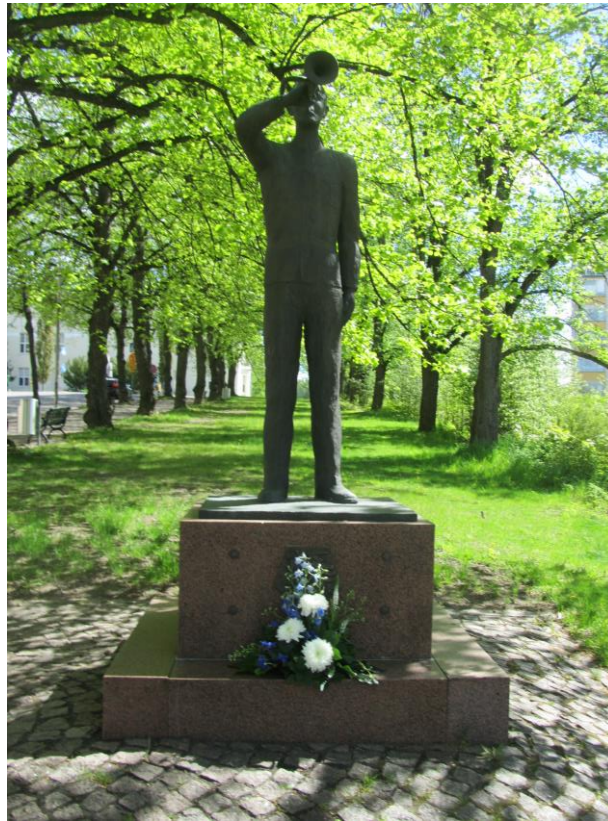
Kuva 12. Sotilaspoikien Perinneliiton lippu ja Sotilaspoikapatsas.

Rintamanaisten liitto oli tarjonnut osalle sotaponnisteluihin osallistuneista naisista järjestöllisen ”kodin”, mutta jäsenkriteerien vuoksi kaikki lotat eivät voineet päästä järjestön jäseniksi. Niinpä liitto asetti toimikunnan pohtimaan sääntöjen uudistamista. Toimikunta päätyi kuitenkin aiemmin mainituista syistä ehdottamaan uuden järjestön perustamista.