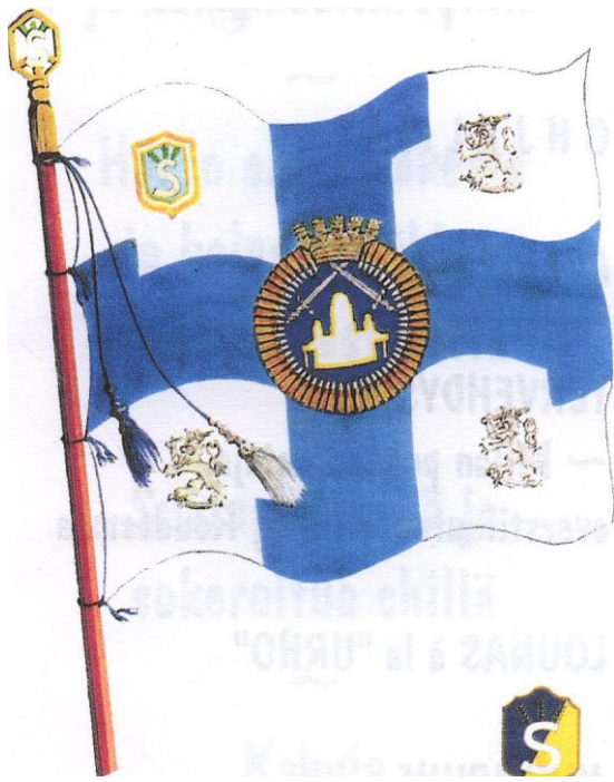
Kuva 7. Perinnekillan lippu.

Kuivasaaren linnakkeelle sekä Hämeenlinnaan Tykistömuseoon Vuonna 2004 retki suuntautui Tallinaan, jossa tutustuttiin Tallinnan suojeluskunnan toimintaan 115 . Retkillä käytiin kuitenkin myös muissa kohteissa, esimerkiksi vuoden 1992 retkellä vierailtiin paitsi Taistelukoulussa, myös Halosen taiteilijakodissa ja Ainolassa. Lisäksi yhdistys on osallistunut Maanpuolustusmessuille sekä Mannerheimin patsaalla kesäkuun 4. päivänä järjestettyihin juhlallisuuksiin sekä Helsingin valtauksen muistopäivän juhlallisuuksiin ja järjestänyt jäsenilleen myös esimerkiksi teatterimatkoja Tampereelle. Eräs valtakunnallisestikin