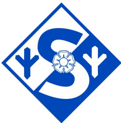
Kuva 17. Suojeluskuntajärjestön Perinteet ry –järjestön tunnus.

Internetsivuston ja perinnekirjaston luomisen lisäksi SLPL:n toiminnan kohokohtiin 2000-luvulla lukeutuu myös suojeluskuntien perustamisen 100-vuotisjuhla, joka järjestettiin 2.8.2018 SLPL:n ja Helsingin perinnekillan yhteisenä ponnistuksena. Lähinnä järjestön omalle väelle ja sidosryhmille suunnattu juhla järjestettiin Tuusulan Taistelukoululla, ja siihen kuuluivat seppeleenlaskut Seinäjoella suojeluskuntapatsaan luona, Lahdessa sotilaspoikapatsaalla, Tuusulan lottapatsaalla sekä Hietaniemen sankarihautausmaalla. Varsinainen juhla jakautui seminaaripäivään sekä iltatilaisuuteen Taistelukoulun