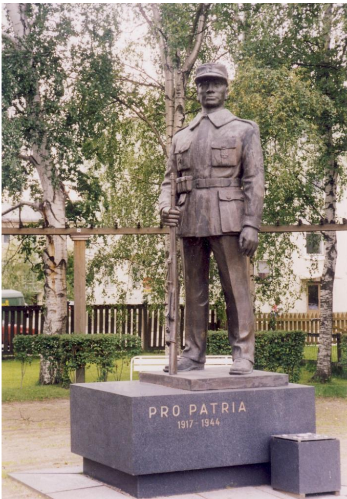
Kuva 5. Patsas sijaintipaikallaan.

Helsingin kaupungin linjan johdosta työvaliokunta kokoontui 28.11. pohtimaan muita vaihtoehtoja. Jo syksyllä patsastoimikuntaan olivat olleet yhteydessä mm. Seinäjoen ja Lapuan kaupungit sekä Luumäen kunta, jotka kaikki ilmaisivat halukkuutensa saada patsas omalle paikkakunnalleen. Käytyään 3.12. neuvotteluja Seinäjoen kaupungin edustajien kanssa patsastoimikunnan puheenjohtajisto esitti yksimielisenä patsaan sijoittamista Seinäjoelle. Seinäjoen kaupunginhallitus käsitteli asian, ja päätti äänin 8–3 aloittaa valmistelut patsaan pystyttämiseksi. Tekninen virasto sai tehtäväkseen selvittää patsalle sopivia paikkoja. Patsaan paikan muuttuminen pääkaupungista Seinäjoelle ei kuitenkaan hillinnyt lehdis- tökeskustelua ja toimikunta sai vastaanottaa monenlaista ”kansalaispalautetta”. 86