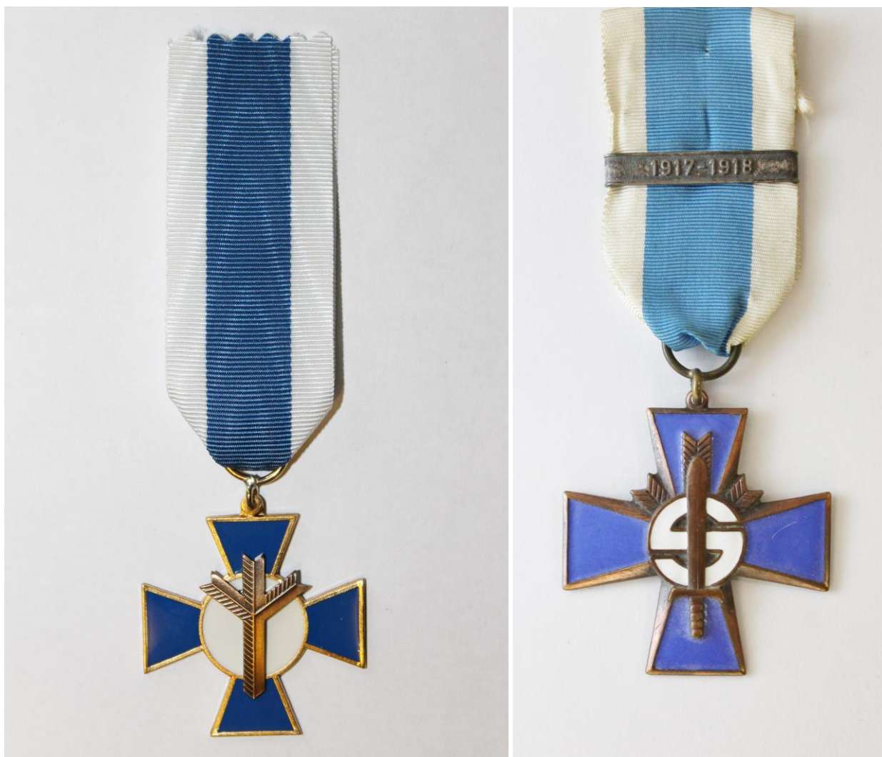
Kuva 4. Sinisen ristin eri versiot.

turi-lehteä, joka alkujaan oli tarkoitettu säätiön tiedotuslehdiksi. Vapaussotaan liittyvien kirjoitusten lisäksi lehti julkaisi myös suojeluskuntia käsitteleviä artikkeleita. 67 Niin ikään entisten suojeluskuntalaisten kannalta keskeinen perinnetyön muoto oli Vapaussoturien huoltosäätiön vuonna 1967 hyväksymä Sininen risti -kunniamerkki, joka voitiin myöntää paitsi vapaussotaan osallistuneille ja heimosotureille, myös entisille suojeluskuntalaisille, lotille sekä ilman kanto-oikeutta muistoesineen omaisesti myös edellämainittujen omaisille. 68 Tämän kenties monelle myöhemmin luodulle kunniamerkille esikuvana toimineen merkin lisäksi Huoltosäätiö toteutti myös patsashankkeen, jolla silläkin lienee ollut oma roolinsa myöhempien hankkeiden esikuvana, nimittäin Mannerheimin patsaan pystyttämisen Tampereelle 1956. Huoltosäätiö järjesti myös vapaussodan tasavuosimuistojuhlia sekä piti yllä vapaussodan muistoa esimerkiksi järjestämällä seminaareja, pystyttämällä muistomerkkejä ja pyrkimällä vaikuttamaan esimerkiksi koulukirjoissa esitettyyn kuvaan sisällissodasta. 69