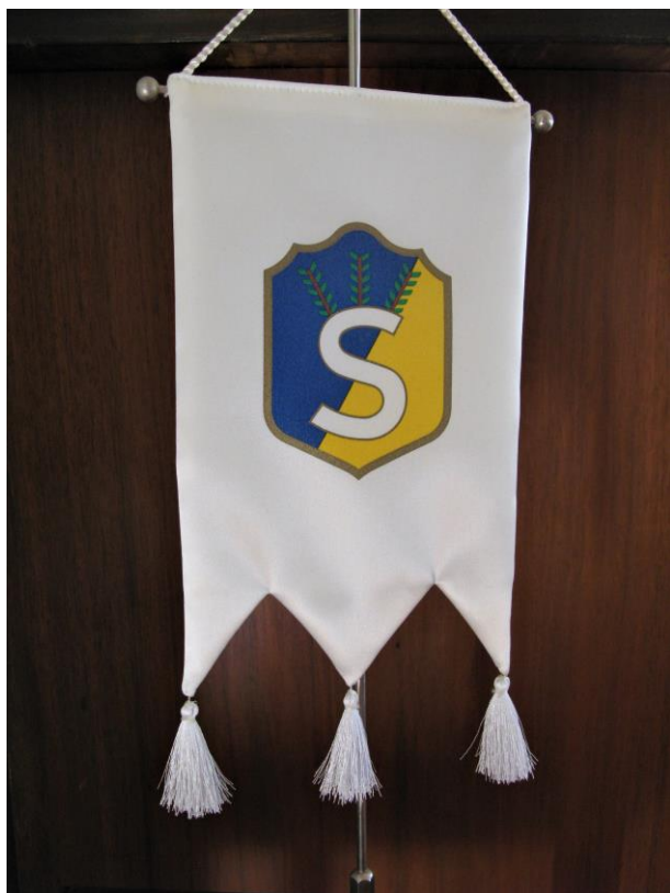
Kuva 14. Turun tapahtumassa myynnissä oli mm. erilaisia suojeluskuntastandaareja. Tässä Helsingin suojeluskuntapiirin standaaari.

Neuvostoliiton hajoaminen ja uuspatriootin käännöksen eivät nostaneet uudelleen esiin ainoastaan vuonna 1944 lakkautettuja järjestöjä ja niiden jättämää perintöä, vaan ajankohtaistivat uudella tavalla myös vuoden 1918 sisällissodan muistamisen. Vuonna 1993 kolme sisällissodan valkoisen puolen muistoa vaalinutta organisaatiota, Vapaussoturien Huoltosäätiö, Tammikuun 28. päivän Säätiö sekä P. E. Svinhufvudin Muistosäätiö perustivat Vapaussodan perinliiton Vapaussoturien Huoltosäätiön maakunnallisen organisaation pohjalle kokoamaan yhteen valkoista vapaussota-näkökulmaa vaalivat kansalaiset ja järjestöt. 147 Liitto tekee työtä myös suojeluskunta- ja lottaperinteen säilyttämiseksi sekä tietouden levittämiseksi. Liitto toimii lähinnä alueellisten perinneyhdistysten kautta, ja sen jäsenenä on myös Akateemisen Karjala-seuran perinneyhdistys sekä jo 1930-luvulla perustettu Pohjan Poikain Yhdistys. 148 Vapaussodan perinliitto julkaisee Vapaussoturi-lehteä ja järjestää yksin ja yhdessä muiden perinnejärjestöjen kanssa juhla- ja esitelmätilaisuuksia. Liitto huolehtii myös Sinisen Ristin myöntämisestä. 149