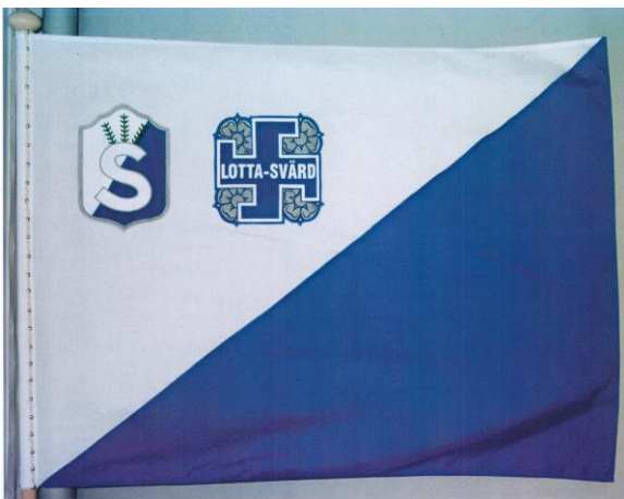
Kuva 9. Oulun suojeluskunta- ja Lotta Svärd -piirin perinnekillan lippu.

Killan toiminnan tavoitteina on oikean tiedon kertominen suojeluskunnista ja lotista sekä perinnemateriaalin taltiointi. Tässä tarkoituksessa kiltä järjestää esimerkiksi juhlia, retkiä ja muistojuhlia sekä jakaa lottamuistomitaleita, kiinnittää muistolaattoja ja tuottaa historiikkeja ja järjestää näyttelyitä. Killalla on oma lippu (vuodesta 1996) ja pienoislippu, jonka mallina toimi vanha Oulun suojeluskuntapiirin lippu. 127