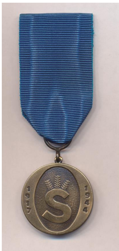
Kuva 15. Suojeluskuntien perinnemitali.