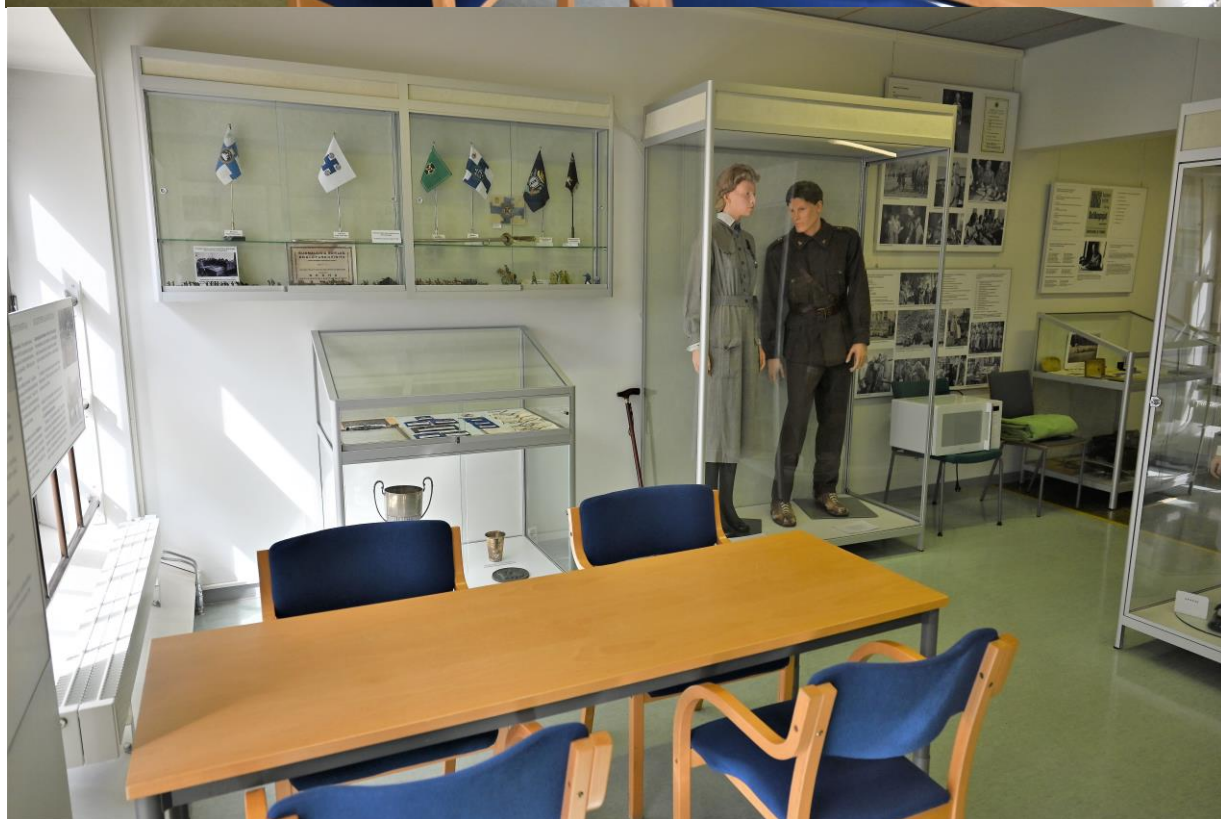
Kuva 8. Kuvia perinnehuoneesta.

Helsingin killan ohella yksi vanhimmista suojeluskunta- ja Lotta-Svärd-piirien perinnekilloista toimii Oulussa. Oulun killan juuret ovat Suomen Maanpuolustushistoriallisen yhdistyksen toiminnassa: SMHY järjesti 1. joulukuuta 1990, siis jo ennen valtakunnallista lottajuhlaa, Oulussa Lotta-Svärd-