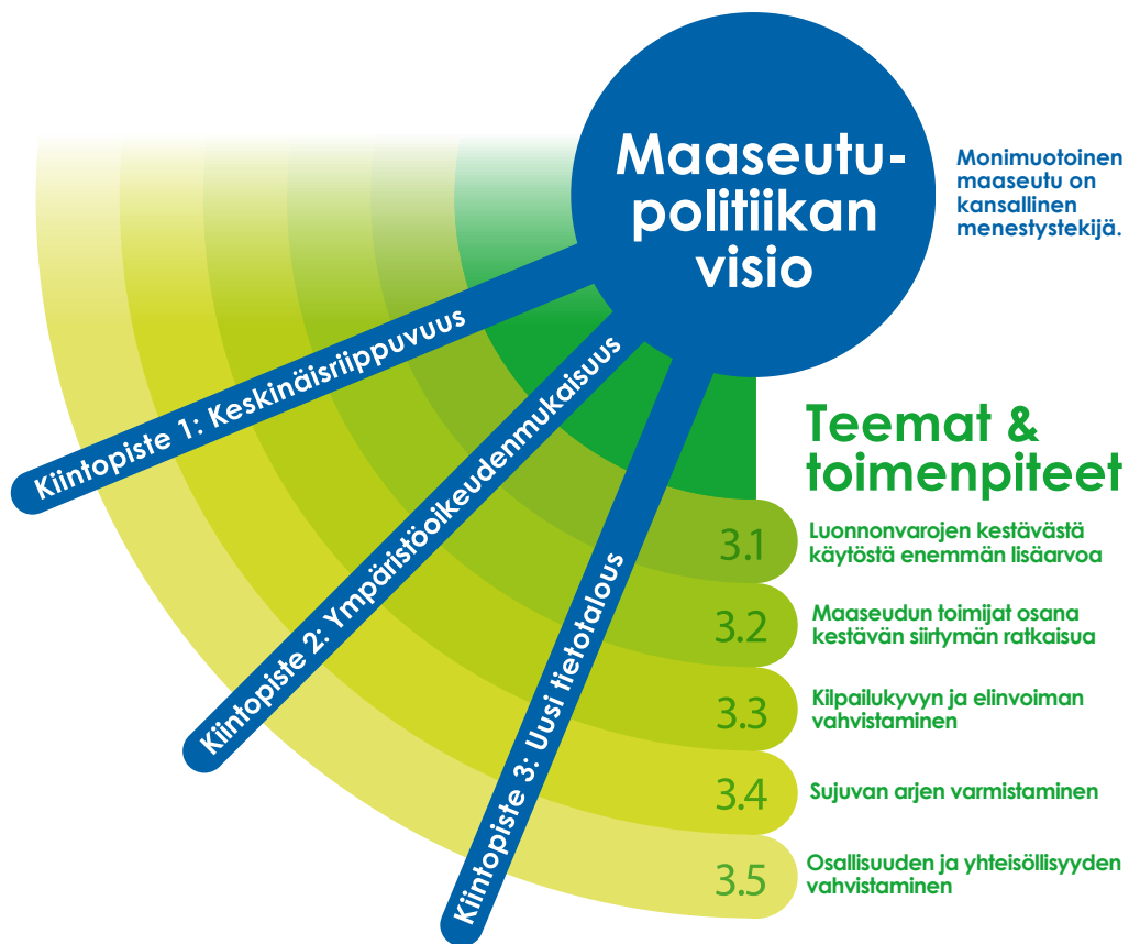
Kuva 4. Maaseutupolitiikan visio, kiintopisteet ja teemat

Luvussa kaksi esitetty visio ja strategisten kiintopisteiden tavoitteet ohjaavat tässä luvussa esitettyjä teemoja ja toimenpiteitä. Strategiset kiintopisteet (kts. luvut 2.1-2.3) läpileikkaavat ohjelman teemoja ja toimenpiteitä eri painoituksin (kuva 4).