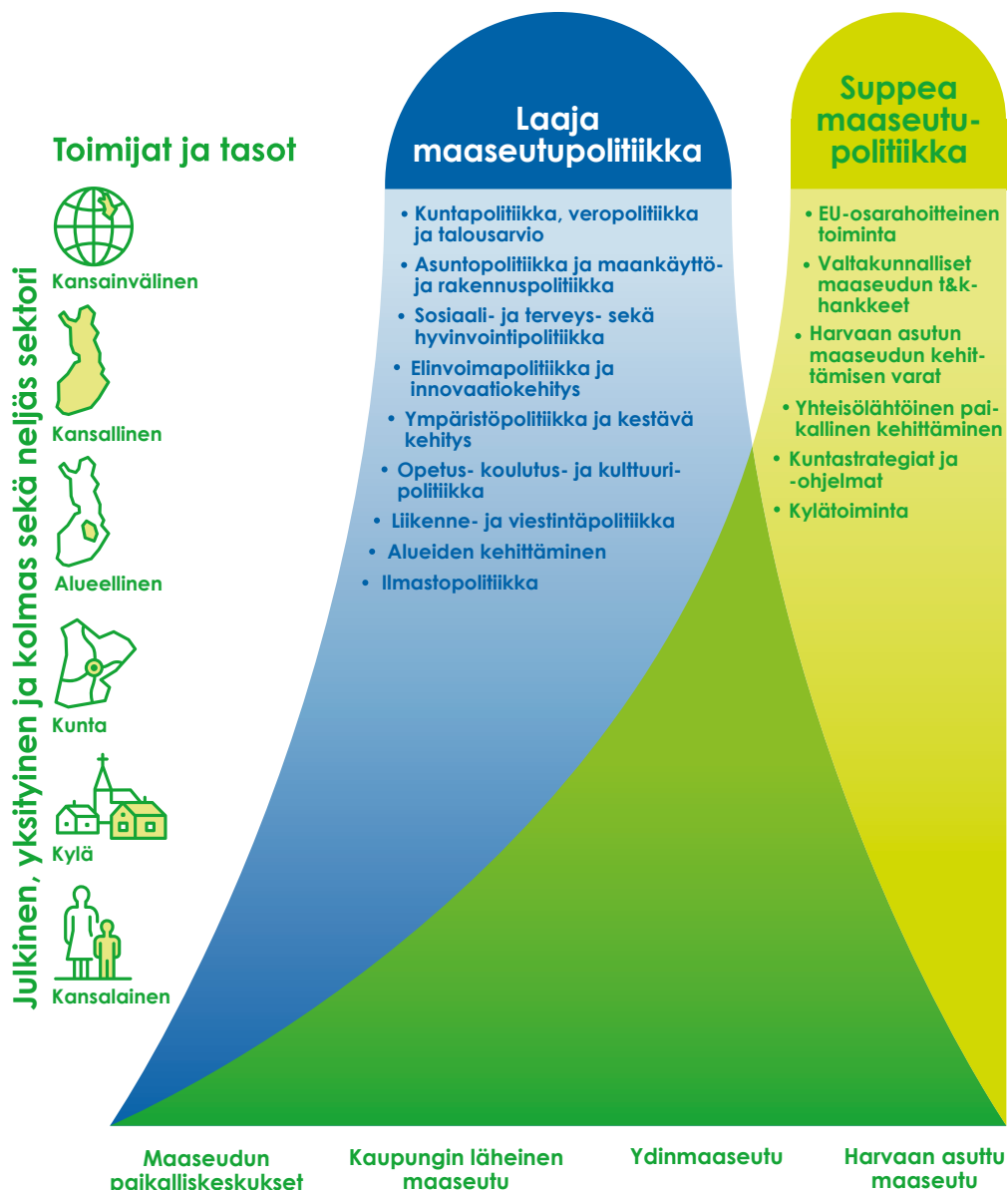
Kuva 3. Laaja ja suppea maaseutupolitiikka – maaseutupolitiikka politiikan kentässä

Valtioneuvoston asettaman maaseutupolitiikan neuvoston (MANE) tehtävänä on yhteensovittaa laajan ja suppean maaseutupolitiikan kehittämistoimia. Painopiste on laajassa maaseutupolitiikassa. Tavoitteena on suunnata ja tehostaa maaseutuun kohdistettavia politiikkatoimia ja resurssien käyttöä.