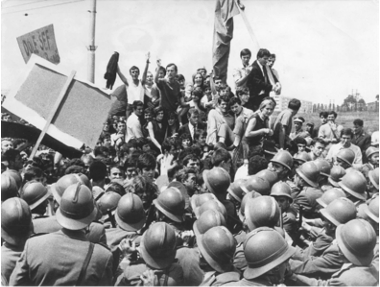
Opiskelijamielenosoitus Belgradissa 1968.

kysymys. Mutta jos me toteutimme vallankumouksen 50 vuotta sitten ja olimme tuolloin lähempänä demokratian todellista olemusta ja kommunistisia ideaaleja, voidaan tietysti tuosta historiallisesta lähtökohdasta olettaa, että se ei ole poissuljettu vaihtoehto. [--] 3