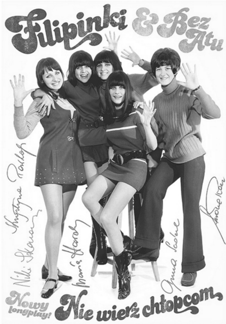
Vuonna 1959 perustettu puolalainen lauluyhtye Filipinki vuonna 1970 julkaistussa yhdessä Bez Atun kanssa tehtyä ”Nie wierz chłopcom” -levyä mainostavassa postikortissa.