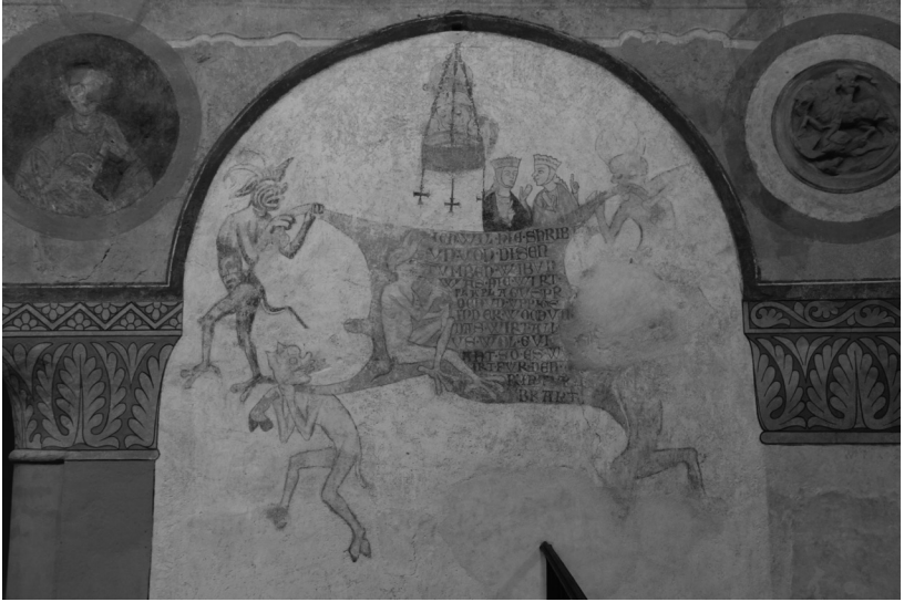
Sankt Georg, Reichenau.

kieltään, jolla vahingoittaa toista. Ne, jotka tässä onnistuvat, ovat täydellisiä – pyhimysten kaltaisia.” 34 Toisin sanoen sellaisia kuin Zita.