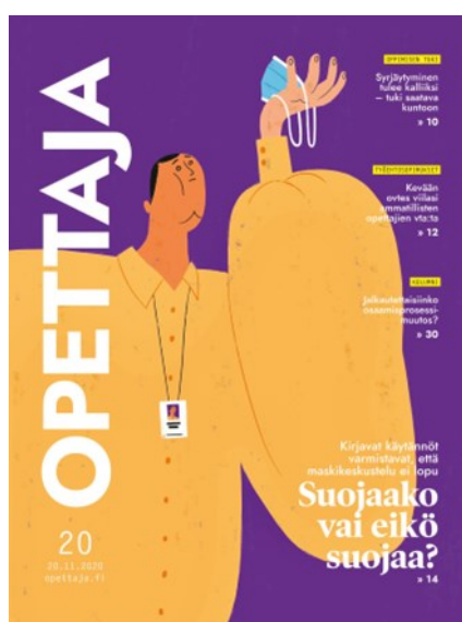
Kuva 1. Opettaja-lehden kansi 20.11.2020

Opettaja ei ole opettajistolle suunnatuista lehdistä ainoa, mutta toisin kuin vaikkapa Luokanopettaja-lehti 2 se ei ole vain tietyille opettajaryhmälle suunnattu erikoislehti. Opettaja-lehti on myös aikakauslehti, toisin kuin esim. Kasvatus-lehti, joka on tieteellinen vertaisarvioitu julkaisu ja viidellä vuosittaisella numerollaan huomattavasti harvemmin ilmestynvä kuin Opettaja. 3