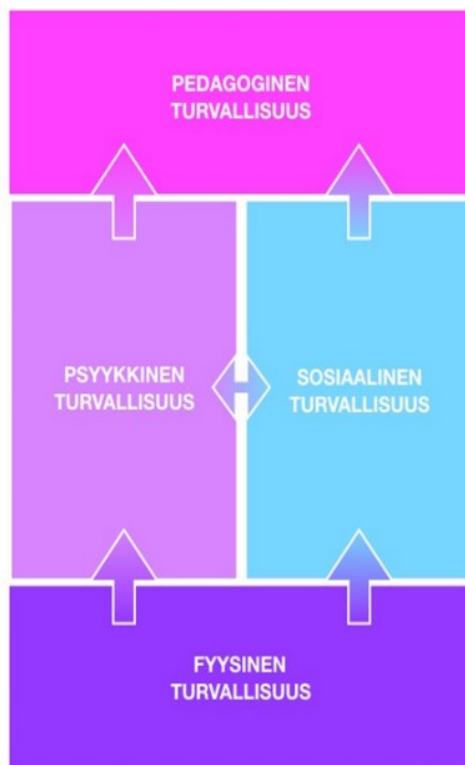
Kuvio 2. Turvallisuuden neljä ulottuvuutta