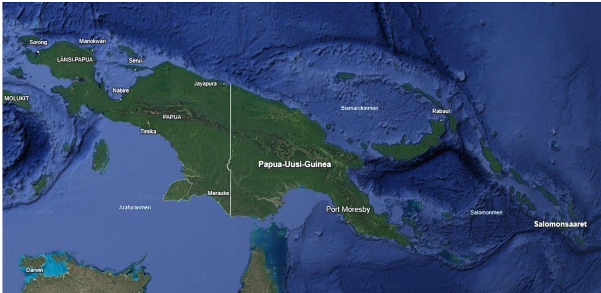
Kuva 1. Tutkimusalue. Kuvassa näkyy Aru-saaret Arafuranmeressä, Bismarckinsaaret ja Amiraliteettisaaret Bismarckinmeressä, Milnenlahden saaret Uuden-Guinean ja Salomonsaarten välissä, Japanin saaren pääkaupunki Serui sekä Biakin saari Japanista pohjoiseen, ja Raja Ampat -saaret Länsi-Papuan Doberain niemimaan, jossa Länsi-Papua lukee kuvassa, länsipuolella. Karttadata: Google Earth