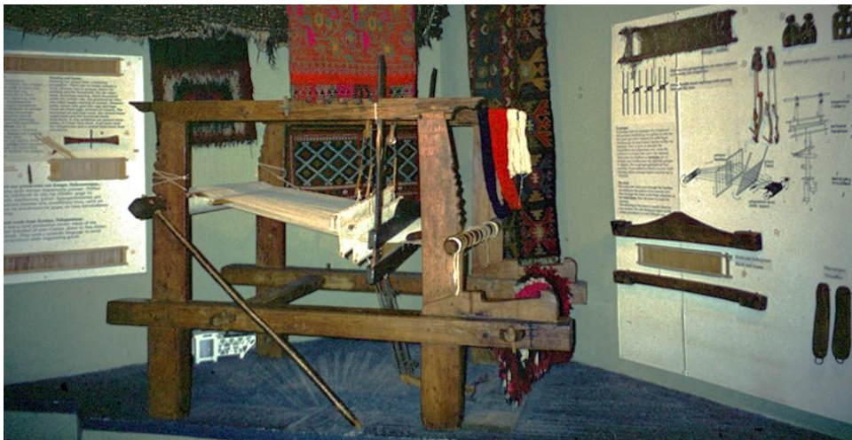
Kangaspuiden käyttöä esittelevä nurkkaus museon vanhassa perusnäyttelyssä.

Museon yläkerran näyttelytilassa oli esillä eri alueiden kansanpukuja. Ne oli ryhmitelty erilaisten vaikutteiden mukaan. Ensimmäinen ryhmä edusti bysanttilaisia ja itämaisia vaikutteita. Ensimmäiset vitriinit esittelivät pukuja Peloponnesoksen niemimaalta, joissa näkyivät bysanttilaiset vaikutteet. Seuraavat vitriinit esittelivät itämaisia, pääasiassa persialaisia vaikutteita, joita oli nähtävissä ottomaanisen ajan kaupunkilaispuvuissa. Samoihin vaikutteisiin luettiin myös kreikkalainen korusto ja osa Pohjois-Kreikan asuista. Toinen pääasiallinen