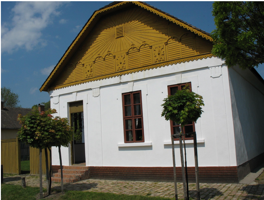
Paprikanviljelijän talo kadun puolelta nähtynä.

sen yhteydessä, hänen parhaaksi vaihtoehdoksi ajattelemansa talo oli jo purettu. Juhász in onnistui kuitenkin löytää talon alkuperäiset rakennuspiirustukset vuodelta 1883 kaupungin arkistosta. Näiden ja hänen omien dokumentaatioidensa perusteella oli mahdollista rakentaa vastaava talo ulkoilmamuseoon. Talo on huomattavan suuri talonpoikaistalo, jossa on viisi huonetta rivissä: huone, keittiö, huone, varasto ja takahuone. Siinä on pitkä kuisti ja viimeisenä paprikan kuivaukseen käytetty tila. Tämä rakennus edustaa porvarillistunutta talonpoikaiskulttuuria, joka kukoisti 1900-luvun alusta 1930-luvulle. Alueen talopojoista nopeimmin porvarillistuvia olivat juuri szegediläiset paprikanviljelijät ja makólaiset sipulinviljelijät. Heille oli mahdollista rakentaa uusia taloja, hankkia porvarillisia huonekaluja ja maalata huoneitaan. Sen sijaan csongrádilaisten kalastajien ja karrääjien ei ollut mahdollista päästä eteenpäin ja heidän elämäntapansa oli paikallaan polkevaa. (TYKL spa/148/u:8:1 ja 2.)