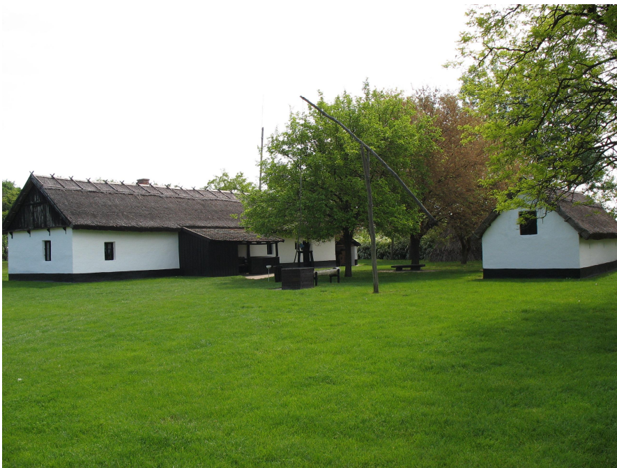
Szentesiläinen yksittäistila. Kuva: Hanneleena Hieta 2006.

Seuraavana vuonna puistoon valmistui szentesiläinen yksittäistila. Szentesistä Juhász päätti hankkia sen siksi, että samoihin aikoihin Hódmezővásárhelyiin oli jo valmistumassa yksittäistilamuseo (Nagy V. 1999, 47). Tämän tilan hankkiminen oli edellistä vaikeampi tehtävä, koska Tisza-joen idänpuoleisella maaseudulla yksittäistiloja oli lopetettu nopeammin ja suuremmassa määrin 1960-luvun aikana. Tämä johtui maatalouden kollektivisoinnista, jonka seurauksena niin yksittäistilojen asukkaat joutuivat muuttamaan kyliin ja kaupunkeihin kuin maaseutukoulut sulkemaan ovensa. Museoon kuitenkin onnistuttiin hankkimaan jo asumaton yksittäistila talousrakennuksineen. Rakennusten yhteydessä oli myös pohjakaavaltaan ympyränmuotoisen karjasuojan jäänteet. Jotta uudelleen pystytettävä karjasuoja olisi uskottava, oli kuitenkin tutkittava toisilla tiloilla paremmin säilyneitä samanlaisia karjasuojia. Tämä tila edustaa karjankasvatusta ja viljanviljelyä. (TYKL spa/148/u:8:1 ja 2.)