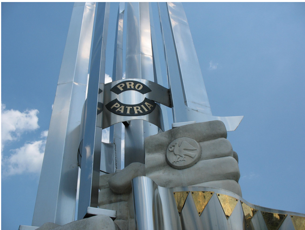
Unkarilaisen sotilaan muistomerkki Ópusztaszerissa. Muistomerkin kustansi puolustusministeriö.

jälkimmäisistä hän mainitsi liikenneministeriön lahjoittaman tienvartijoiden talon, joka liittyi kansatieteelliseen ulkomuseoon. Se avattiin heinäkuussa 2000. Läänien lahjoittamina puistoon saatiin jokaiselta lääniltä yksi Unkarin historian suurmiehen pronssimuotokuva, näistä kaksi oli jo valmiina vuonna 2000. Lisäksi suunnitteilla oli puolustusministeriön sponsoroima unkarilaisen sotilaan muistomerkki. Mielenkiintoista olikin, että sponsorirahoitus ei kuitenkaan tullut liike-elämältä vaan julkisyhteisöiltä. Toinen rahoitusmuoto, jota puisto mielellään hankki, olivat massakokoukset. Puistossa olivat viettäneet tapaamisiaan mm. Unkarin Punainen risti ja unkarilaisen reformoidun kirkkokunnan edustajien maailmanjärjestö. Uusien kävijäryhmien saamiseksi puistoon Szabó piti tärkeänä juuri näitä massatapahtumia, mutta myös koulujen kanssa tehtävää yhteistyötä. Koululaisista tulisi uusia kulttuurin kuluttajia. Lisäksi Szabó puhui siitä, miten puiston vetovoimaa voitaisiin kasvattaa kulttuuriturismin keinoin. Puiston itsestään tulisi olla siisti ja houkutteleva. Lisäksi puistossa toimi Unkarin virallinen turistiorganisaatio Tour-inform, joka yhdisti Ópusztaszerin kaikkiin Unkarin matkailukohteisiin. Szabón sanoma oli: Ópusztaszer kilpailee kulttuuriturismin markkinoilla. "Täällä nähtävästä kulttuurista tehdään myytävää kulttuurituotetta." ( [A]z itt látható kulturát azt eladható kulturtermékké szervezzük ) (TYKL/spa/148/u:9:2.)