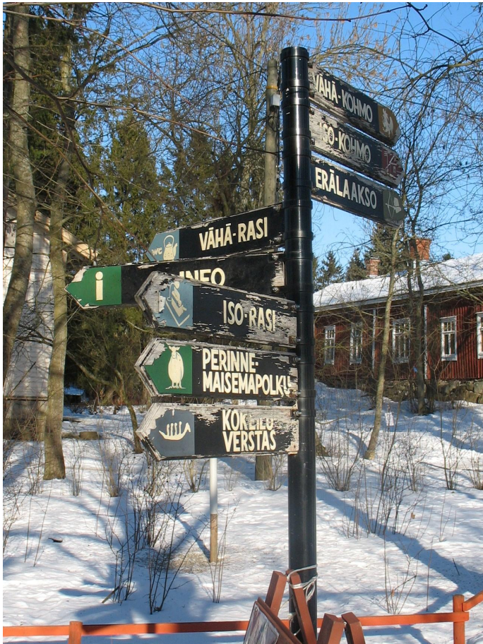
Kuralan viitat talvella 2009.

yhteydessä valmisteltuja syntymäpäiväpaketteja Kylämäki alkoi markkinoida vuodesta 2004 alkaen. Vuonna 2005 pidettiin 51 kertaa 1950-luvun henkiset maatilasynttärät, joille osallistui 650 lasta. Kesäkauteen rajoittuvia pojille suunnattuja metsästyssynttäreitä pidettiin 20 kertaa, ja niillä osallistujia oli 200. Aikuisille oli koottu vastaavasti polttaripaketteja. (Setälä 2006.)