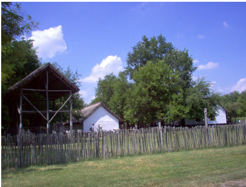
Szegediläinen yksittäistila.

Unkarin tasankoalueen maantieteelliset olot vaikuttivat suoraan rakennustekniikoihin. 1700-lukuun mennessä alueesta oli tullut puutonta pusta, mikä aiheutti puun säästeliästä käyttöä rakentamisessa. Vain ovet, ikkunanpuitteet, lattiat ja kattorakenteet tehtiin puusta, jota kuljetettiin jokia pitkin vuoristojen metsävyöhykkeeltä. Muutoin rakennukset olivat kotitekoista savitiiltä. Tasangon asuinrakennukset olivat nk. keski-madjaarityyppiä, jolle tunnusomaisia olivat riviin sijoittuneet asuinhuone-keittiö-asuinhuone -yhdistelmät ja keittiön puolelta lämmitettävät saviuunit. (Cseri & Füzes 1997, 46–50.)