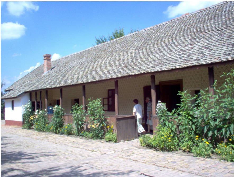
Sipulinviljelijän talo sisäpihalta nähtynä.