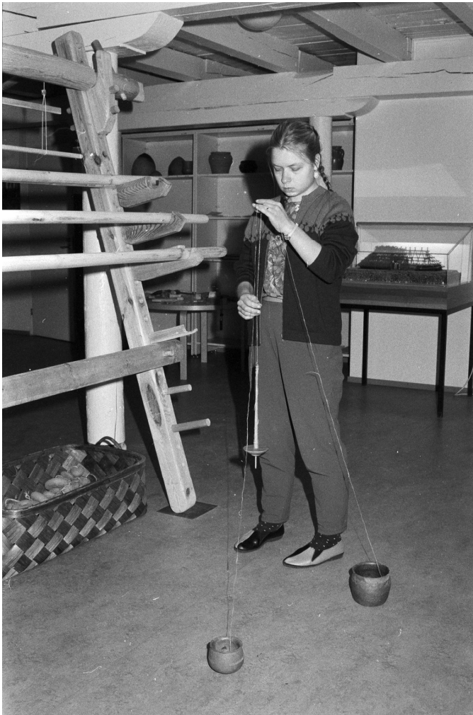
Kaarinan muinaispuvun valmistamista 1993. Käsinkeh- rätyn rihman kertausta värttinällä langaksi. Taustalla näkyvät esihistoriallisen puvun kankaan kudonnassa käytetyt pystykangaspuut.

maaseutuoppilaitokset sekä maatalousyrittäjät. Lisäksi tutkijoilla oli omia kansainvälisiä kontakteja. Vuonna 2001 Kylämäki oli myös toiminut yhteistyössä Turun yliopiston kansatieteen oppiaineen kanssa kenttätutkimuskurssin yhteydessä. (Qvick et al. 2002, 9–10.) Seuraavassa tarkastelen Kylämäen suhteita yliopistoihin, marttoihin ja kouluihin sekä kävijöistä lapsiperheisiin ja lähiseudun asukkaisiin.