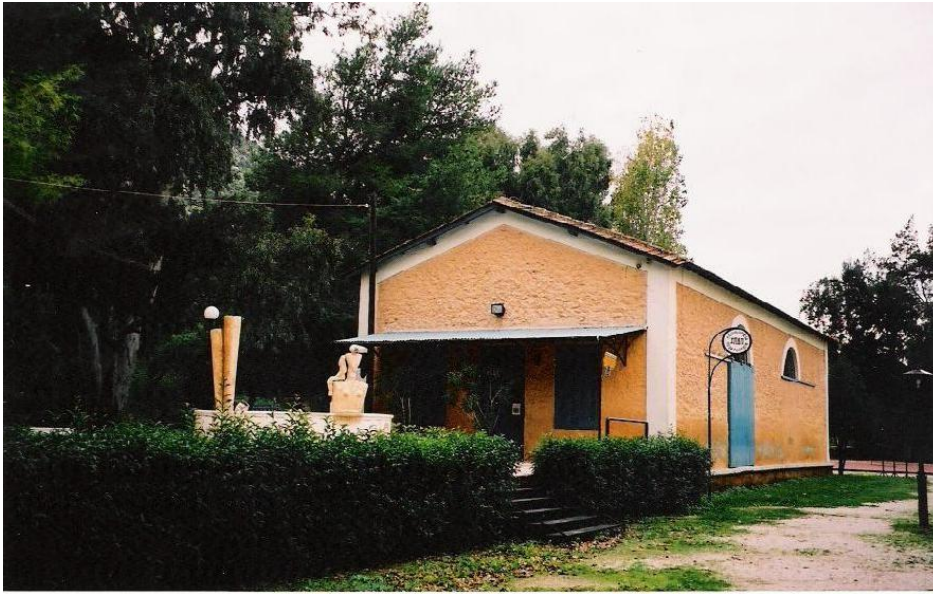
Stathmós. Kuva: Hanneleena Hieta 2002.

karnevaalisalon ympärillä tanssimista ja leijanlennätystä laskiaisena sekä valmistivat muna-koreja ja pääsiäispikkuleipiä pääsiäisenä. Kun museo piti varjonukkenäyttelyn, lapset kirjoittivat omia näytelmiään ja esittivät niitä itse tekemillään nukeilla. Vuonna 1985 museo järjesti Lapsi ja lelu -näyttelyn, joka enteili lasten museon perustamista. (TYKL/spa/148/k:8.)