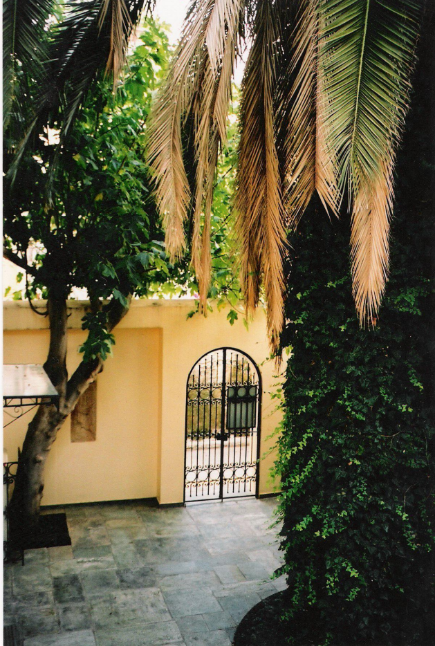
Museon sisäpiha.