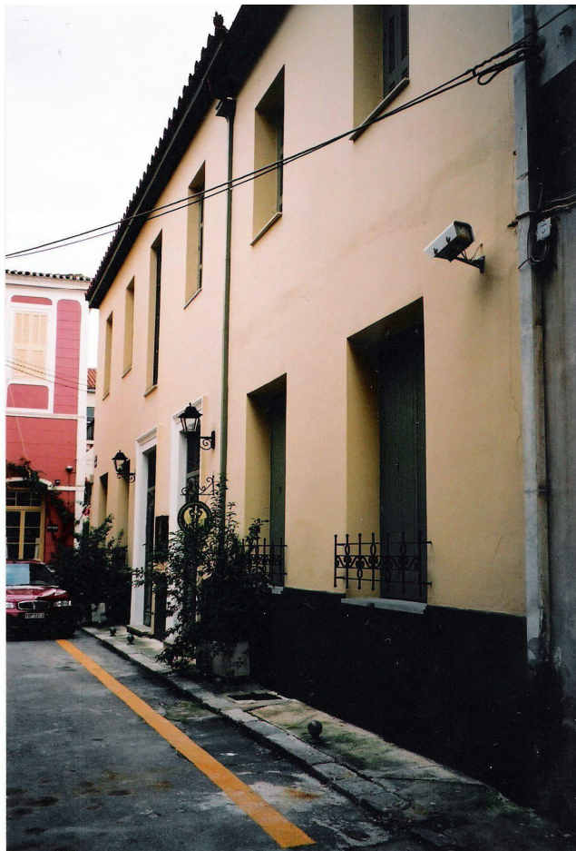
Museorakennus Kuningas Aleksanterin kadulla. Kuva: Hanneleena Hieta 2002.

( Εθνογραφικά 2, 145.) Ioánnas Papantoniún mukaan tämä johtui siitä, että Papadópolos halusi