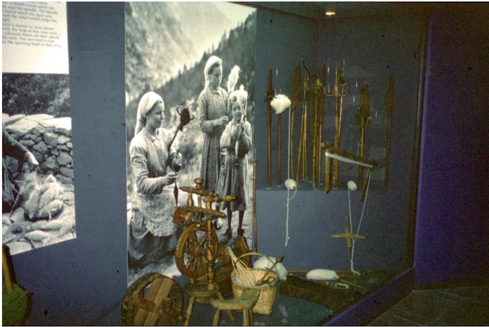
Langanvalmistusta esittelevä vitriini museon vanhassa perusnäyttelyssä. Kuva: Hanneleena Hieta 1997.