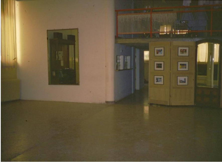
Kansantanssiryhmän harjoittelutila. Parvella tekstiilien huoltotila ja pukuvastasto.