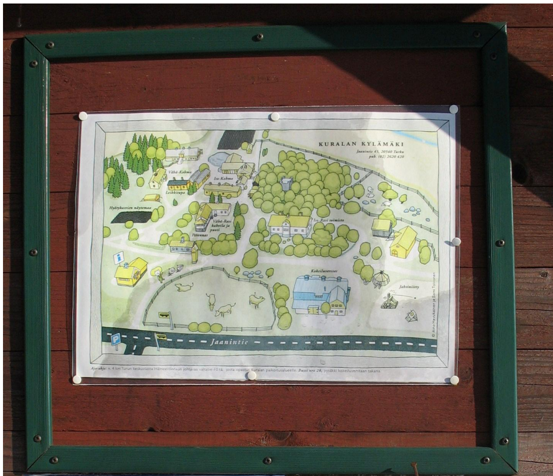
Kuralan Kylämäen aluekartta. Vasemmalta ylhäältä oikealle alas: Vähä-Kohmo, Iso-Kohmo, Vähä-Rasi, Iso-Rasi, Iso-Rasin navetta (kokeiluverstas) ja jahtiniitty. Kuva: Hanneleena Hieta 2009.

tarkoitukseen ajateltiin Ison-Rasin navettaa. Lisäksi oli tarkoitus järjestää vuosittainen pukukavalkadi, jossa osa puvuista olisi esihistoriallisia. Tarkoitus oli nivoa arkeologinen toiminta tiiviisti Turun yliopiston arkeologian opetukseen. Kesäisin opiskelijat saattoivat tehdä kokeita ja toimia työnesittelijöinä yleisölle. Saatujen tulosten perusteella olisi mahdollista kirjoittaa opinnäytetöitä seuraavan lukukauden aikana. Yhteydenpitokanavaksi museon ja arkeologian laitoksen välillä tuli opiskelijoiden aineyhdistys Vare ry. (Hyvönen & al. 1984, 19–27.)