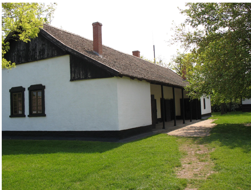
Yksittäistila-alueen lukutupa.

Yksittäistilojen yhteyteen, samaa elämäntapaa kuvastamaan, kuuluvat myös lukupiirin ( olvasókör ) tupa ja kansakoulu. Juhász kuvailee niihin liittyviä yhteisöllisiä asioita haastattelussa pitkään. Hän on myös kirjoittanut niistä paikallishistorialliseen Szeged -aikakausjulkaisuun. 1800-luvun loppuvuosikymmeninä pelkästään Hódmezővásárhelyissä toimi 66 lukupiiriä. Museoon valittu lukutupa on 1900-luvun alusta. Juhász pitää mielenkiintoisena sitä seikkaa, että paikkakunnalla oli jo koulu, mutta sinne haluttiin perustaa myös lukupiiri kulttuurielämän vaalimiseksi. Lukupiiri järjesti vuosittain useita tanssiaisia, sen tuvassa esitettiin näytelmiä ja sen pihalla oli keilapeliä muistuttava kugli -peli ja sisällä biljardi. Vielä vuonna 1980 vanhukset kertoivat monia tarinoita sen toiminnasta. (TYKL spa/148/u:8:1 ja 2; Juhász 1993, 23.)