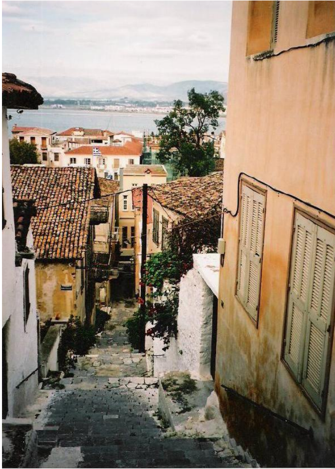
Náfplion vanhaakaupunkia.

Kanellópolisin mukaan jo 1960-luvulta alkanut massaturismi ja sen lieveilmiöt – väkimäärän vuotuisen suuri vaihtelu ja perinnemaisemaa pilaavat hotellikompleksit – olivat vähällä tuhota Náfplion jo ennen kuin PLS edes perustettiin. Samalla kuitenkin turismi toi myös tuloja alueelle, joten olisi vaikea perustella siitä luopumista. Vastaus tähän on Kanellópolisin mukaan ei enemmän, vaan parempaa turismia. On tärkeää, että paikkuntalaiset itse ottavat ohjat omiin käsiinsä ja taistelevat kulttuurinsa massoitumista ja epäautenttista, turisteille tarjottua "kulttuuria" vastaan. Kun alue kohenee, siitä kiinnostuvat erilaiset turistit. PLS:n tehtävä Kanellópolisin mukaan on