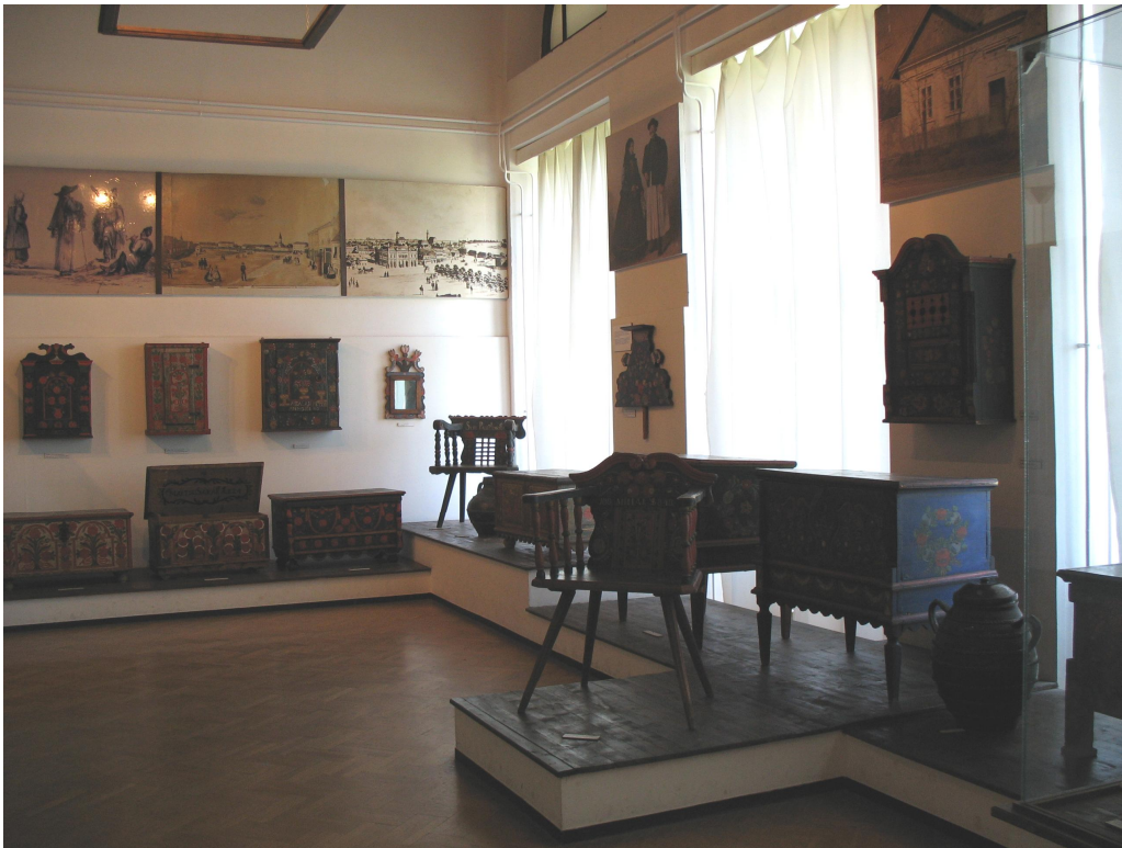
Móra Ferenc -museon kansatieteellistä näyttelyä.

Vuoden 1987 lopussa kansatieteellinen kokoelma käsitti 14 150 esinettä. Museon erikokoelmia ovat 1800-luvun maalatut talonpoikaishuonekalut, saviastiat Szegedistä, Makósta ja Hódmezővásárhelyistä, käsityöläisten kokonaiset työpajaesineistöt, etelätasangon vaunu- ja valjaskokoelmat ja täydelliset naisten pukukokonaisuudet Tápésta, Apátfalvasta ja Szegedistä. Kansatieteellisessä arkistossa oli tuolloin puolestaan 1031 nimikettä. Aineisto käsittää dokumentointikertomuksia, käsikirjoituksia, rakennuspiirustuksia, nuotteja, fonografinäänitteitä, ääninauhoja ja -kasetteja ja vuodesta 1986 lähtien myös videokasetteja. Kuvaarkistossa kuvia oli noin 400 vuosilta 1908–14, Juhászin ottamia kansanarkkitehtuuria dokumentoivia kuvia oli noin kolme tuhatta ja tekstiilikonservaattori Márta Knotikin keräämiä pukeutumiseen liittyviä reprokuvia noin 2 900 kappaletta. (Juhász 1989, 297.)