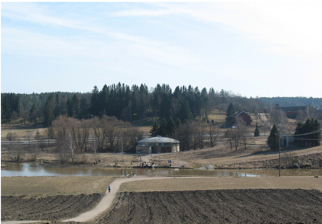
Kylämäki Aurajoen toiselta puolelta nähtynä. Rannan ja Kylämäen välissä kulkee Hämeen valtatie. Vähän matkaa kuvan oikean reunan ulkopuolella sijaitsee Ristimäen vanha kansakoulu, joka on Aurajoen törmällä. Sekä Kylämäki että Ristimäki ovat rautakautisia asuinpaikkoja.