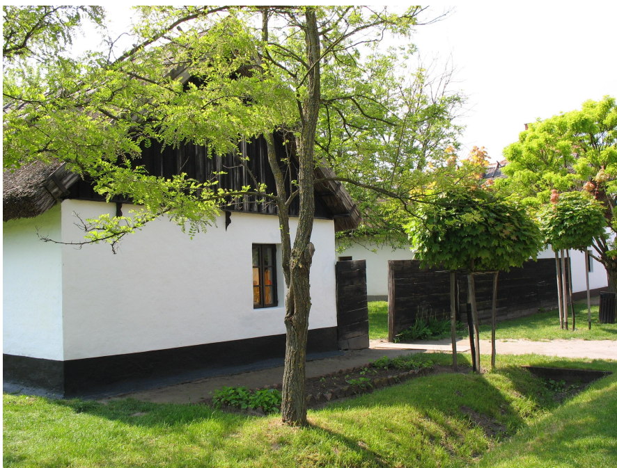
Kalastajan talo kadulta päin nähtynä.