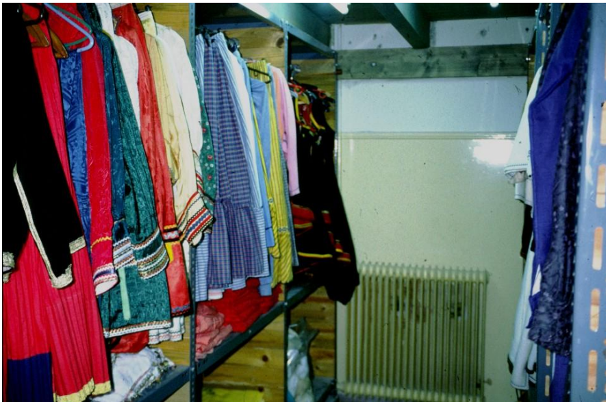
Tanssiryhmän esiintymisasujen varasto. Tavoitteena on, ettei tanssiharrastuksissa käytetä aitoja vanhoja asuja vaan niiden kopioita.

Miltei heti perustamisensa jälkeen museo oli ottanut lapset huomioon heille suunnatuilla ohjelmilla. Ensin lasten toiminta keskittyi vain kansantansseihin, joiden yhteydessä tutustuttiin kansanpukuihin ja kansanmusiikkiin. Siitä toiminta laajeni vuotuisjuhliin liittyviin kansantapoihin. Lapset esimerkiksi lauloivat perinteisiä lauluja ja leipoivat jouluna, harrastivat