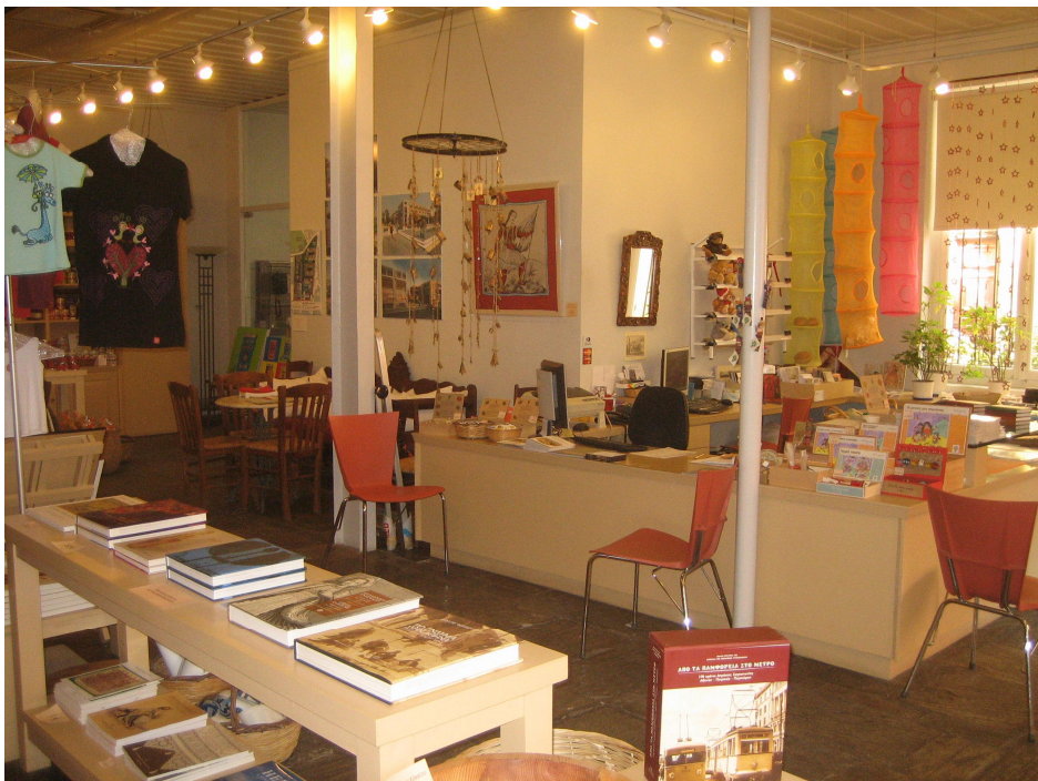
Museon kauppa vuonna 2008.

Museon on ollut pakko alkaa toimia samoin kuin alkuaikoinaan, ilman oletusta valtion tuesta. Ioánna Papantóniu mainitsi, että uudistettu museokauppa tuotti jo neljänneksen museon tuloista. Sen oli tarkoitus näyttää mahdollisimman vähän perinteiseltä museokaupalta.