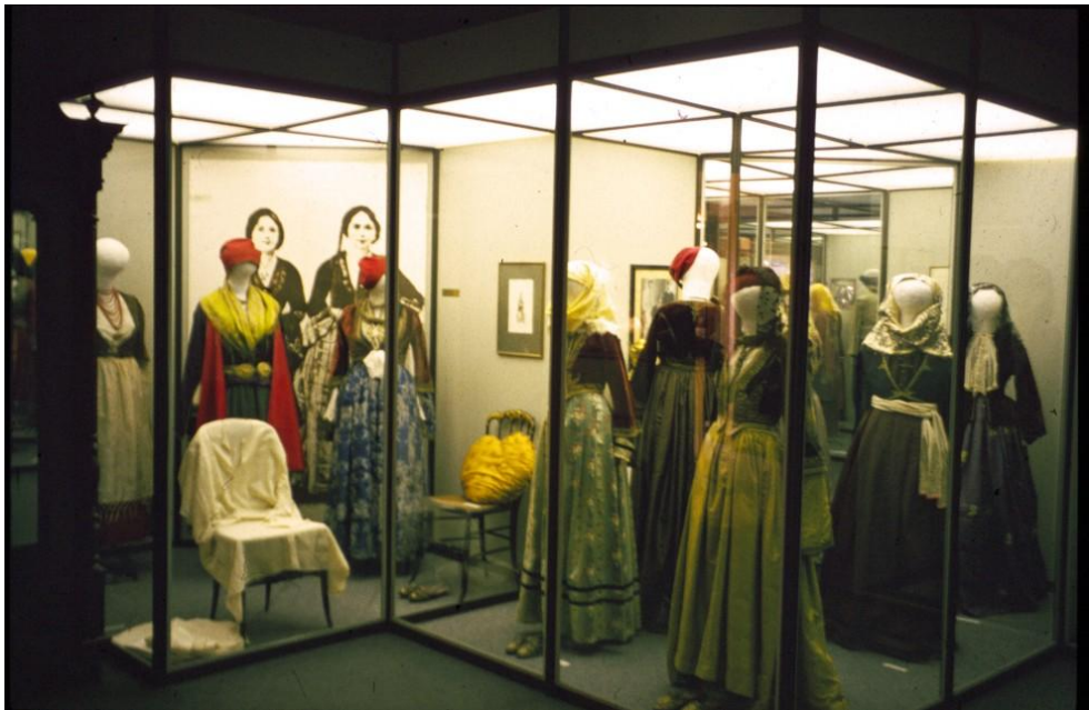
Kuva museon yläkerran pukunäyttelystä. Kuva: Hanneleena Hieta 1997.

pukuryhmä kreikan kansanpuvuissa perustui renessanssimekkoon, joka Euroopassa tunnetaan nimityksellä houppelade . Nämä vaikutteet saatiin lännestä, Venetsiasta. Tämä pukumuoto pysyi voimissaan 1800-luvun alkuun, ellei paikoin pidemmällekin. Tällainen pukuparsi oli tyypillinen Egeianmeren saarille ja rannikkoalueille. Sarakatsani-kansanryhmän mekoissa oli samoja vaikutteita. Lisäksi Peloponnesokselta tunnetaan bysanttilaisen ja venetsialaisen vaikutuksen yhdistäviä pukuja. Yläkerran näyttelyn viimeiset vitriinit edustivat kuningaspari Oton ja Amalian kansallisia hovipukuja, joiden urbaanit muunnokset omaksuttiin myös Kreikan maaseudulle. ( Catalogue, Folk Art Museum – Nafplion 1988.)