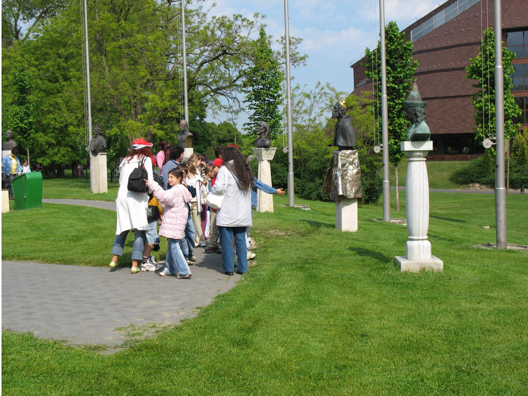
Lapsia unkarilaisten suurmiesten patsaisiin tutustumassa. Unkarin eri läänit ovat kustantaneet patsaat. Taustalla näyttelyhalli.