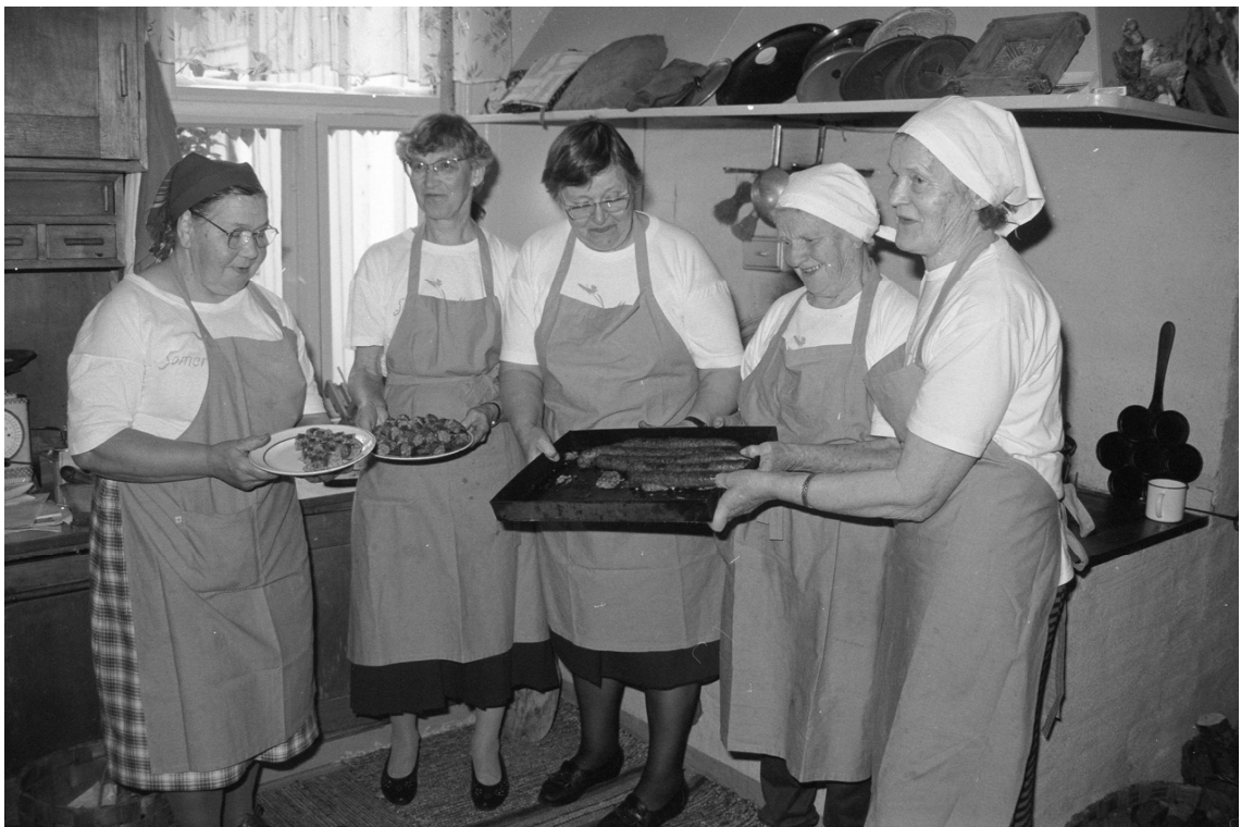
Keskiviikon tapahtumapäivä, makkaran valmistus, 8.9.1993. Martat esittelevät onnistuneita makkaroita Iso-Kohmon leivinuunin edessä. Makkara-ainekset oli saatu ensimmäistä kertaa sponsorointina paikalliselta osuusteurastamolta.

siin. Sorvoja ajattelikin, että olisi ollut tärkeätä, että vanhat martat olisivat voineet siirtää nuoremmalle marttasukupolvelle taitonsa, jota olisi edelleen voitu opettaa eteenpäin yleisölle Kuralassa. (TYKL/spa/148/s:1.) Näin ei siis käynyt. Sorvoja on kuitenkin korostanut, että vaikka martat eivät siirtäneet taitojaan seuraavalle marttasukupolvelle, he onnistuivat siirtämään valtavan määrän tietoa museon työntekijöille, joka sekin oli seuraavaa sukupolvea. Marttatoimintaan liittyi myös sellainen piirre, että Kuralan Kylämäki sai siihen pieni-muotoista yrityssponsorointia: jauhoja ja ryynejä sekä makkara-aineksia useampana vuotena. Lisäksi erityisen laihana vuonna 1991 marttojen saama apuraha Opintotoiminnan Keskusliitolta ja Varsinais-Suomen Marttapiiriiliiton tuki auttoivat laajentamaan aukioloaikaa huomattavasti (kesäkuun puolestavälistä toukokuulle) siitä, mitä se pelkästään maakuntamuseon budjetin avulla olisi ollut. (TYKL/spa/148/s:8; Sorvoja painossa .)