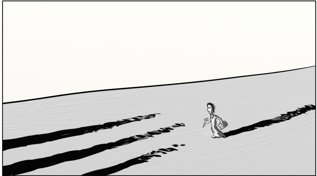
Kuva 4. "Unien tutkimuksen varjoissa." (c) Personal Art Helsinki / Lauri Heikkilä 2012.

"My point is not that dream work will save the world, but that dreams can be a reminder that it needs saving." (Montague Ullman)