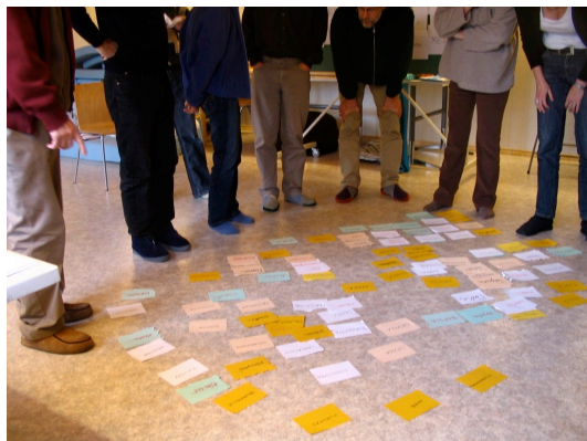
Kuva 2: Unesta esitykseksi -työpaja (2007).

puuttuu?” avulla. Näin työryhmä auttaa unennäkijää täydentämään omilla oivalluksillaan unikuvaansa.