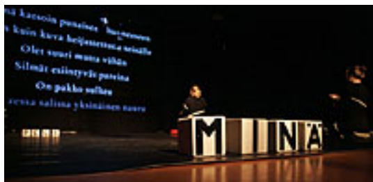
Kuva 1. Muistoja tulevaisuudesta -esitys (2006).

Kiinnostukseni uniin ja etenkin niiden ihmisiä yhdistävään luonteeseen kasvoi teatteri-ilmaisunohjaajan opintojeni aikana ja aloin tutkia aihetta esittävän taiteen keinoin. Valmistimme ryhmän kanssa esityksen Muistoja tulevaisuudesta. Esitys unesta ja unennäkemisestä (2006), joka rakentui ryhmän omille unille sekä ajatukseen unien kollektiivisesta luonteesta. Tätä itselleni kiinnostavaa ulottuvuutta olin päässyt lähestymään Suomen Uniryhmäfoorumin (SURF) kautta. Kyseinen foorumi edistää amerikkalaisen psykiatrin, Montague Ullmanin (1916-2008), kehittämän uniryhmämenetelmän leviämistä suuren yleisön tietoon Suomessa. SURF tarjoaa myös alustan kokeilla erilaisia unityöskentelymenetelmiä ja tutkia toiminnallisesti uneen liittyviä ulottuvuuksia.