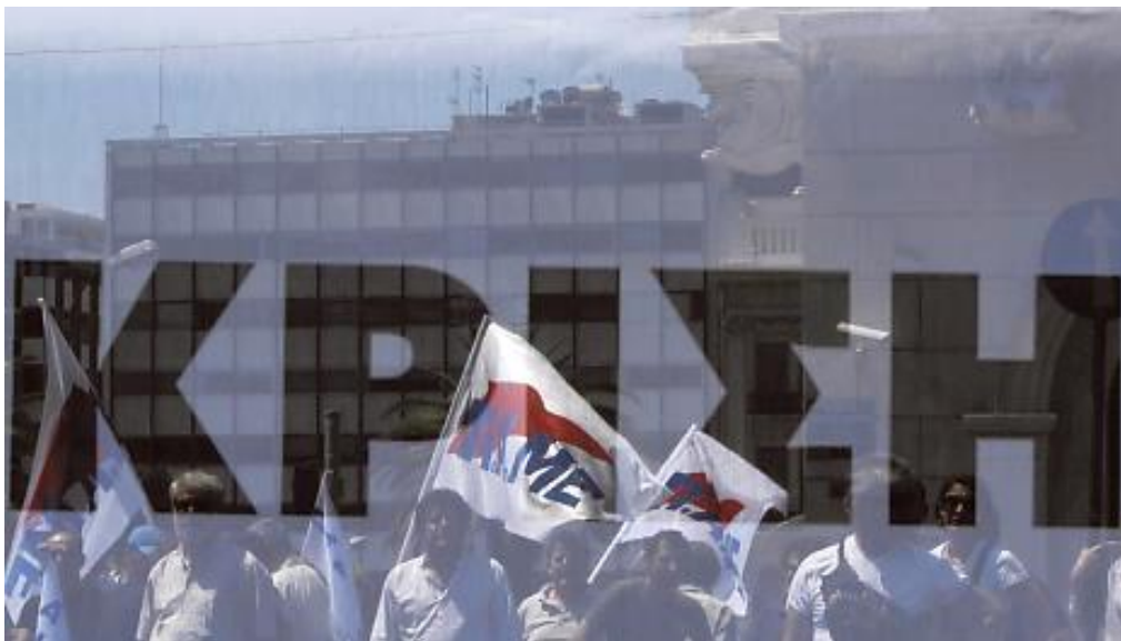
HS 4.5.2010: ”Velkakriisi horjuttaa rahaliittoa”

joiden hahmot heijastuvat suuren banderollin läpi. Kankaassa lukee korkein kirjaimin ”Kriisi”. Kuva on ainut kansalaisia tai ylipäänsä muita kuin poliitikkoja esittävä, ja se näyttää toimivan muistutuksena sekasorrosta kreikkalaisessa yhteiskunnassa, kun itse teksti keskittyy etäännytetysti ilmiön analyttiseen tarkasteluun ja asiantuntevaan kommentointiin.