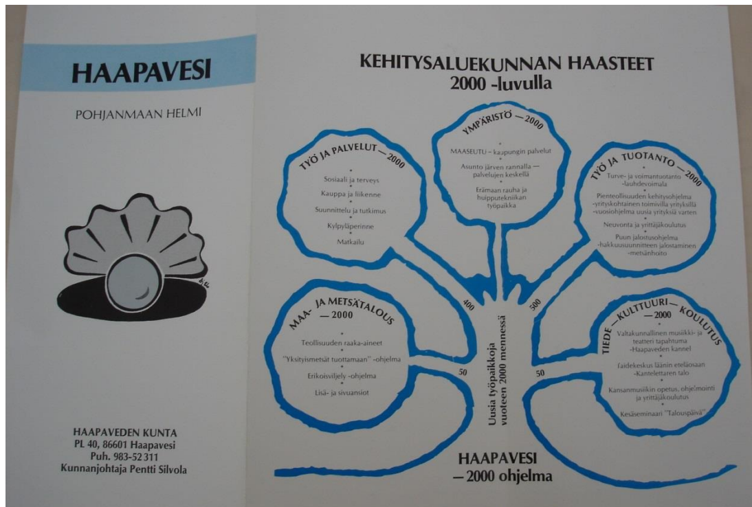
2 a. Haapavesi – Pohjanmaan Helmi. Esite. Haaprint ky. Haapavesi 1986. Esitteessä on kuvattu tyylitelty haapapuu, joka on myös Haapaveden omissa vaakunassa. Haapapuun "lehdissä" lueteltujen asioiden sisällöt on kerrottu tarkemmin esitteen takapuolella.