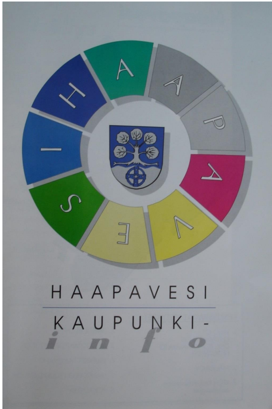
Kuva 4 a. Kaupunkivuonna 1996 painettu monisivuinen esite kertoo Haapaveden kaupungin sijainnista, palveluista, suurimmista yrityksistä ja koulutuksesta sekä kansainvälisistä yhteyksistä kuuteen maahan: Ruotsiin, Puolaan, Sveitsiin, Liettuaan, Viroon ja Venäjälle. Ystävyyskunnat Belomorsk, Ridala ja Älvsby mainitaan erikseen. Tässä esitteessä ei ole mainoslausetta eikä sivunumeroita. OMA-IDEA. Haapavesi 1996. Kirjapaino Osakeyhtiö Kaleva.