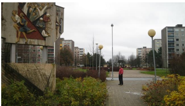
Kuva 1: Näkymä Sampolan palvelukeskuksen edustalta vuonna 2010.

rakenteissa kun kaupunki alkoi eriytyä ensin erilaisiksi omaa nimeään kantaviksi