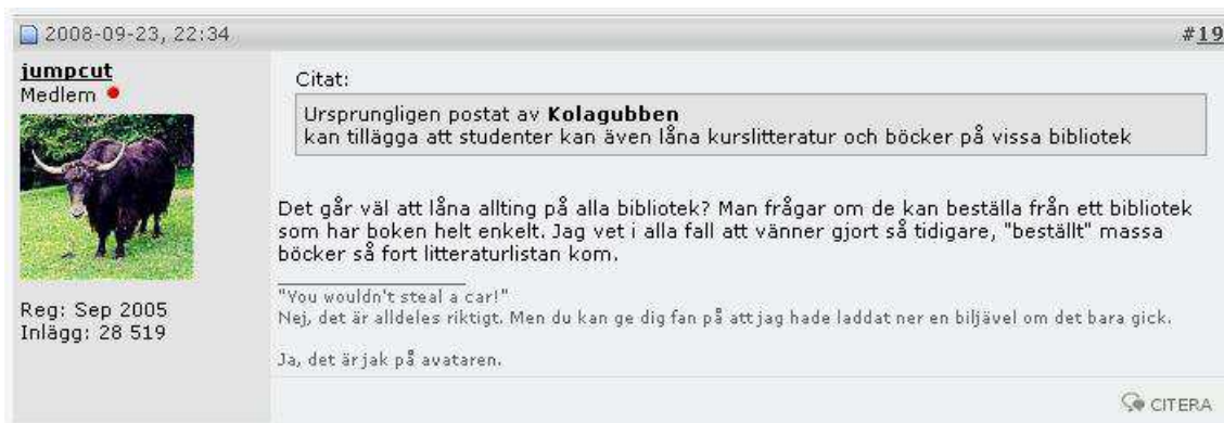
Figur 2. Ett inlägg på Flashback.org ( https://www.flashback.org/t751896p2 hämtat 18.10.2012).