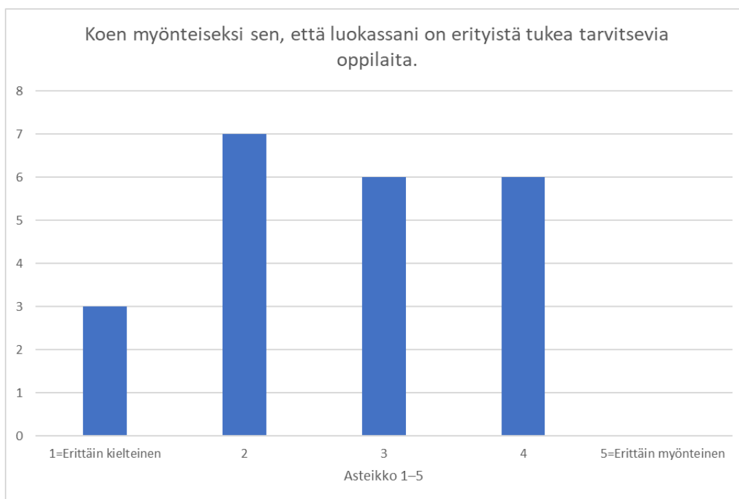
Kuvio 3: Koen myönteiseksi, että luokassani on erityistä tukea tarvitsevia oppilaita

Vastaajien asenteet olivat suurimmaksi osaksi yhteydessä muihin tekijöihin kuten liian vähäisiin resursseihin tai heikkoon erityispedagogiikan osaamiseen. Vastaajista kukaan ei vastannut kokevansa täysin myönteiseksi sitä, että luokassa on erityistä tukea tarvitsevia oppilaita (kuvio 3). Avoimissa kysymyksissä kukaan vastaaja ei kertonut, että asenteet tai opettamisesta heräävät tunteet olisivat vain oppilaan vuoksi negatiivisia, vaan kaikkiin vastauksiin liittyi jokin suhtautumiseen vaikuttava tekijä kuten työkuorman lisääntyminen tai oman jaksamisen heikkeneminen.