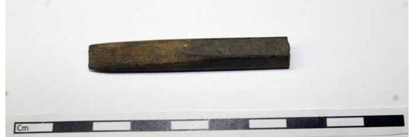
Liuskeesta tehty Pyheensillan nuolenkärjen kantaosa Espoon Korkoon-tieltä.

kokoinen kivirakennelma, jonka sisällä oli nokimaaläikkä. Löytöinä talteen otettiin saviastian paloja, porfyriittikaavin, kvartsi- ja kivilaji-iskoksia sekä 21,7 g punamullan värjäämiä ihmisen luita.