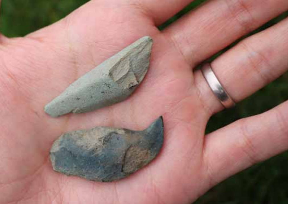
Ylin kuva: Liuskeesta tehty Pyheensillan nuolenkärki Hiittenharjulta.