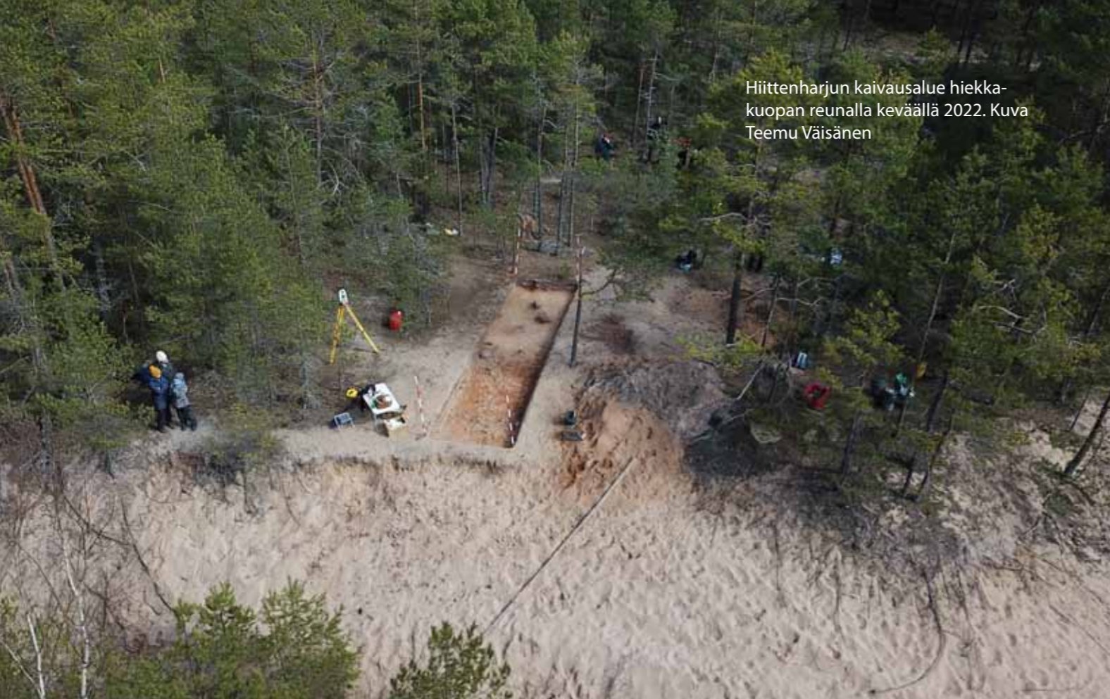
Hiittenharjun kaivausalue hiekkakuopan reunalla keväällä 2022.

ja soikeat painanteet. Lisäksi usein tavataan soikeita kampaleimoja, kynsipainanteita, kuopanteita, pisteitä, kaksiosaisia painanteita, rengaspainanteita ja kolmiopainanteita. Myös muita koristeluelementtejä on tavattu harvinaisempina. Tyypillisimmät koristekuosit ovat viistojen leimojen vaakanauhat joko yhdensuuntaisina tai allekkaisissa nauhoissa erisuuntaisina. Joskus koristelua on myös pystysuunnassa. Koristelu kattaa yleensä vain kolmanneksen astian pinta-alasta, joten suurin osa pinnasta on koristelematonta.