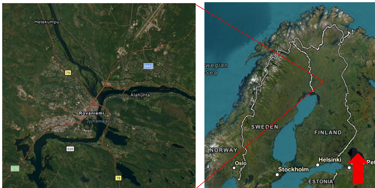
Kuva 1. Rovaniemi kartalla

(Peruskartta: Esri 2022 Hybrid Reference Layer)