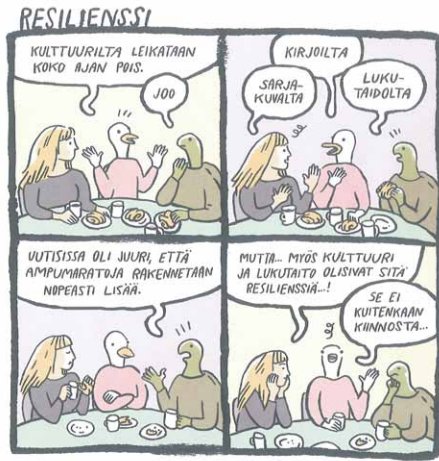
Kuva 2, s. 38