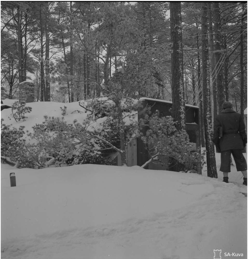
Kuva 1: Komentokorsu kuvattuna tammikuussa 1942.

silta, joten uusi komentokeskus päätettiin rakentaa nopealla vauhdilla maan alle (Kuva 1). Komentokeskuksen rakentaminen aloitettiin heinäkuussa 1941, ja se valmistui Kabanovin elämäkerran mukaan ripeästi viidessätoista päivässä (Kabanov 1971: 180). Valmistuttuaan se sisälsi Kabanovin mukaan muun muassa vesilähteen, suojan kemiallisia iskuja vastaan,