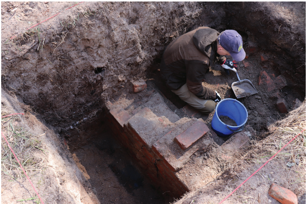
Kuva 3. Aleksi Rikkinen kaivaa paljastunutta tiilirakennetta esiin.

Maatutkaustuloksista ei voitu havaita viitteitä Kabanovin elämäkerrassaan kuvaa- masta vahvistetusta betonikatosta. Tutkausalueen pienen koon vuoksi rakenteen säilyvyydestä ei voitu myöskään todeta muuta, kuin että sen seinärakenteet näyttivät säilyneen ainakin osin alkuperäisillä paikoillaan, vaikkakin niiden väliin oli myös romahtanut muuta rakennusmateriaalia. Rakenteen todettiin tarjoavan