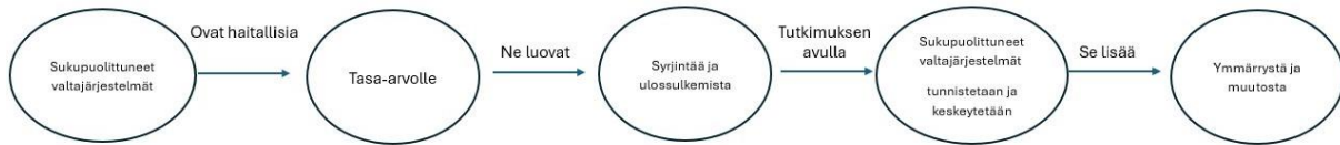
Taulukko 2. Feministinen konstruktivismi (Arinder 2024)

Feministinen konstruktivismi pyrkii tunnistamaan valtarakenteet, jotka ovat haitallisia sukupuolinäkökulmien huomioimiselle (Tickner ja Sjöberg 2013, s. 205). Feministinen konstruktivismi osoittaa, että feministisen näkemyksen sisällyttäminen tutkimukseen rikastuttaa vallan jakautumisen ymmärtämistä kansainvälisessä politiikassa (Locher ja Prügl 2001). Kun sukupuolinäkökulmille haitalliset valtarakenteet tuodaan esiin, voidaan valtaa analysoida kokonaisvaltaisemmin ja sitä kautta lisätä ymmärrystä sekä edistää muutosta. (Arinder 2024.) Tässä tutkielmassa feministisen konstruktivismin avulla on tarkoitus ymmärtää Naton identiteetin muutosta sukupuolinäkökulmien ja tasa-arvon edistäjänä aikana, jona kova turvallisuus on ottanut tilaa kansainvälisessä politiikassa inhimillisen turvallisuuden kustannuksella. Se miten Nato identifioituu sukupuolinäkökulmien ja WPS-agendan edistäjänä, vaikuttaa myös muihin kansainvälisiin toimijoihin.