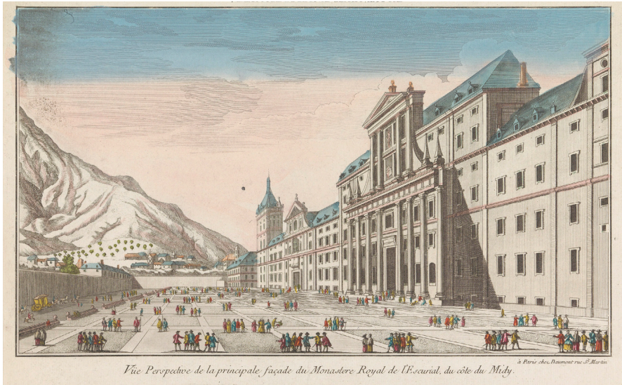
Utsikt över El Escorial i Madrid, cirka 1770. Gravyr av Jean-François Daumont. Rijksmuseum, Amsterdam.

Då Creutz år 1765 skrev sitt långa brev till Marmontel hade han inte bara umgåtts med den blivande fadern till Figaro utan också hunnit samla och fixera sina negativa uppfattningar om Spanien. I brevet till den franske filosofen presenteras Spanien i termer som är frånstötande för den upplyste läsaren. Där ligger människosläktet tusen år efter i utvecklingen, invånarna lever i mörker och i den skamligaste okunnighet, stolta över sin blindhet, tankens och handlingens frihet föraktas, och så vidare. Folket försmäktar, krossat av vidskeplighetens, det vill säga katolska kyrkans, enorma tyngd och av maktens godtycklighet, förklarar Creutz. 22 Spanien framstår härmed, sannolikt avsiktligt, som Paris och Frankrikes men också Sveriges motsats: Pyrenéerna är, enligt Creutz, den upplysta världens gränsverk, som filosofin aldrig kunnat ta sig över. Ju mer avskräckande Spanien ter sig, som desto mer upplyst bör Creutz andliga hemland framstå.