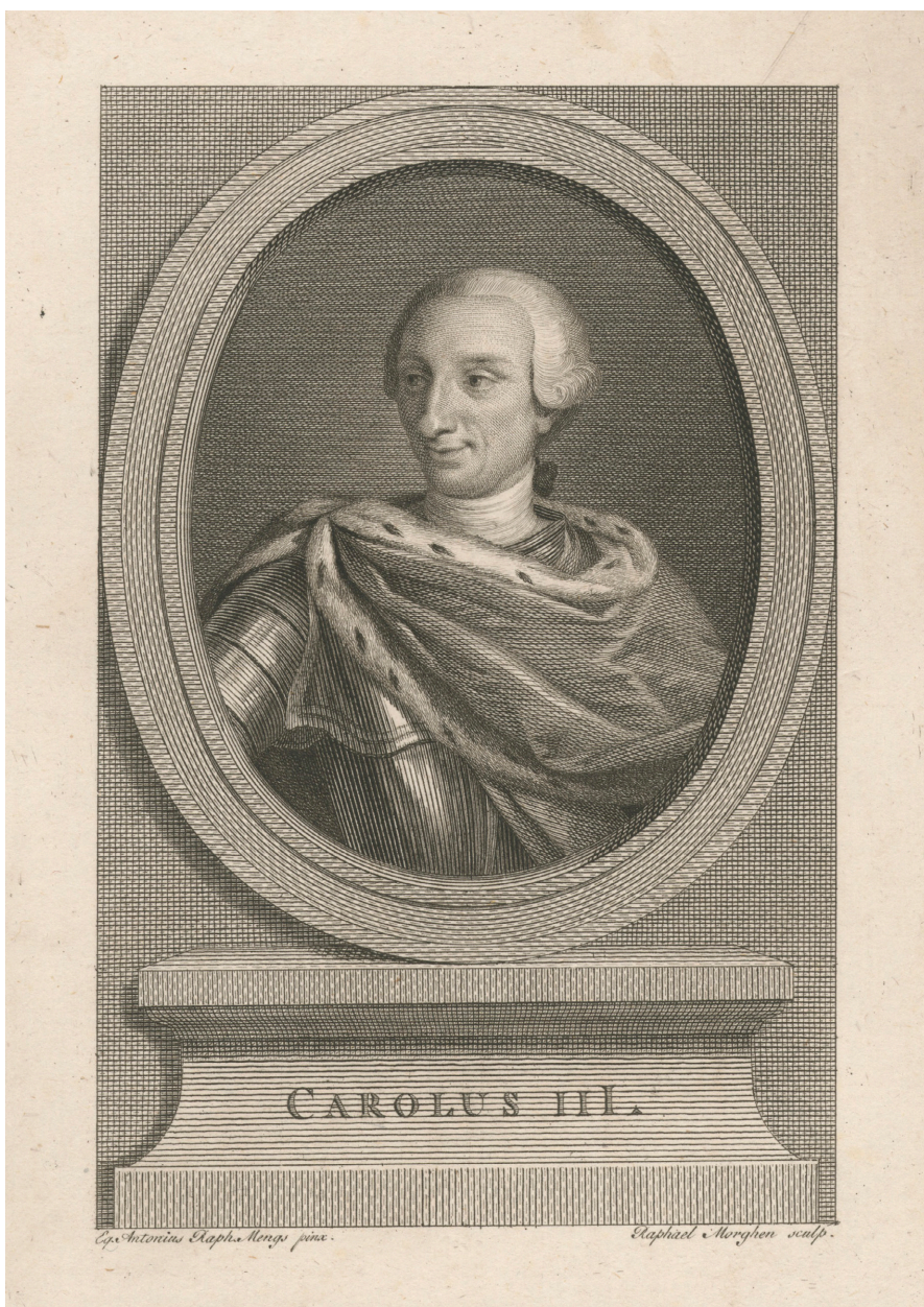
Karl III, som också var kung över Neapel, regerade i Spanien under Creutz diplomatiska uppdrag där. Han genomförde administrativa reformer som fått honom att betraktas som en upplyst monark. Porträtt av Anton Raphael Mengs, graverat av Raffaello Morghen, 1790.