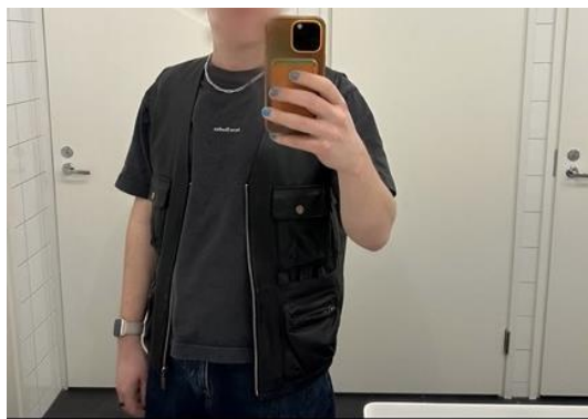
Julkaisu 3, Instagram

Olen luokitellut tavallisuuden teemaan sellaiset julkaisut, jotka käsittelevät “tavallista elämää”. Tähän teemaan kuuluvat siis esimerkiksi arkisemmat elämäntapajulkaisut ja niin sanotusti vilpittömämmiksi ja kevytmielisemmiksi katsojalle näyttäytyvät julkaisut. Tätä tavallisen elämän lausahdusta käyttää useampi analysoimani julkaisu, jolloin koen merkitykselliseksi muodostaa siitä oman teeman. Tavallisen elämän julkaisut ovat syntyneet vastapainoksi sosiaalisen median paineille pyrkiä täydellisyyteen ja teennäisyyteen.