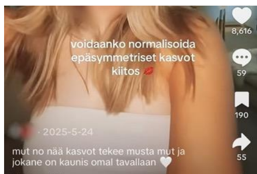
Julkaisu 1, TikTok

Itseilmaisun teemaan olen luokitellut sellaiset julkaisut, joissa henkilö esittelee itseään ja ajatuksiaan muun muassa tuomalla esille kokemiaan pelkoja, häpeäntunteita ja epävarmuutta. Itseilmaisu tarkoittaa ihmisen perustarvetta tulla kuulluksi, nähdyksi ja ymmärretyksi muiden silmissä. Sitä voi harjoittaa esimerkiksi verbaalisesti kertomalla itsestään tai nonverbaalisesti ehostamalla ulkoista olemustaan (Kauppila 2006). Itseilmaisussa merkittävässä roolissa ovat ihmisen minuus ja minäkuva, joiden avulla ihminen tulkitsee ja ilmaisee itseään muita ihmisiä kohtaan (Aho & Laine 2002, 16). Itseilmaisu ja peiliminä siis kulkevat käsi kädessä kyseisessä teemassa, ja se on huomattavissa seuraavista somejulkaisuista.