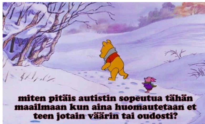
Julkaisu 5, Instagram

jäävänsä ulkopuolelle sosiaalisista verkostoista tai laajemmin yhteiskunnasta. Julkaisu ja sen saama kannatus johtavat myös peilien “puhdistamiseen” dialogisesti, jolloin yhä useampi erilaisissa elämäntilanteissa oleva voi kohtuullistaa omaa stigmautunutta ajatusmaailmaansa sekä lieventää kuviteltuja muiden negatiivisia arvioita.