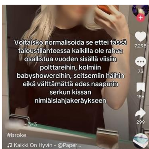
Julkaisu 5, TikTok

Sosiaalisen median julkaisuista korostui yhteiskunnallisen ja sosiaalipoliittisen keskustelun konteksti, ja ajoittain julkaisut kallistuivat kritiikkiin ja tyytymättömyyden ilmauksiin. Kritiikki yhteiskunnallisia ja sosiaalipoliittisia aiheita kohtaan ilmeni eri sävyisin julkaisuin, ja jotkut ottivat enemmän kantaa kuin toiset. Toisilla taas painotus oli enemmän huumorin puolella. Yhteiskunnallisen kontekstin teema näkyi muun muassa seuraavalla tavalla: