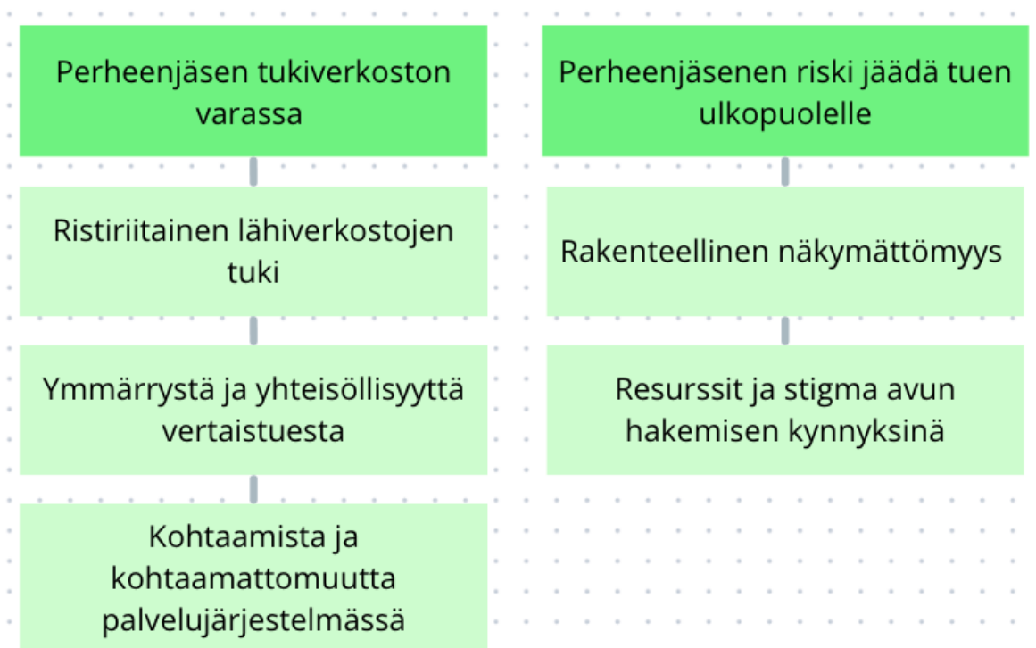
Kuvio 2. Perheenjäsenien tuki ja tuen ulkopuolelle jäämisen riski

Kuten kansainvälisestä ja kansallisesta tutkimuksesta tiedetään, perheenjäsenet ovat usein tärkeä tuki vankeuteen tuomitun hyvinvoinnille vankeuden aikana ja sen jälkeen (ks. esim. Codd 2007; Bülow 2014). Vähemmän tiedetään kuitenkin siitä, millaista tukea perheenjäsenet tarvitsevat ja missä määrin perheenjäsenien tuen tarpeet pystytään tukiverkoston toimesta täyttämään. Kuten aiemmasta analyysiluvusta voidaan havaita, vaikuttaa vankeustuomio hyvin kokonaisvaltaisesti ja monesti myös pitkäkestoisesti perheenjäsenien erilaisten psyykkisen hyvinvoinnin haasteiden, sosiaalisten muutosten sekä taloudellisten vastuiden kantamisen seurauksena. Tärkeää onkin selvittää, missä määrin vankeuteen tuomittujen perheenjäsenien tuen tarpeet tunnustetaan ja pystytään täyttämään erilaisissa yhteiskunnan tukiverkostoissa vai jäävätkö ne kenties näkymättömiin tai erilaisten esteiden taakse. Tutkielmani toisena tutkimuskysymyksenä tarkastelen, millaisia kokemuksia vankeuteen tuomittujen perheenjäsenillä on saadusta tai saamatta jääneestä tuesta. Kuviossa 2 olen esittänyt muodostamani pääteemat sekä alateemat, joita tulen käsittelemään.