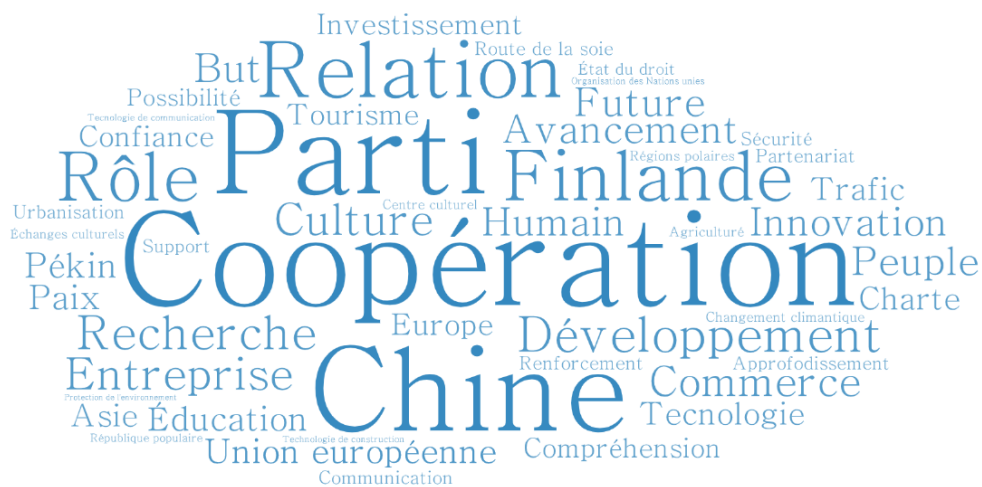
Figure 4. Nuage de mots de la fréquence lexicale des noms dans les déclarations conjointes entre la Finlande et la Chine

noms apparus dans la déclaration conjointe en observant la composition du nuage de mots (figure 4).