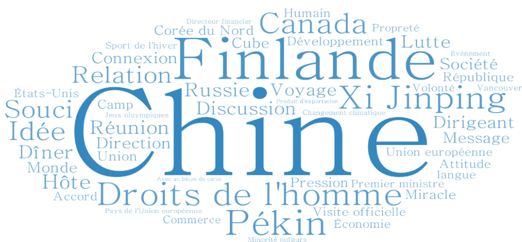
Figure 6. Nuage de mots de la fréquence lexicale des noms dans les articles de presse d'Yle et de Helsingin Sanomat concernant les visites officielles de Niinistö en Chine

Après avoir examiné les mots-clés des articles de presse en finnois des journaux Yle et Helsingin Sanomat , il est primordial d'étudier plus largement les sujets abordés que montrent les noms apparus dans les articles de presse en regardant la composition du nuage de mots suivant (figure 6).