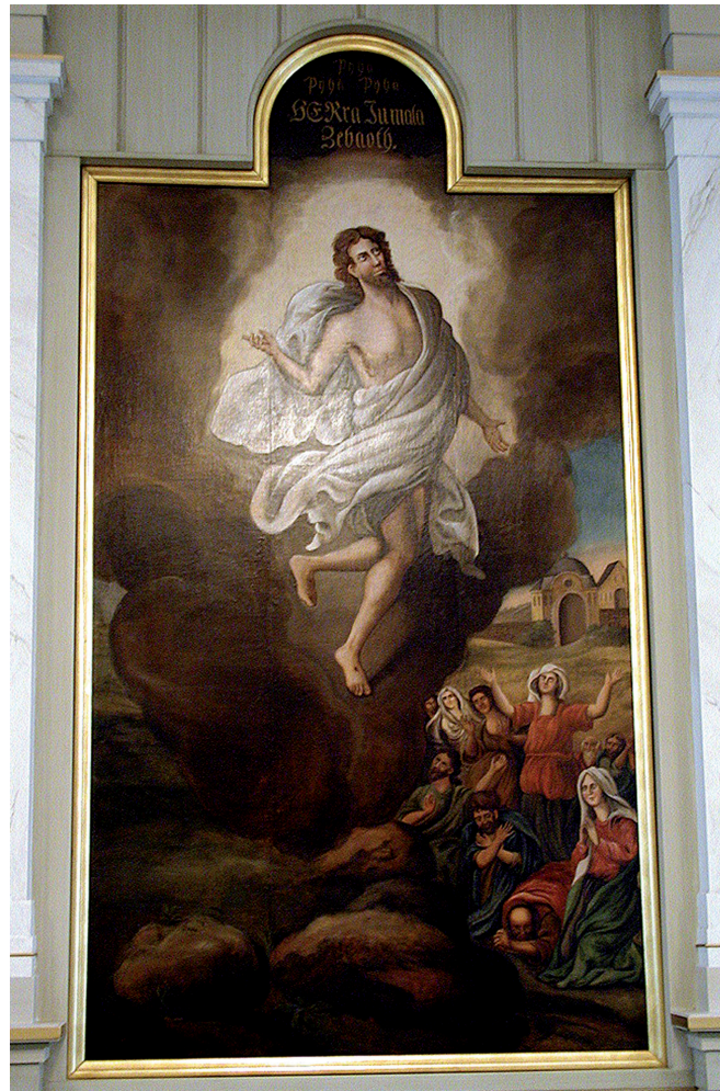
Kuva. C.P. Elfström (1832), Kristuksen taivaaseen astuminen, Nurmijärven kirkko. © Nurmijärven seurakunta.