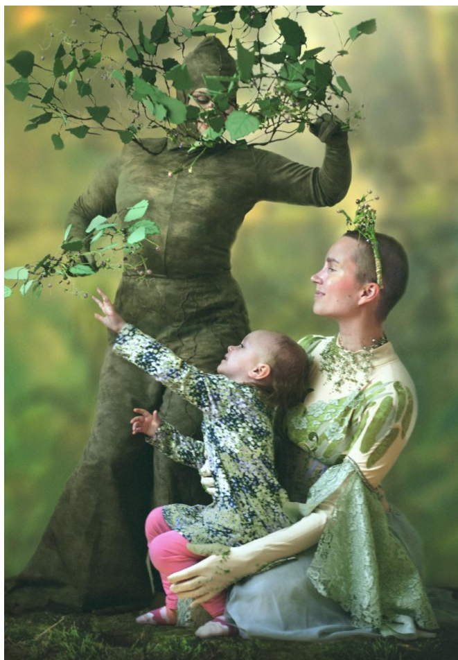
Kuva 1. Puun tarina on tanssiva kertomus eräästä huonosti voivasta puusta, jota yhdessä aktiivisesti toimivan lapsiyleisön kanssa hoivataan, kastellaan, halataan ja tanssitetaan. Teoksen aikana puu parantuu, kokee kehollisen muutoksen, ja alkaa lopulta kukoistaa. (ote Puun tarinan apurahahakemuksesta, Kaartinen 2023)