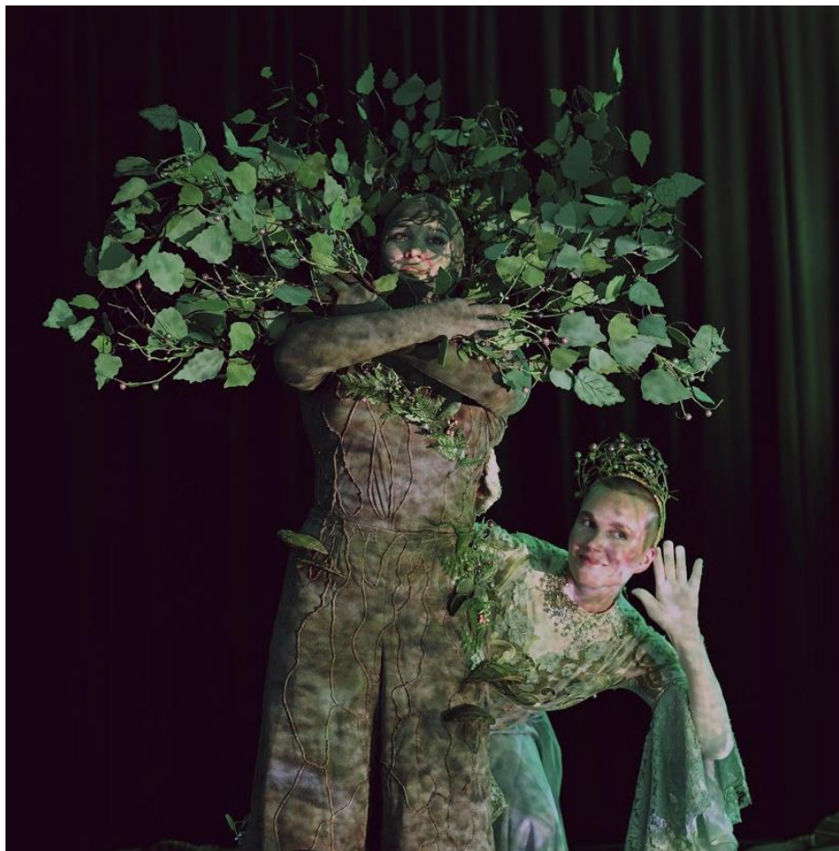
Kuva 4. Puu kukoistaa ja haltija kuuntelee satumetsän ääniä.

Haltija pyytää vieraitaan nousemaan ylös ja juoksemaan paikallaan, jotta elämän energia metsässä alkaa kasvaa ja virrata. Tämän jälkeen haltija ohjaa osallistuja hypähtelemään sekä kurottamaan käsillään vuoroin kohti aurinkoa, vuoroin kohti maankamaraa, ja pyörittelemään nilkkoja, jotta metsän polut eivät niitä hetkauttaisi.