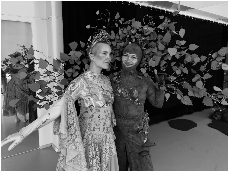
Kuva 5. Haltija ja Puu tyytyväisinä teoksen ensiesitysten jälkeen 5.8.2023.

Metsässä soivassa kappaleessa pomppivaa ja eteenpäinvirtaavaa rytmistä pääteemaa soittaa jälleen jokin xylofoni tai marimba -tyyppiseltä lyömäsoittimelta kuulostava soitin. Rytmää pumpppaavat erinäiset lyömäsoittimet sekä tuuban matalaa ääntä muistuttava puhallinsoitin. Melodiaa alkaa soittaa pirteän kupliva ja iloinen huilu. Yhtäkkiä musiikissa alkaa soida sello, joka soittaa nopeaa rytmistä kuviota toiveikkaalla sävelellä. Muu rytmikkaa hiljenee. Sellon kanssa yhtäkaaa alkaa soida myös kohdassa 3.3.3. kuvailemani nopea ja kilkattava tuulikello, sekä rinnakkain toisen sellon kanssa jo vanha tuttu, laulava ja maalaava sellosävel. Se soittaa tyytyväisen kuuloista, onnellista sävelmää. Nämä rytmisen ja sellovoittainen osio vuorottelevat kappaleessa, kunnes se loppuu tamburiinin väristykseen.