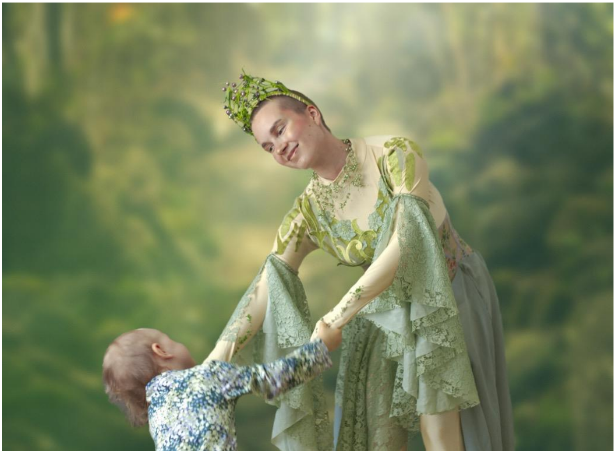
Kuva 2. Lapsi ja haltija tanssivat Puun tarinan mainoskuvassa kesällä 2023.

Näitä ekososiaalisen taidekasvatuksen ajatuksia on sovellettu voimakkaasti Puun tarina -teoksessa. Koko teoksen luomisen lähtökohtaisena motivaationa olikin alusta saakka pyrkiä luomaan esityksellisyyttä ja osallisuutta yhdistävä teos, joka pohjautuu voimakkaasti ekososiaalisen kasvatuksen aiemmin mainittuun kolmeen ulottuvuuteen (h 2024).