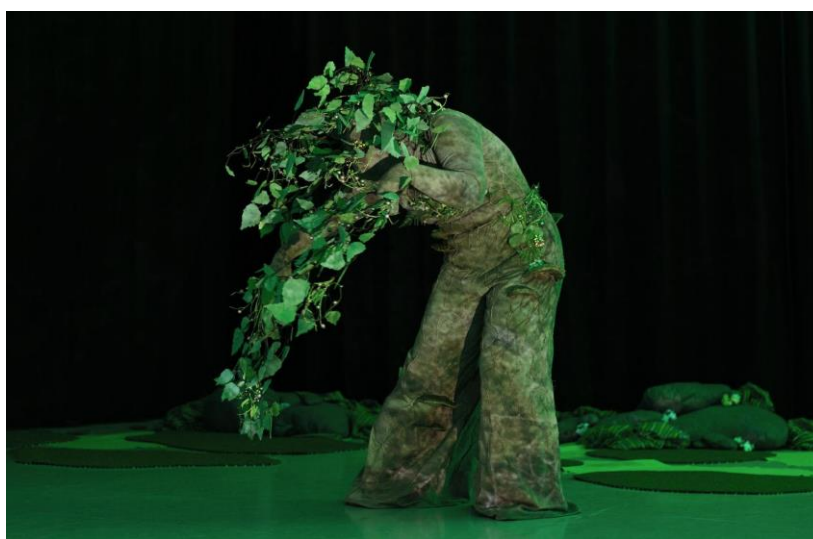
Kuva 3. Puu kumartuneena alkukohtauksessa, Puun Tarinan kenraaliharjoituksessa.