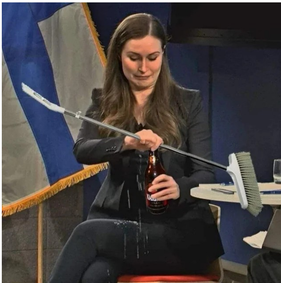
Kuva 6: Kansalaiset, medbörjare. Täten julistan pikkulauantain alkaneeksi.

Huomionarvoista meemissä on, että kyseinen juhlamiseen viittaava meemi ei itse asiassa liity Marinin kenties tunnetuimpaan juhlintakohuun, joka oli ylempänä olevan meemin aiheena. Tällä kertaa analyysin kohteena oleva meemi on julkaistu 8.12.2021. Upvoteja meemillä on noin 2600. 67 Meemissä Marin avaa Karjala-oluen harjalla. Meemin kuva on otettu alun perin videolta, jossa Marin vieraillee puhumassa Columbian yliopiston World Leaders -tapahtumassa. Videolla Marin avaa kivennäisvesipullon, joka kuohahtaa hänen sylilleen. 68 Meemissä kivennäisvesi on vaihtunut olueen, ja Marin avaa pullon harjalla. Oluen avaaminen nimenomaan harjalla on viittaus TV-sarjan Salatut Elämät -jaksoon, jossa hahmo Kari Taalasmaa avaa oluen samantyyppisellä harjalla. Yksityiskohta saattaa vaikuttaa joutavalta, mutta toimii viittauksena laajemmin suomalaisen populaarikulttuurin kenttään. Harja on tekijä, joka tekee meemistä kokoelmameemin, meemin yhdistäessä sen laajempaan suomalaisen populaarikulttuurin kaanoniin. Siitä huolimatta, että Marinin kauden kohauttavien juhlintakohu oli vasta edessä, meemi viittaa tapaukseen, jossa Marin vietti iltaa ulkona koronalle