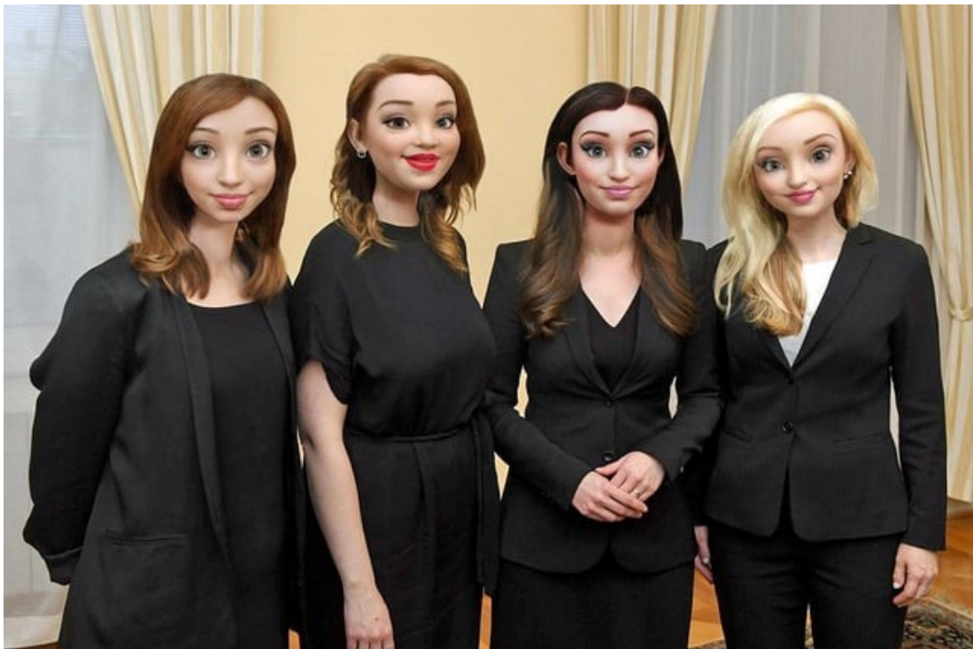
Kuva 16: Disney hallitus