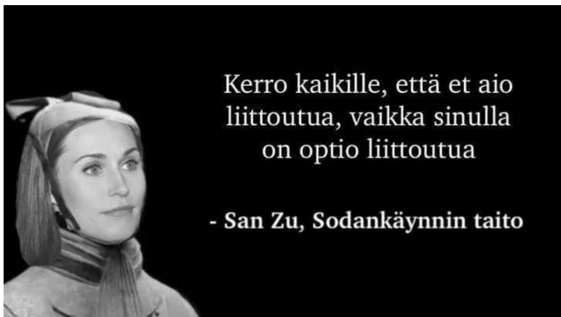
Kuva 7: Marsalkka Marin

”Marsalkka Marin” -meemin hahmo, jonka kasvojen tilalle on muokattu Marinin kasvot, ja sitaatti viittaavat tunnettuun sotastrategia-teokseen, Sun Tzun 70 Sodankäynnin taito . Meemin asettelu, värit, teksti ja hahmo ovat samankaltaisia kuin kirjasta nostetut, verkossa leviävät sitaattikuvat usein tapaavat olla. Meemi on julkaistu 21.1.2022, ja upvoteja sillä on noin 1900. 71 Alla oleva kuva on esimerkki vastaavasta sitaattikuvasta. 72 Meemi on kokoelmameemi, sen yhdistäessä Sun Tzun sitaattikuvan tyylin Mariniin ja hänen toimintaansa.