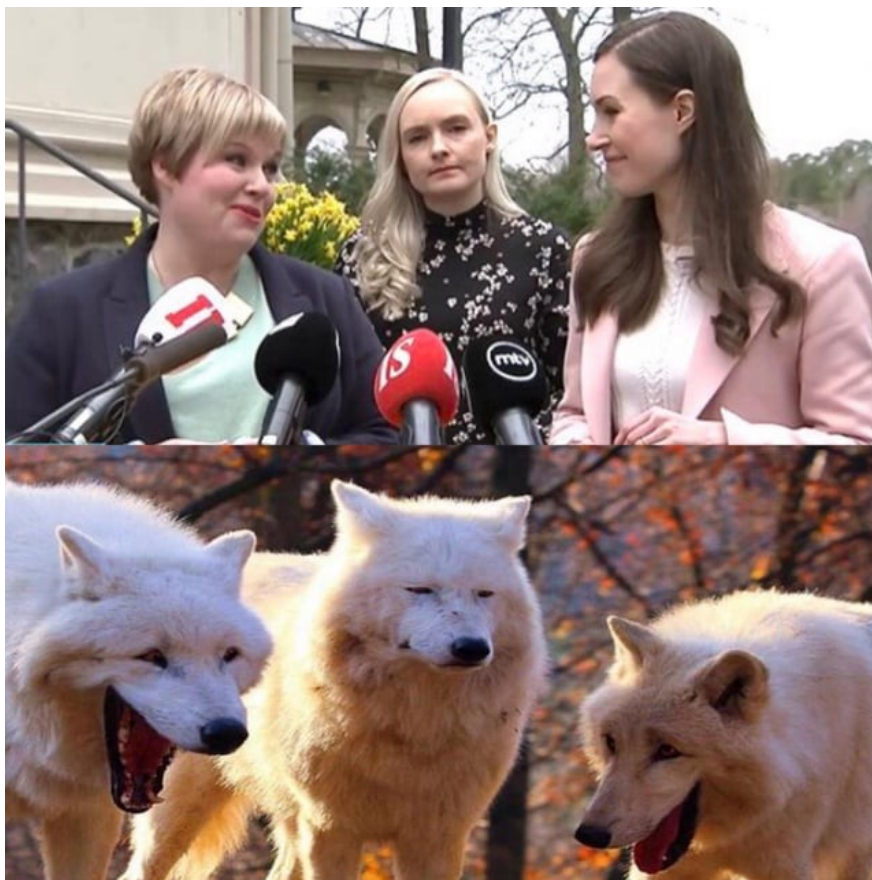
Kuva 24: Yllä oleva kuva on kovaa vauhtia muuttumassa meemiksi ainakin Twitter-kuplani mukaan

Meemi on julkaistu 28.4.2021, ja upvoteja sillä on noin 2300. 111 Meemissä yhdistyvät kuva hallituksen lehdistötilaisuudesta keväältä 2021 ja meemipohja, jossa on kolme sutta. Kuva on muokattu kuva susista, joista kaksi nauraa, kun taas keskimäinen näyttää tympääntyneeltä. 112 Alkuperäinen kuva poliitikoista on kuvankaappaus videolta, joka on otettu hallituksen tiedotustilaisuudesta koskien kehysriihtä. 113 Meemipohjaa susista käytetään usein luomaan vertauksia kolmen asian tai henkilön välillä. Kyseisessä meemissä Saarikon ja Marinin myönteiset ilmeet vertautuvat Ohisalonnäennäisen vakavaan katseeseen. Kuvien asettelu vastaa meemipohjaa täsmällisesti, vakavan suden tai meemin tapauksessa Ohisalonnä, ollessa kuvan keskellä. Meemin vitsi rakentuu poliitikkojen reaktioiden lisäksi tiedotustilaisuuden sisältöön. Kehysriihen keskeisimpiä haasteita oli vihreiden ja keskustan väliset näkemuserot turpeen tuotantoa koskien. Vihreät ajoivat nopeampaa turpeen tuotannon alasajoa ilmastoystistä, siinä missä keskusta painotti hitaampaa siirtymää pitkälti taloudellisista syistä. Vaikka