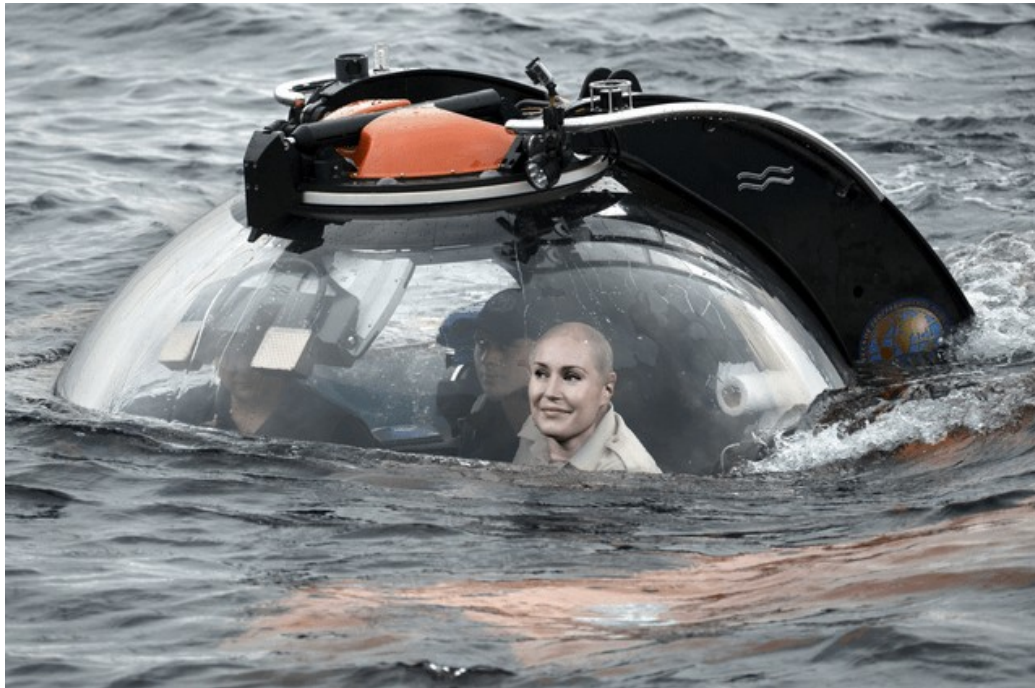
Kuva 3: Submarin

Kolmas Marin -meemi edustaa ”#aamupalagate”-meemin tapaan meemiryhmää, jossa vitsaillaan Marinin nimestä tehdyillä väännöksillä, tässä tapauksessa Marinin nimen sijoittamisella englannin kielen sukellusvenettä kuvaavaan sanaan, submarine . Meemi on julkaistu 13.3.2020, ja upvoteja sillä on noin 1300. 61