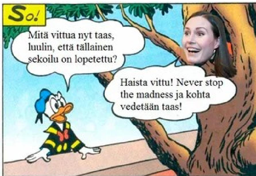
Kuva 22: Never stop the madness

Meemi on julkaistu 8.12.2021, ja upvoteja sillä on noin 1600. 108 Meemin taustalla on tunnettu meemipohja, joka tunnetaan samaisella nimellä: ”Never stop the madness” tai ”Never stop the madness ja kohta vedetään taas”. Kuva on muokattu alun perin Aku Anka -sarjakuvaruudun pohjalta, jossa esiintyvät Aku ja puussa oleileva Roope Anka. Kyseisen meemin tapauksessa Marinin kasvot on muokattu Roope Ankan tilalle. Meemi on tunnettu kotimaisessa meemikuvastossa, vaikkakin sen