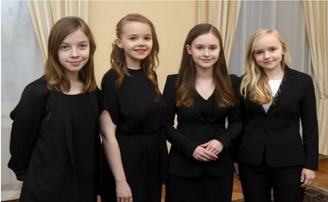
Kuva 15: Tytöt leikkii hallitusta