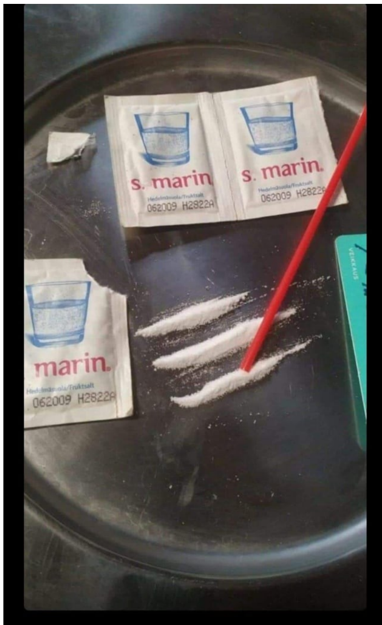
Kuva 5: Närästääkö?

”Närästääkö?”-meemi yhdistää Marinin hallituskauden meemeistä kaksi suosittua aihepiiriä. Ensinnäkin meemissä vitsaillaan Marinin nimestä tehdyllä väännöksellä, samaan tapaan kuin jo aiemmin käsittelyissä olleissa meemeissä. Kyseisen meemin tapauksessa vitsaillaan Marinin nimen samankaltaisuudella Samarin-merkkisen hedelmäsuolan kanssa, jota käytetään närästyksen hoitoon. Toiseksi, meemin aiheena on Marinin juhlintakohuna tunnettu tapaus, jossa julkisuuteen vuodettiin yksityisjuhlista otettuja videoita, joissa Marin oli mukana. Kohu herätti laajaa mediahuomiota, sekä kansallisella että kansainvälisellä tasolla, keskustelua median osallisuudesta ja toiminnasta vastaavissa