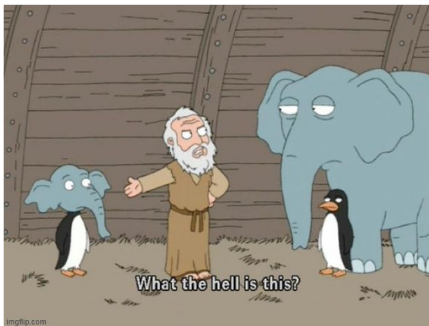
Kuva 26: What the hell is this?

”Ensitunnelmat hallituksen budjettiriihen tuloksista” -meemissä kummastelun kohteena oleva hybridi rakentuu jäteveron korotuksesta, työeläkkeiden nostamisesta, muutoksista matkustuksen tukiin, lapsilisien nostamisesta, opintolainahyvityksistä harvempaan asutuilta alueilta muuttavilta ja ruotsin opetuksesta. Jokainen hybridin osa edustaa budjettiriihen aikaisia keskusteluista erinäisistä puolueille tärkeistä asioista. Seikat on meemissä esitetty karrikoiden ja kärjistäen, mutta ne edustavat keskusteluissa esillä olleita asioita. Meemin tekijä esittää, että budjettiriihen tulos on jotenkin naurettava tai kyseenalainen, vähintäänkin poliittisesti toimimaton.