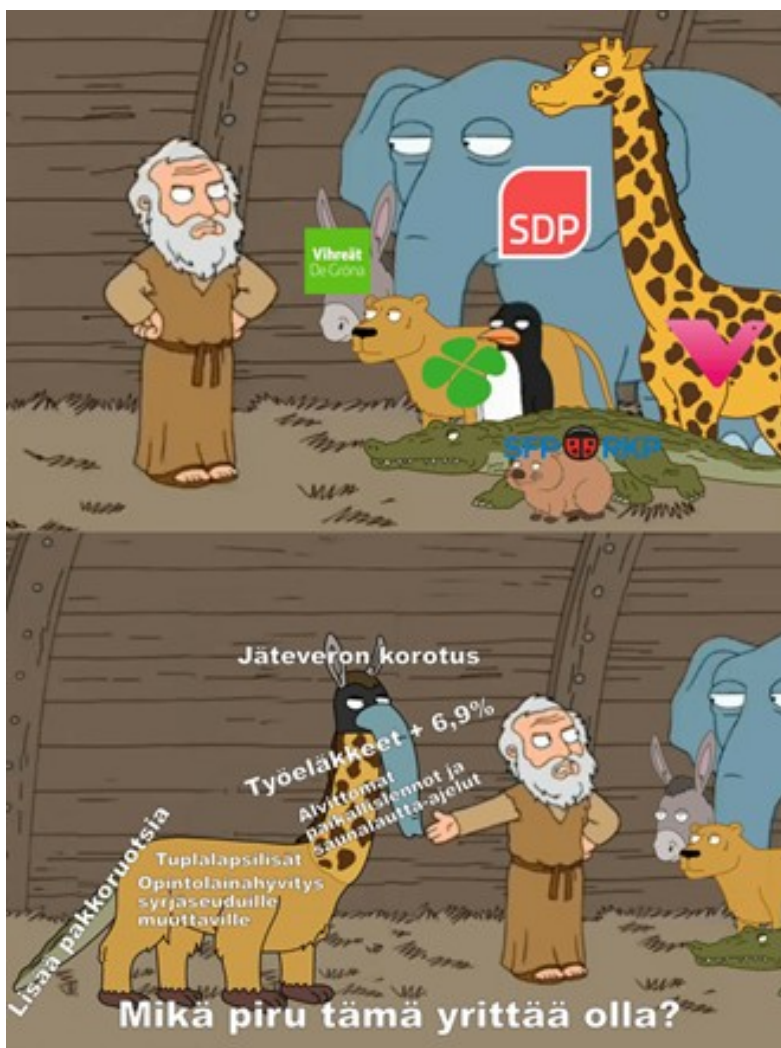
Kuva 25: Ensitunnelmat hallituksen budjettiriihen tuloksista

Meemi on julkaistu sivulle 1.9.2022, ja sillä on noin 1500 upvoteta . 116 Meemi rakentuu muokatuista kuvankaappauksista Family Guy -sarjasta, joka on animoitu, aikuisille suunnattu komediasarja. Kyseisessä jaksossa eläimet marssivat Nooan arkkiin. Arkissa Nooa osoittaa pingviiniin ja norsun risteymää ja kysyy: ”Mikä helvetti tämä on olevinaan.” 117 Otoksesta syntyi meemi, kun kuvankaappauksia käytettiin kuvaamaan kahden eri asian yhdistelmää, ja kyseisestä yhdistelmästä syntyvää vitsiä. Langalta löytyneessä meemissä on pingviiniin ja norsun yhdistelmän sijaan eläin, jossa on norsun ja pingviinin lisäksi kirahvi, krokotiili, majava, aasi ja leijona. Jokainen eläin on kuvattu meemissä Marinin pääministerikauden hallituspuolueena. Hybridieläin edustaa jokaisen puolueen tavoitteita hallitusohjelman suhteen, jonka meemin tekijä näkee vähintäänkin kyseenalaisena kokonaisuutena.