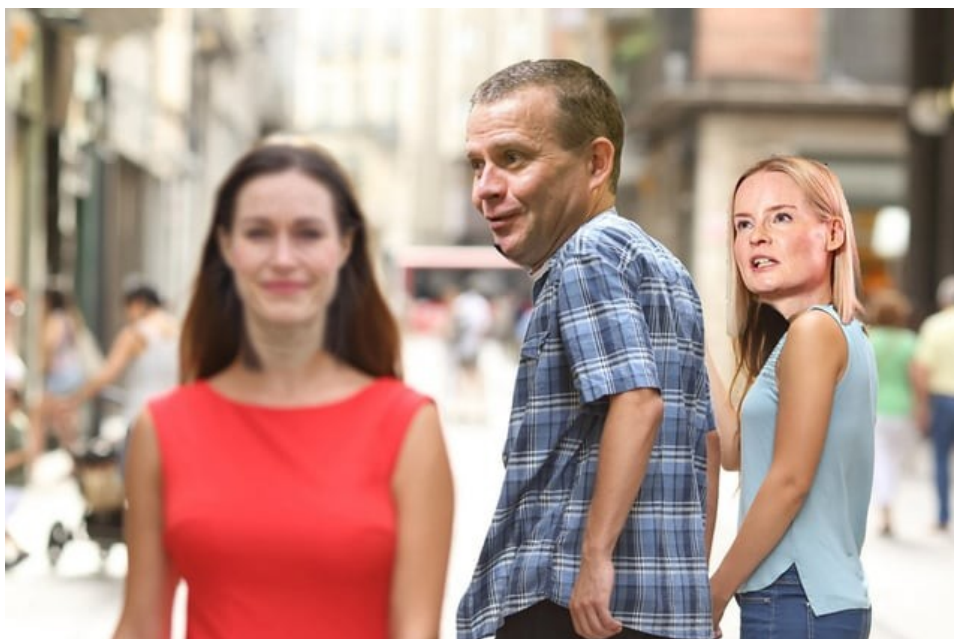
Kuva 10: Hallitusneuvottelut 2023

Meemi on julkaistu 3.4.2023, ja sillä on noin 1800 upvotea . 79 Meemi hyödyntää valmista meemipohjaa, jossa mies kävelee käsi kädessä naisen kanssa, ja kääntyy katsomaan heidät ohittavaa naista. Alkuperäinen meemipohja tunnetaan nimellä Distracted Boyfriend tai Man Looking at Other Woman . 80 Meemipohjaa on muokattu lisäämällä Marinin kasvot pariskunnan ohittavan naisen kasvoille, Petteri Orpon kasvot miehelle ja Riikka Purran kasvot pariskunnan naiselle. Marinin kasvot on editoitu taidokkaasti, siinä missä Purran ja Orpon kasvot ovat koomisen suuret ja päälle liimatun näköiset. Erityisesti Orpon ilme on humoristinen, siinä missä Purran katse on tiukka, ikään kuin hän meemipohjan naisen tapaan paheksuisi Orpon katseita Marinin suuntaan. Sattumalta naisten paidat täsmäävät edustamiensa puolueiden värien kanssa. Vaikka meemi sijoittuukin pääasiassa Marinin hallituskautta seuraavaan aikaan, pidän sitä mielenkiintoisena Marinin poliittisen perinnön kannalta. Meemi vitsailee ajatuksella, jonka mukaan Orpo haikailisi Marinin ja SDP:n perään, vaikka hallitusyhteistyö oli epätodennäköistä.