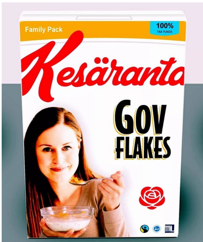
Kuva 4: Kesäranta - GOV FLAKES

Toinen aamupalakohusta tehty meemi, ”Kesäranta - GOV FLAKES”, on pitkälti saman tyylinen kuin aiemmin käsittelyssä ollut ”#aamupalagate”-meemi. Meemi on julkaistu 31.5.2021, ja sillä on 855 upvota . 63 Meemissä Marinin kuva on muokattu Kelloggs-maissihiutalepaketin kanteen. Paketin nimi on Kelloggsin sijaan Kesäranta ja maissihiutaleiden sijaan paketista löytyy gov[ernment] flakes :eja, eli hallitushiutaleita. Kuten Voi Marin -levitteessä, Kesäranta-paketin yläreunasta löytyy teksti 100% tax funds eli näennäisesti verorahoilla tuotettu elintarvike tämänkin meemin keskiössä. Paketin alareunasta löytyy muutama logo. SDP:n vanha logo, Reilu kauppa -tunnus, Hyvää Suomesta -merkki ja Eduskunnan logo koristavat hiutalepakettia. Paketissa käytetty Marinin kuva on ilmeisen muokattu. Joitakin lehdistökuvia löytyy, joissa on paljon samankaltaisuutta paketin kuvan kanssa, mutta hiutalekulhoa ei oletettavasti alkuperäisestä otoksesta löydy.