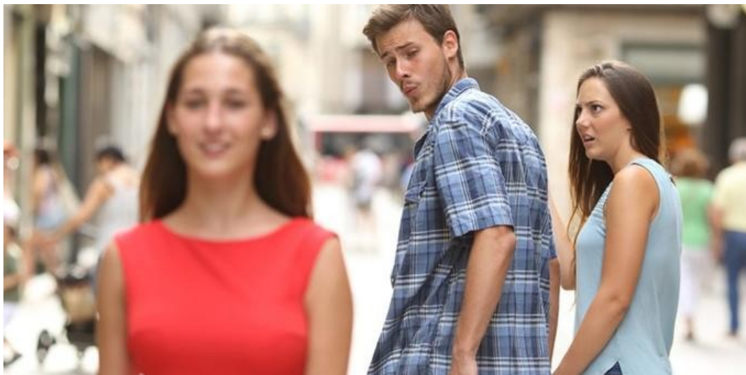
Kuva 11: Distracted Boyfriend

Meemin vitsi rakentuu Marinin hallitusta seuraavien vaalien aikaan, jolloin vaalivoittaja kokoomus alkoi rakentaa seuraavaa hallitusta. Meemin voi tulkita kommentoivan useampaa hallitusneuvotteluihin liittyvää, Suomen lähihistorian politiikan ilmiötä. Hallitusneuvottelujen aikaan vuonna 2023 esitettiin spekulatioita mahdollisesta SDP:n ja kokoomuksen muodostamasta sinipunahallituksesta. 81 Tätä vasten meemin viesti on tulkittavissa siten, että Orpo ikään kuin vertailee vaihtoehtojaan kahden todennäköisimmän hallituskumppanin välillä.