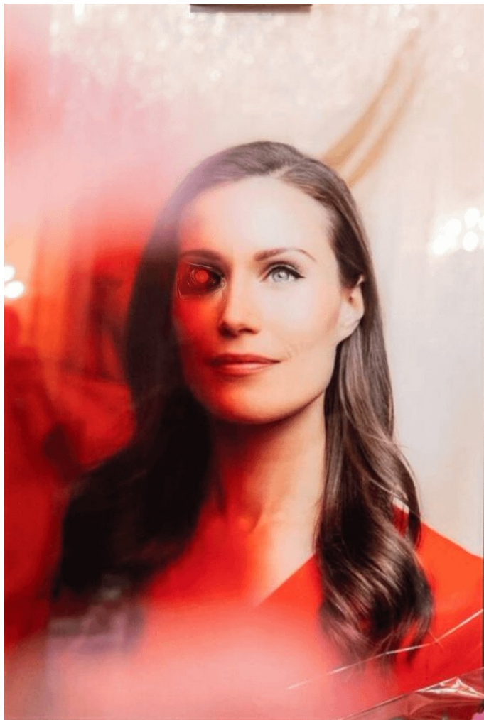
Kuva 18: T-2022