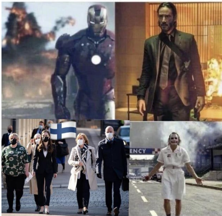
Kuva 12: Hidasta Dressman kävelyä

It's so badass when people stand in front of shit they destroyed