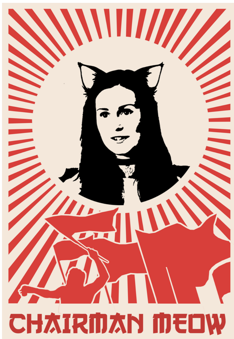
Kuva 19: Mjäy :3

Meemi on julkaistu 17.6.2022, ja upvoteja sillä on 438. 102 Kuva parodioi vanhaa vasemmistolaista poliittisten ja propagandististen julisteiden kuvastoa. Kuvassa Marinille on laitettu kissankorvat ja käpälän kuvalla somistettu kaulapanta. Marinin kuvasta lähtevät, ikään kuin valonsäteet, osuvat ensin lippua heiluttavaan siluettiin ja lopulta kuvan alareunassa lukevaan tekstiin Chairman Meow. Meemi on osa laajempaa Kissatyttö Marin -meemikuvastoa. Kissatyttö-meemeissä Marin kuvataan antropomorfisena hahmona, joihin liitetään usein ihailua, seksualisointia tai ivaa. Perustan kyseisen havainnon katsaukseen laajempaan kissatyttö-meemikuvastoon ja siihen, miten Marinia on kyseisissä meemeissä kuvattu. Meemin huumori rakentuu laajempaan keskustelualustojen kulttuuriin,