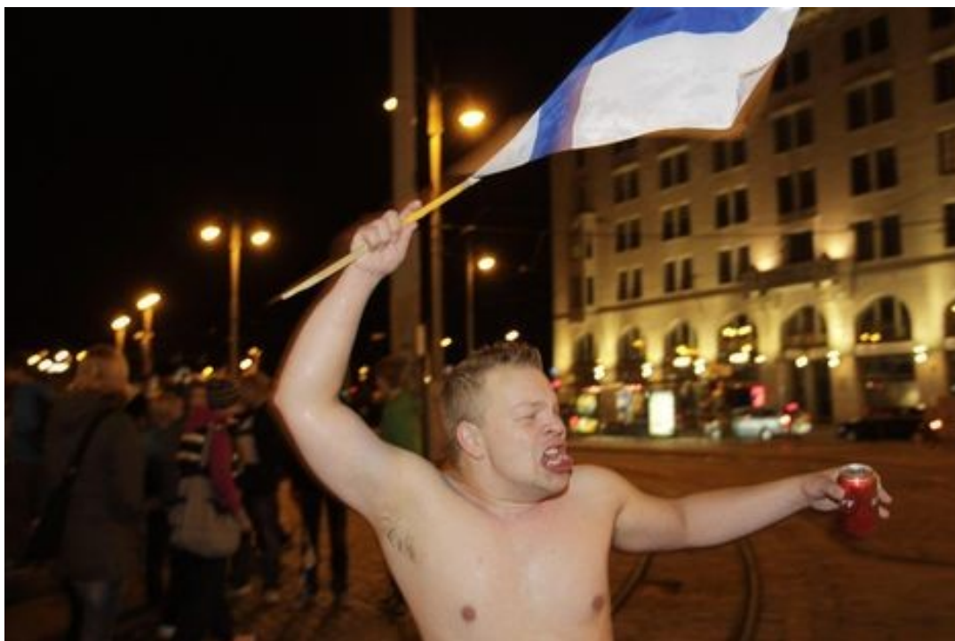
Kuva 20: Torille!

Lippua heiluttava hahmo on tunnetuimpia suomalaisen meemikaanonin hahmoja. Alkuperäinen kuva on otettu vuonna 2011, Suomen voitettua jääkiekon MM-kultaa. Kuva on otettu Helsingistä, Havis Amandan -suihkulähteen luota, voitonjuhlinnan hulinoista. 103 Meemiä käytetään usein kuvaamaan esimerkiksi Suomen tai suomalaisten onnistumisiin liittyviä kokemuksia ja tapahtumia. Kuvaan tiivistyy olennaisesti torilla tapaamisen ja siellä juhlinnan mentaliteetti. Analyysin kohteena olevan meemin kannalta kyseisen kuvan sisällyttäminen meemiin voi kertoa meemin tekijän tuesta Marinille tai vaihtoehtoisesti olla osa kissatyttö-Marinin ympärille rakentunutta fanikulttuuria tai sille naureskelua.