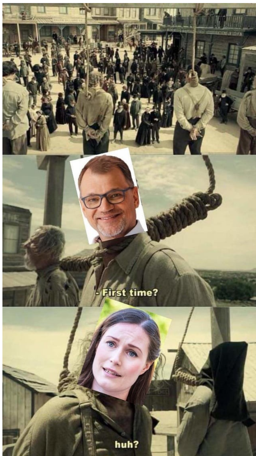
Kuva 13: "Aktiivimalli, aktiivimalli on tullut takaisin!"

Meemi on julkaistu 17.9.2020, ja upvoteja sillä on 351. 88 Meemi viittaa The Ballad of Buster Scruggs -elokuvaan ja aktiivimallin läpikäymiin muutoksiin sekä Sipilän että Marinin hallituskausien aikana.