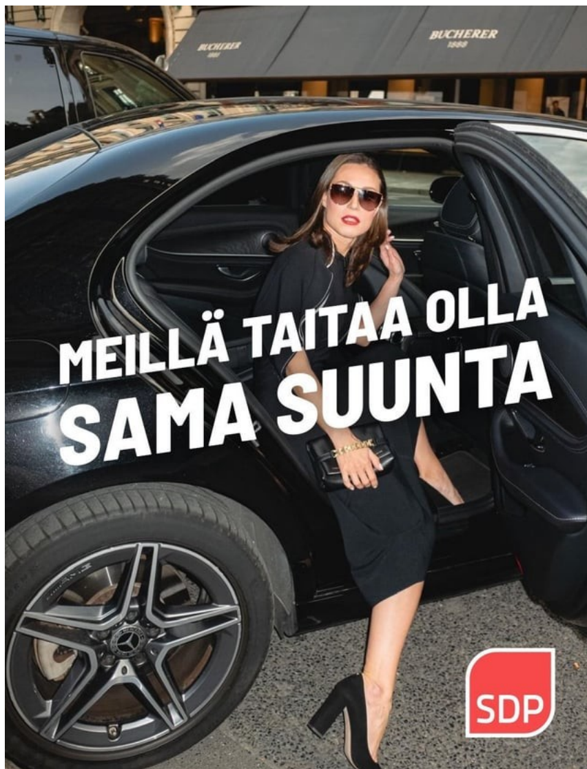
Kuva 17: Meillä tais olla sama suunta

”Meillä tais olla sama suunta” on julkaistu sivulle 4.10.2023. Upvoteja meemillä on 866. 95 Meemissä käytetty kuva on alun perin Marinin Instagram-tililtä. 96 Kuvan päälle on lisätty teksti ”Meillä taitaa olla sama suunta” ja kuvan alareunaan SDP:n logo. Teksti on SDP:n vuoden 2019 eduskuntavaalimainoksesta. Alkuperäistä videota en valitettavasti internetin syövereistä enää löytänyt. Sen sijaan Youtube-alustalta löytyy kiitettävästi erinäisiä parodiavideoita, joiden avulla voi saada käsityksen alkuperäisestä kampanjavideosta. Videolla Antti Rinne ajaa linja-auton pysäkillä, jonka