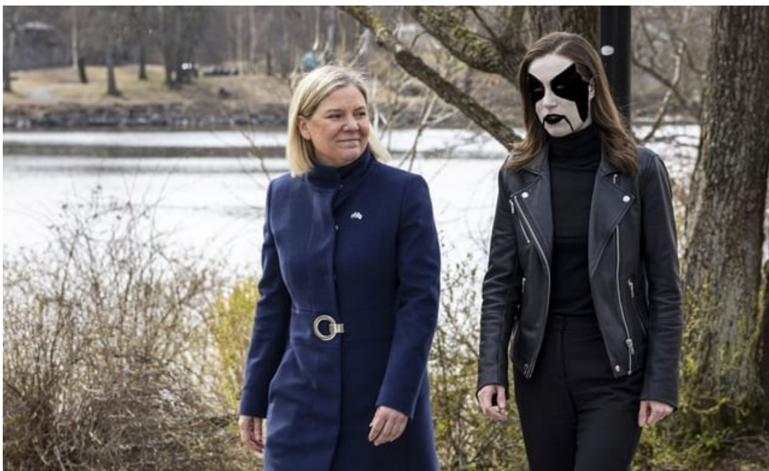
Kuva 2: Shannargth