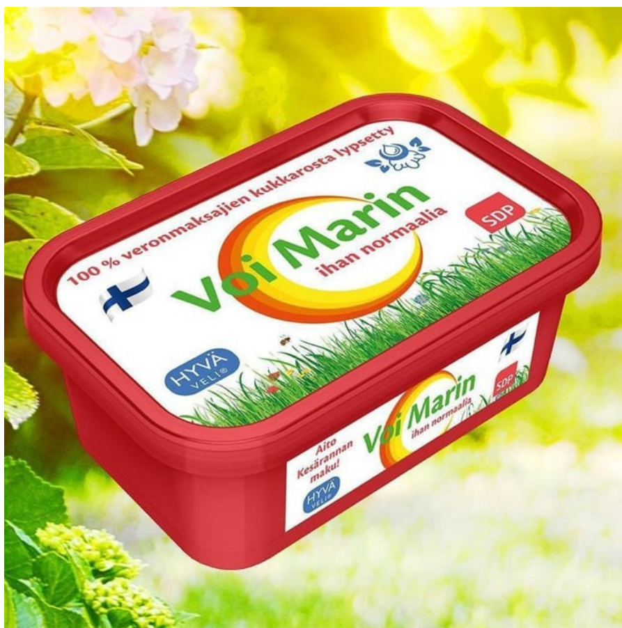
Kuva 1: #aamupalagate