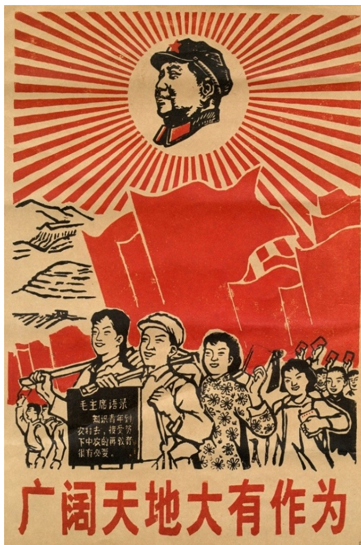
Kuva 21: Kiinan kulttuurivallankumouksen aikainen juliste

Meemin värimaailma, kontrasti, asettelu sekä tekstin fontti ilmentävät vanhoja vasemmistolaisia, poliittisia ja propagandistisia julisteita. Tyyli tuo mieleen muun muassa suosittut Che Guevara - julisteet. Irlantilainen taiteilija Jim Fitzpatrick muunsi Alberto Cordan kuuluisan Che Guevarasta otetun kuvan, Guerrillero Heroico , tunnetuksi populaarikulttuurin ilmiökseen. 105 Meemin asettelu ja orientalistinen fontti puolestaan muistuttavat Mao Zedongia kuvaavia julisteita. Meemin teksti, Chairman Meow, myös parodioi Mao'a. Mao Zedongin julisteiden osalta meemin asettelu ja tyyli tuovat mieleen muun muassa Kiinan kulttuurivallankumouksen aikaisen julisteen. 106