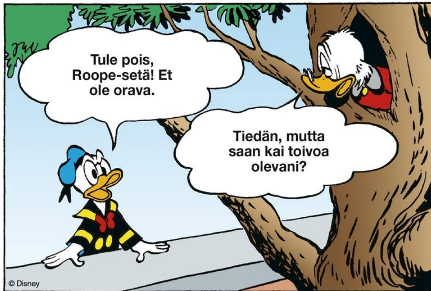
Kuva 23: Alkuperäinen sarjakuvaruutu

alkuperä on jokseenkin hämärän peitossa. Meemin lienee alkujaan kotimaisten verkkokeskustelujen kentältä.