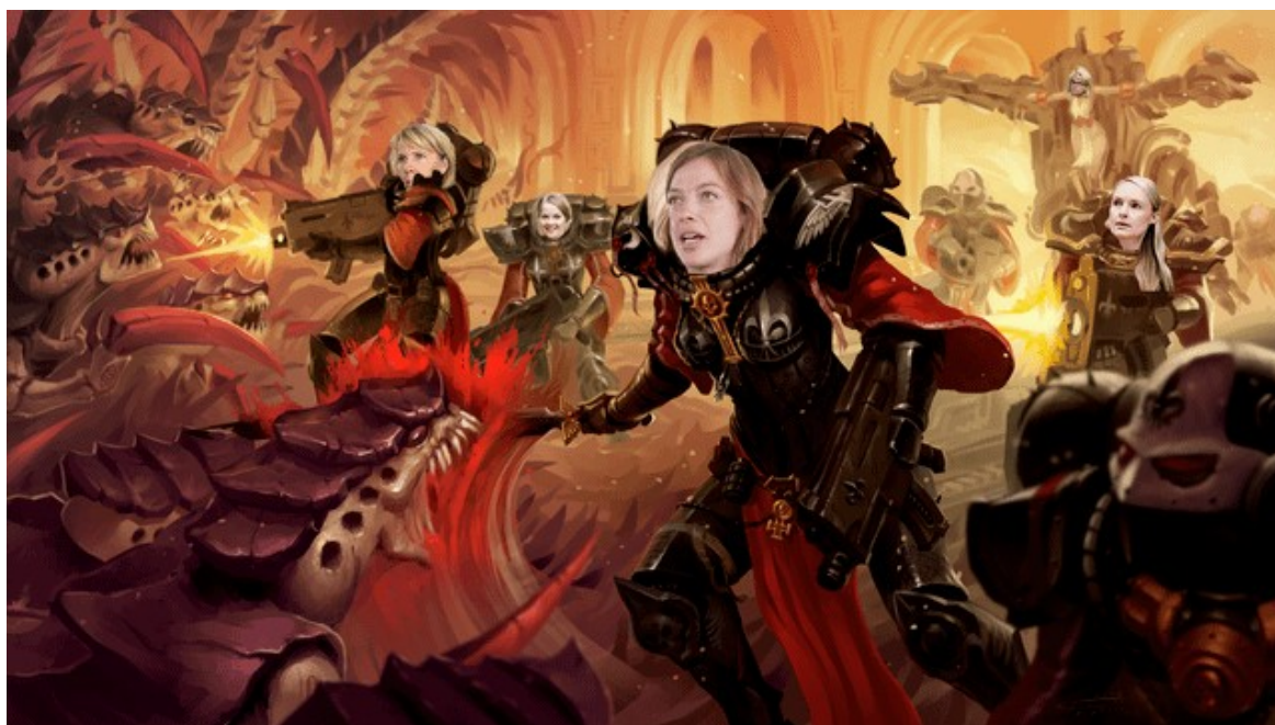
Kuva 14: Space Marin tarvitsi tuekseen Sisters of Hallituksen!