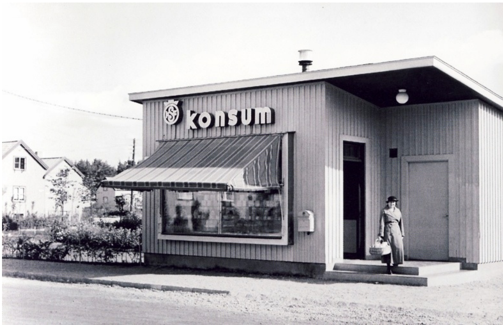
Kuva 8. Konsum-myymäla Tukholman Svedmyrassa. Valokuvaaja Rosenberg, C. G 1938. KF, bildarkiv.

Kooperativa Förbundet perustettiin vuonna 1899 Ruotsin osuuskauppojen keskusjärjestöksi. Aatemaailmaltaan KF oli lähempänä suomalaista Kulutusosuuskuntien Keskusliikettä kuin SOK:ta ja KF:lla olikin läheiset suhteet Ruotsin sosiaalidemokraattiseen työväenpuolueeseen 26 . KF perusti oman arkkitehtitoimiston 27 vuonna 1924. Toimiston pääarkkitehtina toimi alusta alkaen Eskil Sundahl (1890–1974) aina vuoteen 1958 asti. Vuonna 1935 toimistossa oli töissä jo 70 arkkitehtia ja siitä oli tullut pohjoismaiden suurin arkkitehtitoimisto. (Brunnström 2004: 335; Jokinen 1992: 25–26.) Vuoteen 1935 mennessä arkkitehtitoimistolla oli laadittu 2000 piirustusta myymälöitä ja niiden sisustusta varten (Arkkitehti 1935: 27), joista 500 kpl oli uusia myymälärakennuksia ja 600 kpl vanhojen myymälöiden uudistamisiirustuksia (Brunnström 2004: 188).