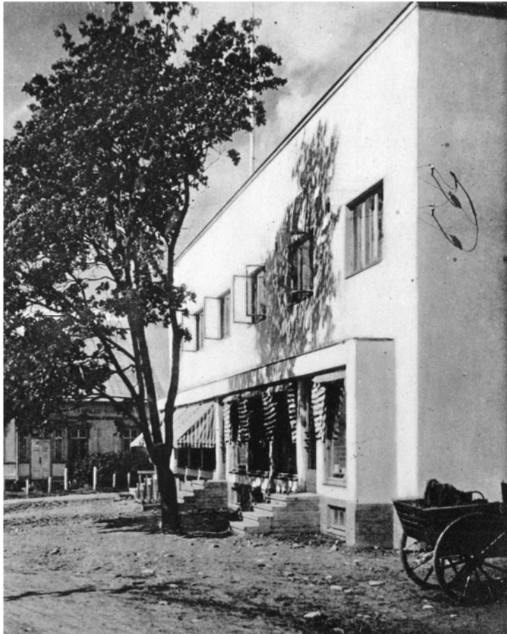
Kuva 20. Osuuskunta Aitan myymälä Sauvossa, suunnitellut Erkki Huttunen. Sauvon Aitan uusi tyylipuhdas rakennus (Osuuskauppalehti 26/1936: 586). Rakennus on suojeltu.

Itse kuvan lisäksi huomio kiinnittyy kuvatekstin sanaan "tyylipuhdas". Tekstin julkaisun aikoihin funktionalismi-termi oli jo vakiintunut, mutta jostain syystä sitä ei tässä yhteydessä käytetty. Tyylipuhdas-sanalla saatettiin viitata siihen, että Sauvon myymälä on tyyliiltään puhtainta funktionalismia. Toisaalta kyseessä voisi olla myös sanaleikkely "tyyleistä puhdas". Tätähän monet funktionalistit halusivat olla. Artikkelissa oli kerätty yhdelle sivulle Ruokolahden, Paimion ja Sauvon funkismyymälät sekä viereiselle sivulle ko. osuuskauppojen vanhat myymälät. Sauvon osuuskaupan kuvateksti kertoi, että Vanha Aitta oli jo käynyt ahtaaksi (emt. 587). Kuvassa oli vanhan puurakenteisen myymälän edessä lava-auto, jonka lavalla seisoivat useita ihmisiä. Kuvatekstin ja kuvan suhde on hieman koominen. Ikään kuin myymälä olisi käynyt niin pieneksi, että asiakkaat joutuivat seisomaan auton lavalla. Sitä ei artikkelissa kuitenkaan kerrottu, että vanha Aitta oli purettu uuden tieltä. Toinen kuvateksti kertoi, että Paimion Kauppaosuuskunnan vanha päämyymälä toimii nykyään tavallisena myymälänä (emt.).