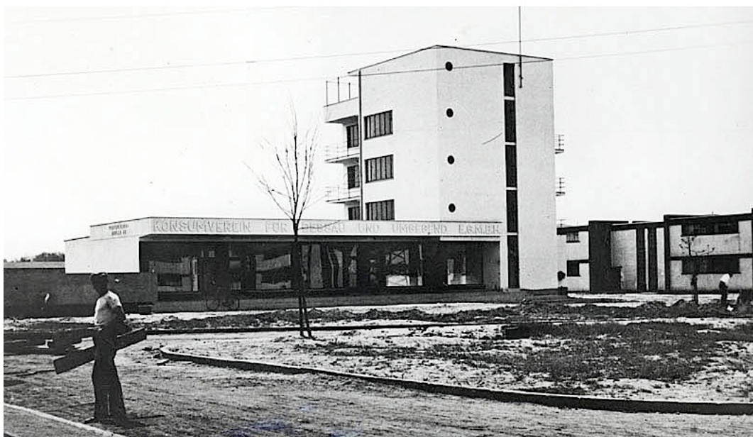
Kuva 3. Konsumverein–Dessaun osuuskauppa. 1928.

Bauhaus oli muotoilukoulu, joka toimi Saksassa Weimarin tasavallan aikaan 1919–1933 12 . Koulun perustajahahmo oli Walter Gropius (1883–1969), joka toimi koulun johtajana vuodet 1919–1928. Myöhempiä johtajia olivat Hannes Meyer (vuodet 1928–1930) ja Mies van der Rohe (vuodet 1930–1933). Modernin arkkitehtuurin kannalta merkittävin ajanjakso koululla oli Dessaussa, jonne valmistui Gropiuksen suunnittelemat uudet toimitilat vuosina 1925–1926. (Bauhaus Dessau 2014a.) Gropius suunnitteli myös Konsumverein eli Dessaun osuuskaupan rakennuksen, joka koostui yksitasoisesta myymälärakennuksesta sekä viisikerroksisesta asuintalosta (kuva 3). Nämä kaksi erillistä toimintoa sulautuivat tyylikkäästi yhteen. Myymälässä oli kolme erillistä osastoa väliseinän jaettuna. Myymälän julkisivu muodostuu lähes pelkästään isoista näyteikkunoista sekä sisäänkäynteistä kullekin osastolle. (Bauhaus Dessau 2014b.)