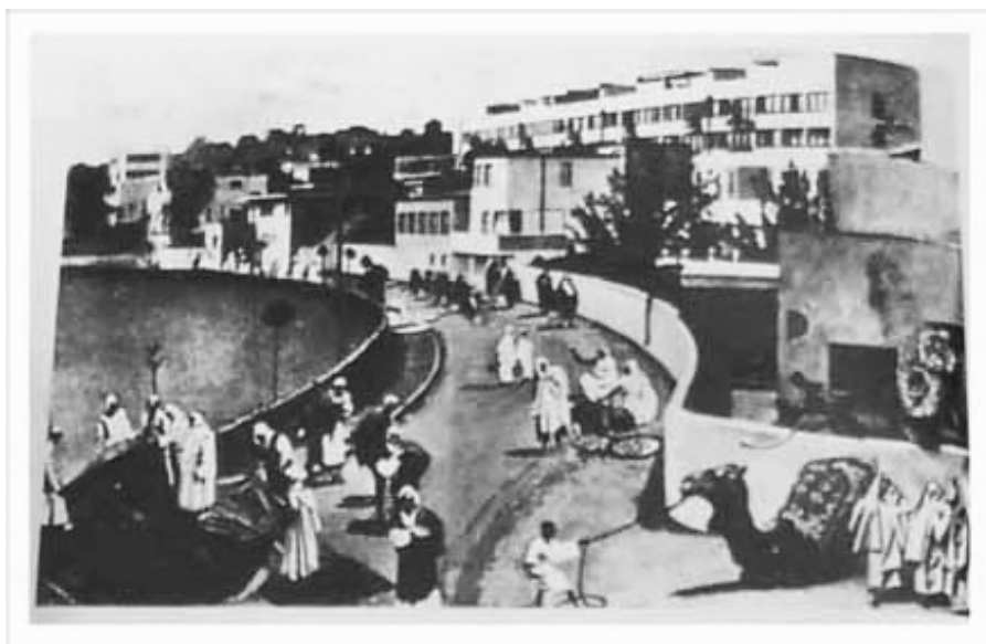
Kuva 17. "Arabikylä" (Jourden 2008).

Jukurisen ajattelutavassa korostuu "ajan hengen" käänköpuoli ja siinä on nähtävissä yhteyksiä Saksan kansallissosialisteihin, jotka inhosivat Bauhaus-koulun luomia moderneja tasakattoisia rakennuksia. Vastustajat jopa julkaisivat fotomontaasin keinoin luodun postikortin Stuttgartin "arabikylästä", jossa oli modernien rakennuksien ympäristössä arabiväestöä ja kameleita.