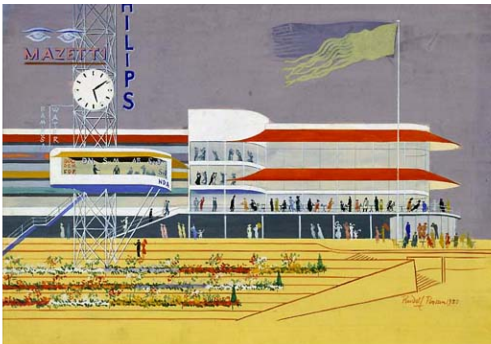
Kuva 4. Tukholman näyttelyn juliste 1930.

Vaikka edellä mainitut sveitsiläis-ranskalainen Le Corbusier sekä saksalainen Bauhaus-koulu innoittivat merkittävästi suomalaisia nuoremman polven arkkitehteja, Ruotsilla oli yksittäisenä maana suurempi merkitys. Uudet arkkitehtuurin virtaukset tulivat Ruotsiin hieman Suomea aiemmin ja Ruotsi oli jo pelkästään maantieteellisen ja kulttuurisen 15 läheisyytensä vuoksi monelle suomalaiselle arkkitehdille luonnollinen vierailukohde. Vuonna 1930 järjestettyä Tukholman näyttelyä voidaan pitää ruotsalaisen funktionalismin lopullisena läpimurtona. Kyseessä oli kansainvälinen arkkitehtuurinäyttely, joka kesti toukokuusta syyskuuhun. Messujen typografinen ilme ja rakennukset olivat kaikki funktionalistisia.