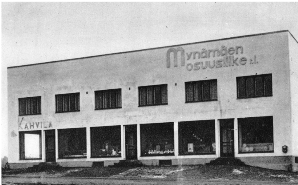
Kuva 18. Mynämäen Osuusliikkeen myymälä, suunnitellut Erkki Huttunen. Eräs uuden rakennustyylin tyypillisimpiä edustajia. (Osuuskauppalehti 26/1936: 585).

Mynämäen osuusliikkeen ja Osuuskunta Aitan myymäläkuvat ovat periaatteessa samoja kuin lehdessä esitetyt. Kuitenkin yllättäen Mynämäen osuusliikkeen kuvaa (kuva 18) on hieman käsitelty. Tarkkasilmäinen lukija huomaa Mynämäen osuusliikkeen rakennuksen edustalla kaksi kuvasta häivytettyä pylvästä. Ilmeisesti kirjasta haluttiin sen verran edustava, että tiepylväät koettiin häiritseviksi. Kuvakulma ei ole kaikkein edustavin ja kuva on selkeästi vinossa. Myymälä näyttäisi olevan vastavalmistunut eikä sitä ole välttämättä kokonaan sisustettu. Myös myymälän edusta näyttää viimeistelemättömältä.