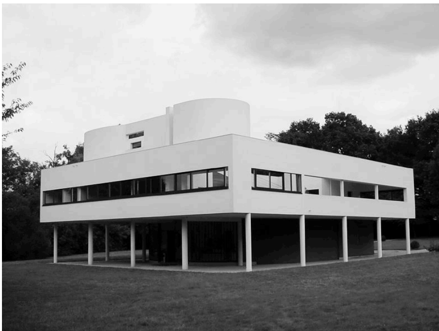
Kuva 2. Villa Savoye. (Wikimedia Commons 2008).

Suunnitelma lähtee sisältä ulospäin, ulkoinen on sisäisen tulos. Arkkitehtuurin elementit ovat valo ja varjo, seinä ja tila. Järjestys on päämäärien hierarkia, pyrkimysten luokittelemista. (Le Corbusier 2004: 142.)