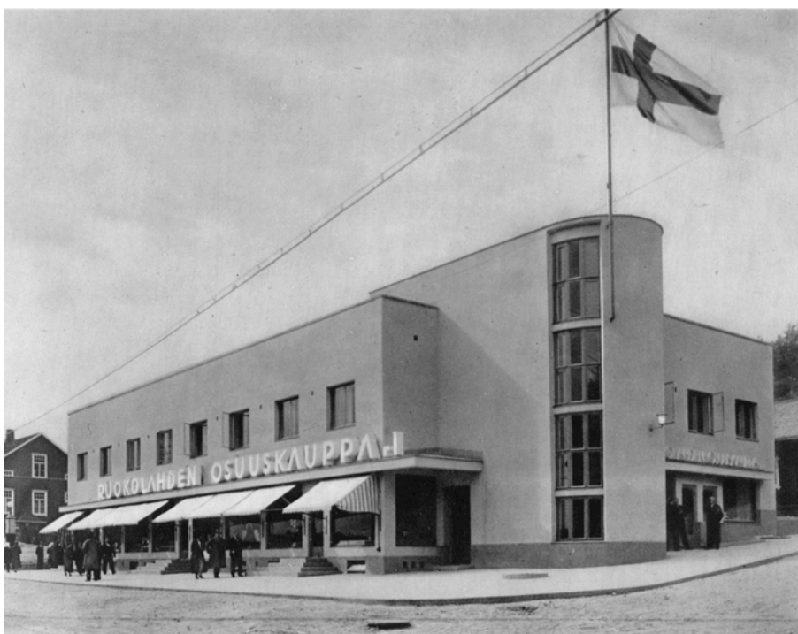
Kuva 21. Ruokolahden osuuskaupan uusi myymälä (Imatran Vuoksenniskalla), suunnitellut Paavo Riihimäki. Verratkaapa Ruokolahden uutta ylvästä taloa oikealla olevaan vanhaan. (Emt. 586). Purettu 1990-luvun alussa.

Ruokolahden uusi myymälä (kuva 20) on kuvattu puolipilvisellä säällä ja rakennuksen siilomaiseen portaikkoon piirtyy geometrinen varjo. Kauppapaikka näyttää elävältä; näyteikkunat on sisustettu ja ohi kulkee useita ihmisiä. Salkoon vedetty suomenlippu kertoo meneillään olevasta juhlapäivästä ja toimii myös vahvana kansallisena symbolina. Kuvatekstit huokuvat edistystä ja teknistä kehitystä. Nykyaika vaatii uudenlaisia rakennuksia, jotka tulevat korvaamaan vanhat, joskin idylliset myymälärakennukset (kuva 22). Uusi uhkea on funktionalismin metafora. Uhkean synonyymeja ovat mm. rehevä, runsas, täyteläinen, muhkea ja kookas. Liikerakennusta kuvaillaan samoilla ominaisuuksilla kuin ihmiskehoa, vrt. uhkeat muodot. Tekstistä on aistittavissa ajanmukaista koneromantiikkaa. Ylväällä on samaan aikaan viittauksia menneisyyteen (majesteettinen) kuin tulevaisuuteen (uljas). Ylvään synonyymi "uljas" assosioituu myös Aldous Huxleyn vuonna 1932 julkaistuun tietoisromaniin Uljas uusi maailma . Ylväs on hieman ristiriidassa osuuskauppojen arkkitehtuurista käydyn keskusteluun 63 kanssa, sillä osuuskauppojen uutta arkkitehtuuria ja sisustusta on perusteltu sillä,