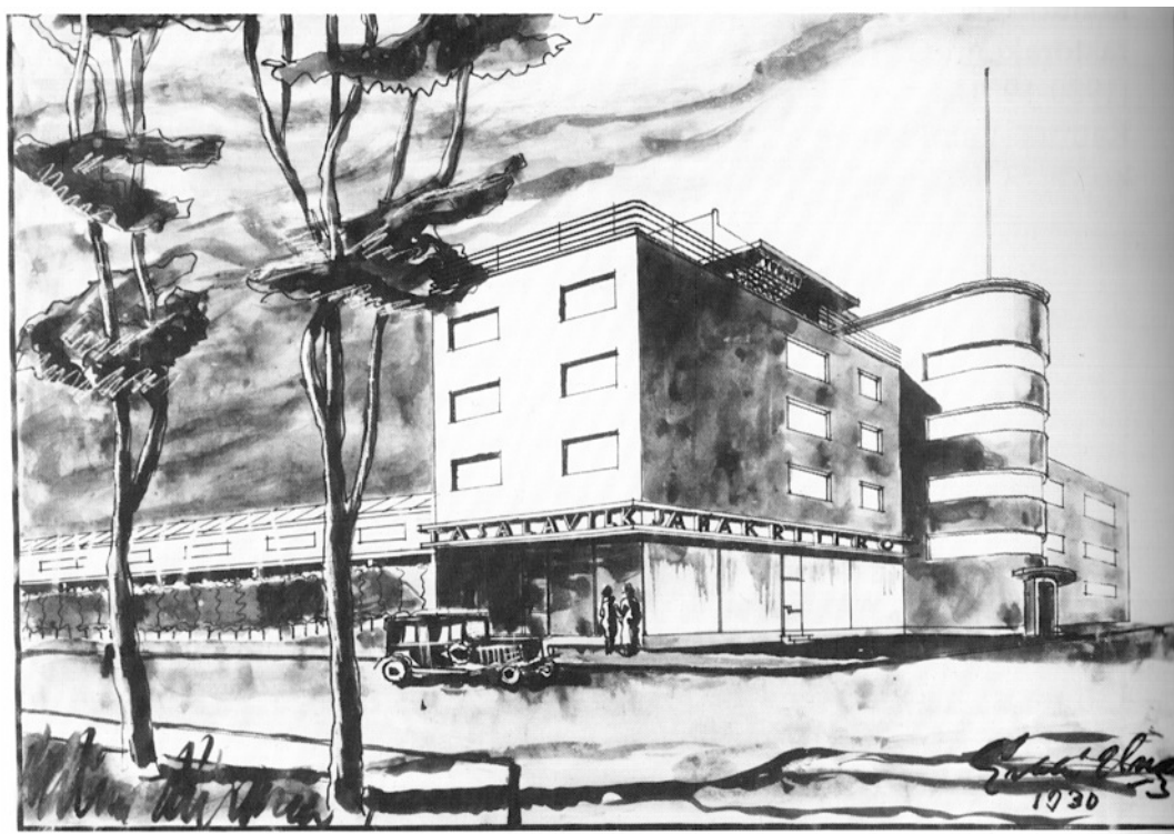
Kuva 10. SOK:n Rauman konttori- ja varastorakennus. Perspektiivilaveeraus 1930.