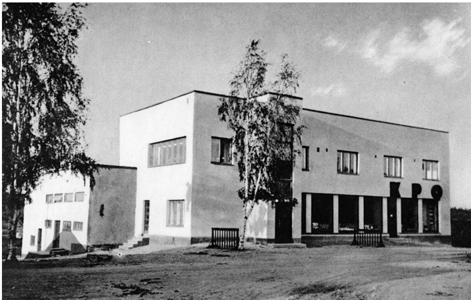
Kuva 1. Keski-Pohjanmaan Osuuskaupan myymälä Kaustisilla (SOK 1937: 11).