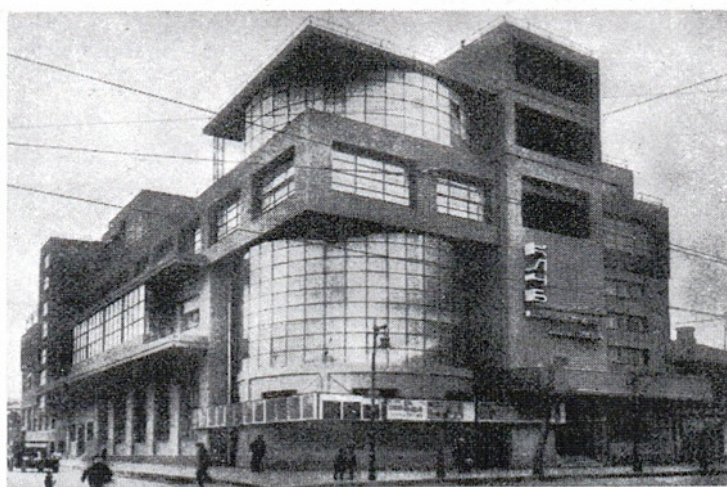
Kuva 14. Moskovalainen klubitalo. Malliesimerkki väärästä »funkiksesta» (emt.).