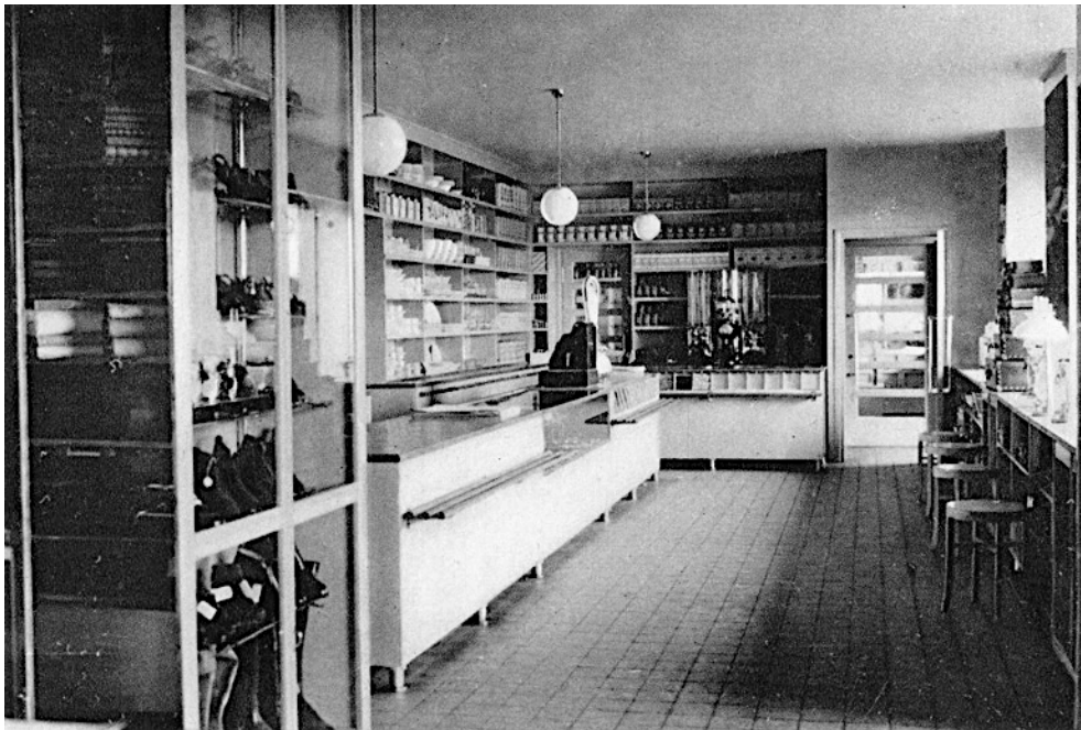
Kuva 6. Sisäkuva Kauhajoen myymälästä (SOK 1937: 12).

Suomessa 1930-luvun alkua leimasi taloudellinen lama, joka oli alkanut 1920-luvun lopulla Yhdysvalloista. Toisin kuin pula-aikoina, 1930-luvun laman aikaan kaupoissa oli kyllä myytäviä tuotteita, mutta monilla ei ollut niihin varaa (Peltola 2008). Funktionalistisen arkkitehtuurin läpimurto Suomessa tapahtui juuri taloudellisen laman aikaan, joka oli yksi syy funktionalismin nopeaan yleistymiseen. Kun kaikesta oli pulaa, karsittiin rakennuksistakin kaikki mikä miellettiin turhaksi. (Standertskjöld 2008: 20). Tämä koski niin tilojen suunnittelua kuin materiaalien valintaa. Kaiken tuli olla mahdollisimman tarkoituksenmukaista ja tehokasta. Muutos oli alkanut jo vähitellen 1920-luvulla ja se johti lopulta siihen, että esimerkiksi julkisivuista katosivat kaikki koristeet. Arkkitehdit ajattelivat, että rakennuksen ulkoasu muotoutui automaattisesti kauniiksi, kun sisätilat oli suunniteltu toimiviksi (Emt.) Klassismi säilyi kuitenkin vielä 1930-luvulla yhtenä tyylinä funktionalismin rinnalla, mutta monet klassista tyyliä käyttäneet arkkitehdit siirtyivät kokonaan funktionalismiin.