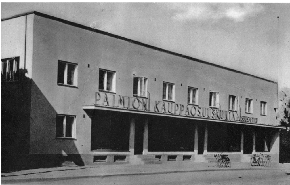
Kuva 19. Paimion Kauppaosuuskunnan myymälä, suunnitellut Paavo Riihimäki. Paimion Kauppaosuuskunnan uusi päämyymälä merkitsee uutta kautta paikkakunnan myymäläkulttuurissa (Emt. 586). Purettu 1990-luvulla.

Paimion kauppaosuuskunnan myymäläkuva (kuva 19) on jo selkeästi harkitumpi otos kuin Mynämäen Osuusliikkeen kuva. Kuvausilma on ollut aurinkoinen ja myymälän vasempaan pätyyn piirtyy varjo. Kuitenkin juuri auringonpaisteesta johtuen katsoja ei näe myymälän sisälle. Edusta on viimeistelty ja tiellä sijaitsee polkupyöriä, joka kertonee siitä että myymälä on auki ja sisällä on asiakkaita.