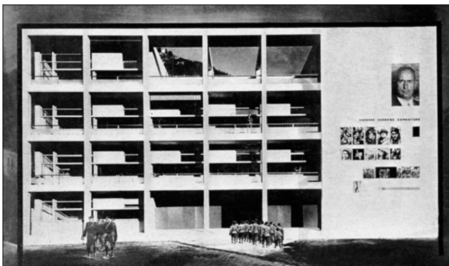
Kuva 15. Casa del Fascio. Fotomontaasi.