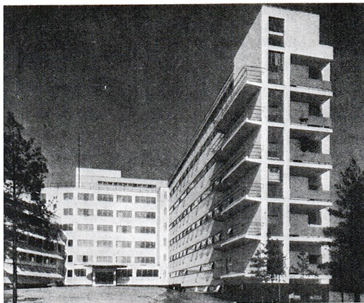
Kuva 13. Paimion parantola. Malliesimerkki oikeasta funkiksesta (emt.).

mutta kirkkaat ja jalot muodot löytyvät valkoisesta Suomesta. Vuonna 1926 valmistunut Zuevin työväen klubitalo (venäjäksi Дом культуры имени С.М.Зуева) edustaa venäläistä konstruktivismia.