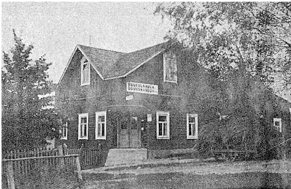
Kuva 22. Ruokolahden osuuskaupan vanha myymälä (Imatran Vuoksenniskalla). Idylliseltä tämä Ruokolahden vanha päämyymälä näyttää, mutta uusi uhkea on ajan vaatimuksia vastaava. (Osuuskauppalehti 26/1936: 587). Purettu, ajankohta ei ole tiedossa.

ettei niitä ole tarkoitettu prameudellaan häikäisemään. Uuden ja vanhan rakennuksen kuvaaminen vierekkäin on itsessään valinta, jolla pyritään vaikuttamaan mielipiteeseen. Vertaaminen on tosin kvasilooginen argumentti, kun siinä ei käytetä todellisia paino- ja mittajärjestelmiä hyödyntävää punnitsemista (Perelman 1996: 86). Vanha rakennus esitetään idyllisenä, mutta joka tapauksessa menneeseen aikaan kuuluvana. Uusi uljas edustaa nykyaikaa ja tulevaisuutta.