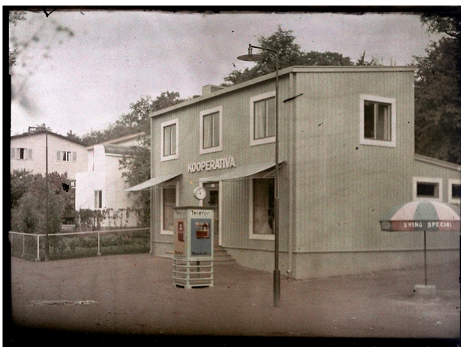
Kuva 5. Konsum-myymälä (A-sarjan myymälä nro 2) Tukholman näyttelyn messualueella. (Kuvaaja: Cronquist, Gustaf Wernersson 1930).

Thunströmin suunnittelema vaatimattoman näköinen puinen pulpettikattoinen maaseutumyymälä (kuva 5), jonka yläkerrassa oli asunto ja alakerrassa myymälä (Brunnström 2004: 195). Puisen myymälän vastapainona oli isompi tasakattoinen kaupunkimyymälä, jonka alakerrassa oli myymälätilat jaettuina kolmeen osastoon 17 . Rakennuksen oli suunnitellut arkkitehdit Eskil Sundahl ja Gösta Hedström. (Brunnström 2004: 189.) Suomalaisten osuuskauppaliikkeiden edustajat ja arkkitehdit kävivät tutustumassa KF:n rakennussuunnitelmiin. Suomalainen KK kehitteli ruotsalaisten mallien pohjalta oman pulpettikattoisen tyyppimyymälän (Niskanen 2005: 54). Tyyppimyymälöitä rakennettiin pääasiassa maaseudulle sekä esikaupunkialueille.