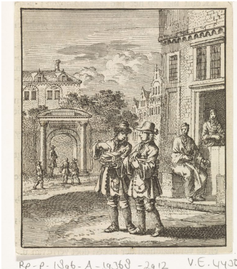
Jan Leyken, Kaksi opiskelijaa , Rijksmuseum Alankomaat.