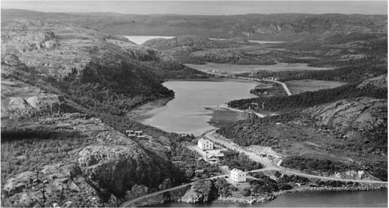
La regione storica di Petsamo

Il viaggio prosegue sull'autobus giallo-arancione che percorre «la grande autostrada dell'Artico» fino a Petsamo: il Lapland Express , come familiarmente viene chiamato. In Lapponia meridionale «i colori del paesaggio sono vivaci e lieti, la popolazione è qua e là abbastanza numerosa, la regione appare prospera»; proseguendo verso nord, si notano solo costruzioni in legno, tutte provviste dell'indispensabile sauna. L'intervento umano nel paesaggio non è mai invasivo, ma sempre gestito in armonia con la natura: «Questa è tuttora una regione di pionieri, una terra di conquista [...] i coloni norvegesi si sono ritirati. Soltanto la perseveranza e la sobrietà dei Finni poteva compiere il miracolo». Grazie a loro la Lapponia ora produce rape, patate e barbabietole in quantità sufficiente agli abitanti. Il viaggio non riserva più forti emozioni: si attraversa Sodankylä, «una delle località più fredde della Lapponia [...] che in una giornata di sole fa un'impressione abbastanza piacevole, ma che col cattivo tempo deve essere piuttosto malinconica», destinata però a un sicuro sviluppo turistico, come dimostrano l'insegna di un parrucchiere e «l'alberghetto», pur modesto, fiorito e accogliente.