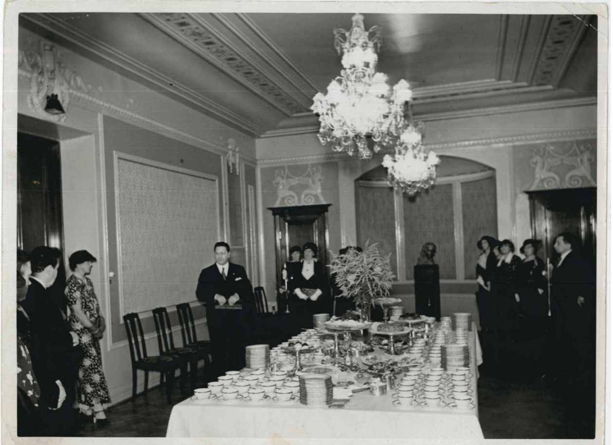
Ricevimento alla Regia Legazione d'Italia ad Helsinki