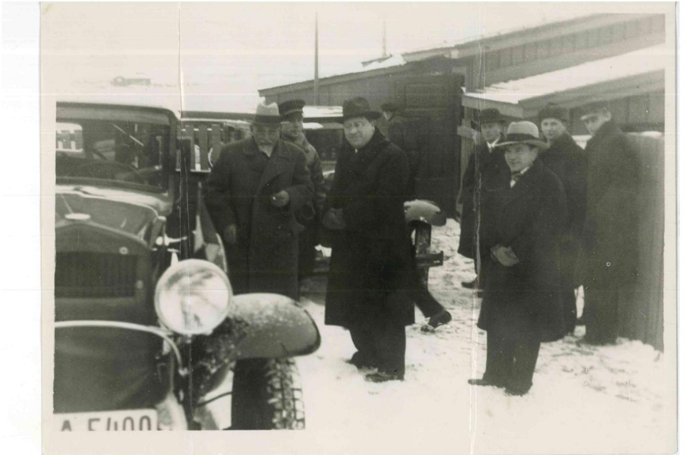
Luigi Pirandello al suo arrivo ad Helsinki nel 1933 accolto dal Ministro Tamaro