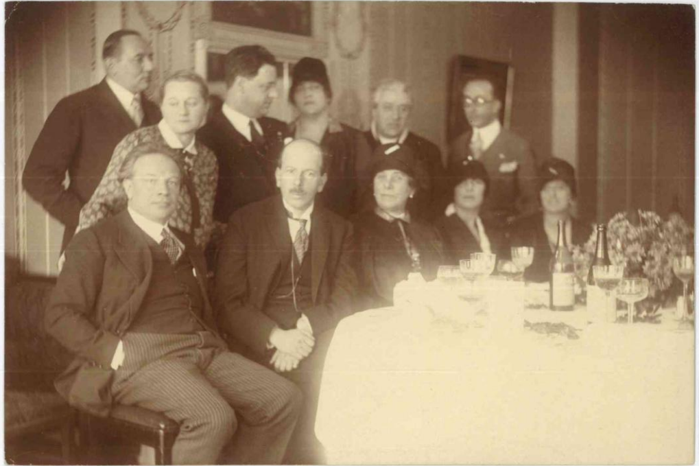
Ottorino Respighi ed Attilio Tamaro al ricevimento nella Regia Legazione