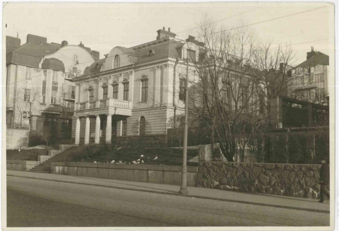
La sede della Regia Legazione italiana ad Helsinki negli anni Trenta