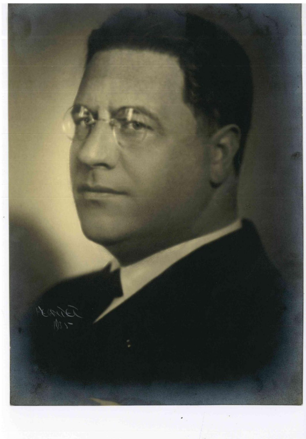
Il Ministro plenipotenziario Attilio Tamaro