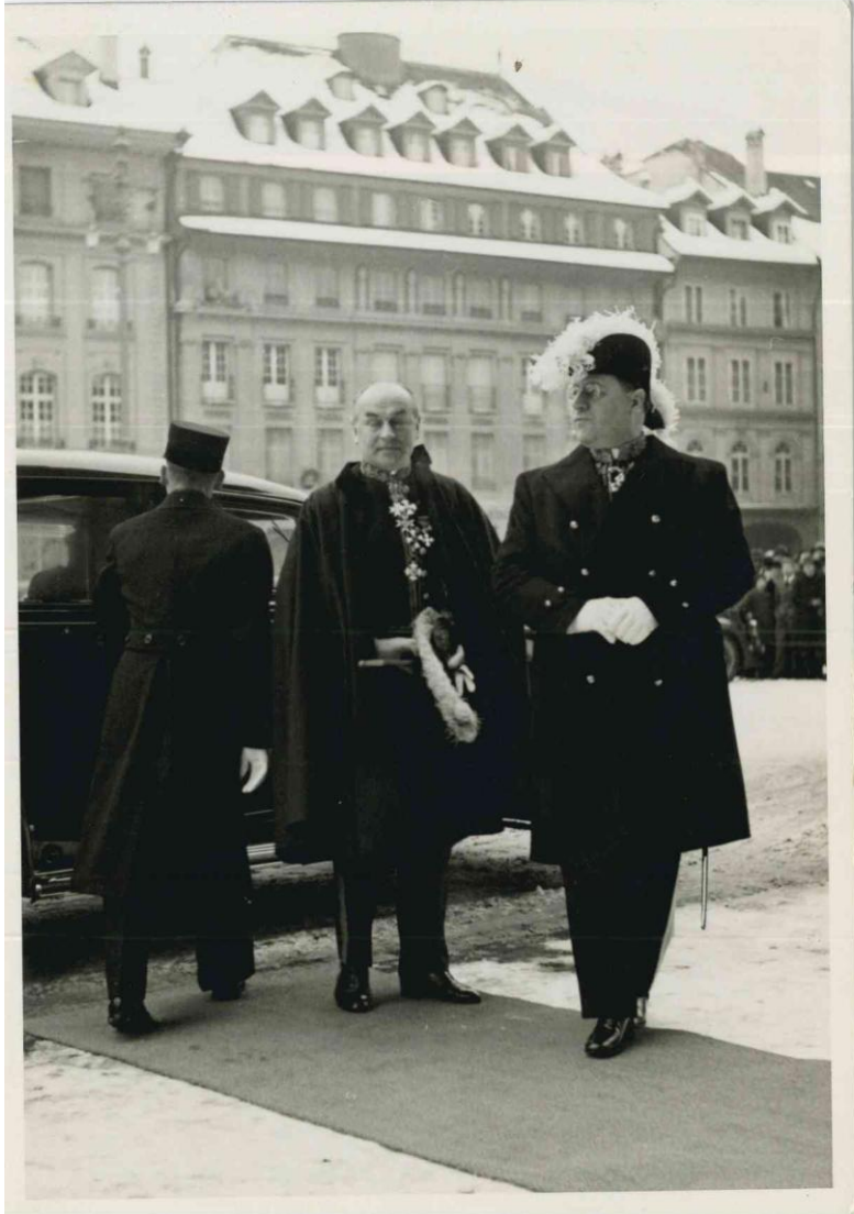
Il Ministro plenipotenziario in marsina e feluca ad Helsinki