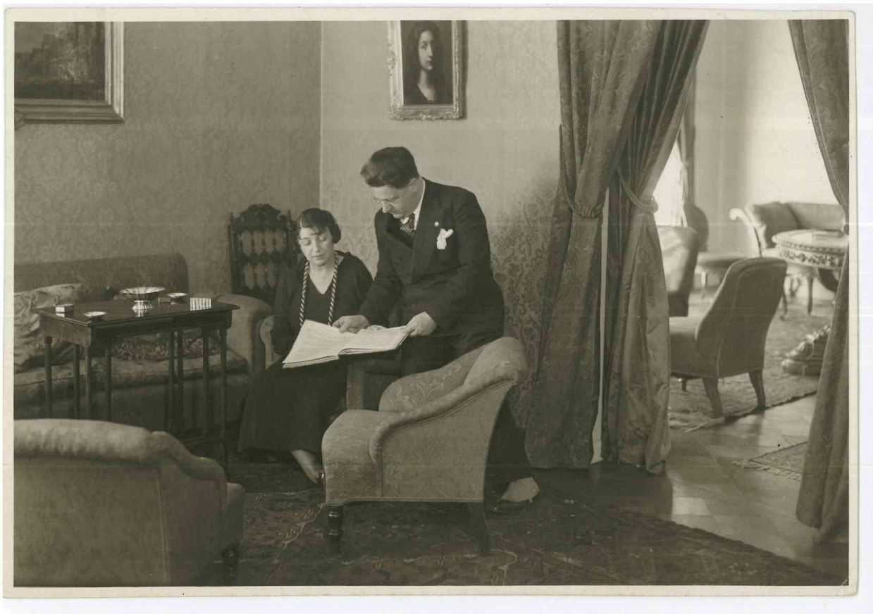
Il Ministro Tamara e la sua Signora ad Helsinki