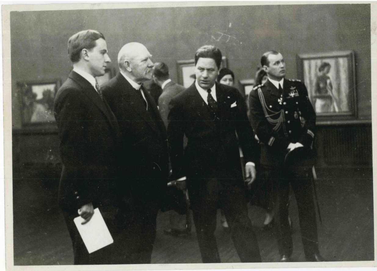
Attilio Tamaro ed il Presidente della Repubblica finlandese Svinhufvud all'inaugurazione della mostra "Il Novecento italiano"