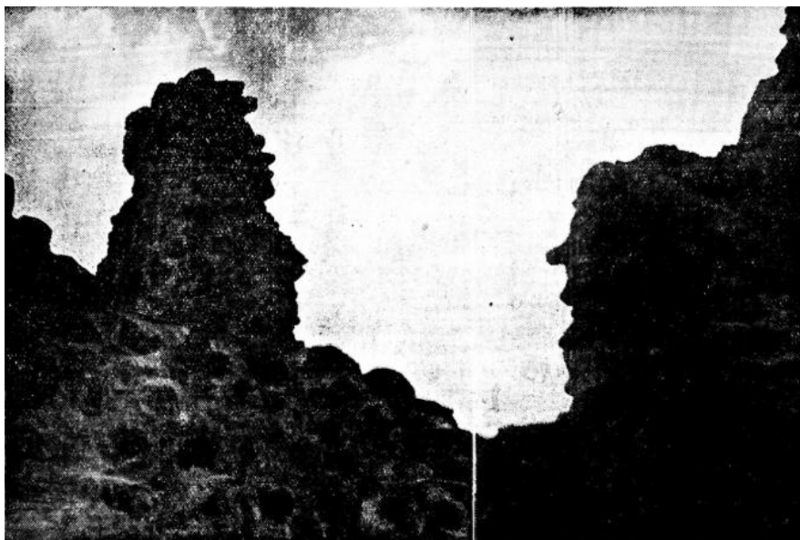
Kuva 5: "pari raunioitten kummitusta". 302

Uudessa Aurassa julkaistiin vuonna 1936 kuva (Kuva 5) kahdesta Kuusiston linnan kummituksesta lehden Sunnuntaikuvia-osiossa. Kuvatekstin mukaan Historicuksen julkaisemat artikkelit Kuusiston linnasta ovat olleet syynä, että eräs Uuden Auran avustajista on käynyt paikan päällä Kuusistossa kuvaamassa linnan kummituksia. "Hän on vanginnut kameransa avulla pari raunioitten kummitusta, joista on paljon puhuttu." 301