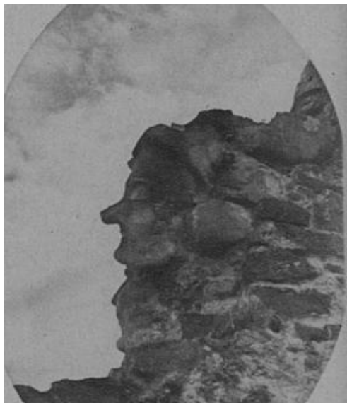
Kuva 4: Kuusiston linnan kummitus. "Ihmisen päätä muistuttava siluetti Kuusiston linnan muurissa." 300

Uudessa Aurassa julkaistiin vuonna 1936 kuva (Kuva 5) kahdesta Kuusiston linnan kummituksesta lehden Sunnuntaikuvia-osiossa. Kuvatekstin mukaan Historicuksen julkaisemat artikkelit Kuusiston linnasta ovat olleet syynä, että eräs Uuden Auran avustajista on käynyt paikan päällä Kuusistossa kuvaamassa linnan kummituksia. "Hän on vanginnut kameransa avulla pari raunioitten kummitusta, joista on paljon puhuttu." 301