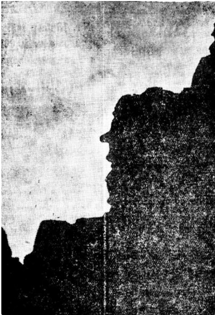
Kuva 3: Kuusiston linnan kummitus. Raunioiden mystillinen profiili. 297

kirjeenvaihtajamme käytyään ”paikan päällä” katsomassa. Mies, mahtava kuin mikäkin Egyptin kuvapatsas siellä muurissa maailmaan tuijottaa, kuten kuvamme osoittaa. Valokuvauskone ei valehtele, eikä kirjeenvaihtajammekaan. 296