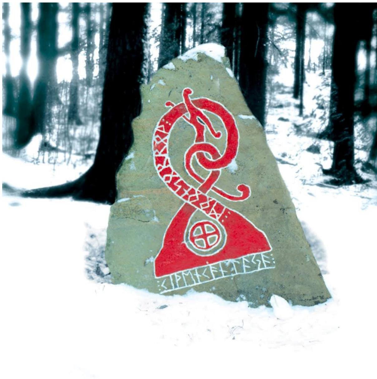
Kuva 7: Moonsorrow – Kivenkantaja. Moonsorrowin Facebook-julkaisu 11.3.2023. https://www.facebook.com/photo.php?fbid=776636627160010&set. Viitattu 27.11.2025.