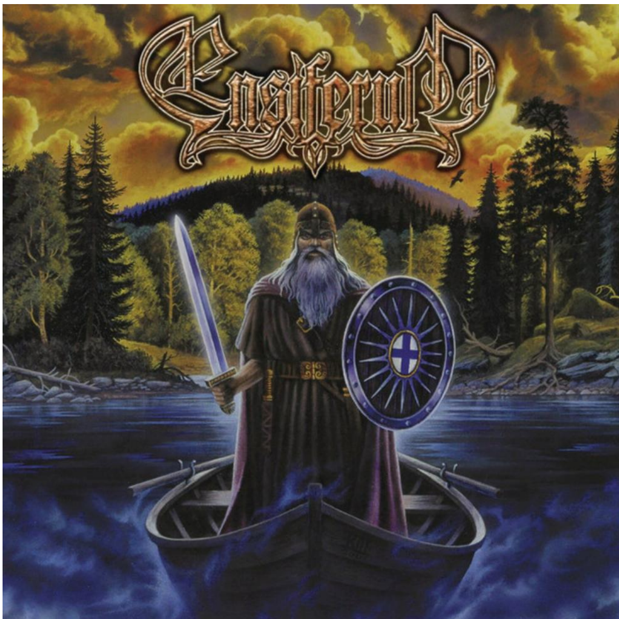
Kuva 3: Ensiferum – Ensiferum. Ensiferumin Facebook-julkaisu 9.7.2025. https://www.facebook.com/photo.php?fbid=1302582594556987&set. Viitattu 27.11.2025.