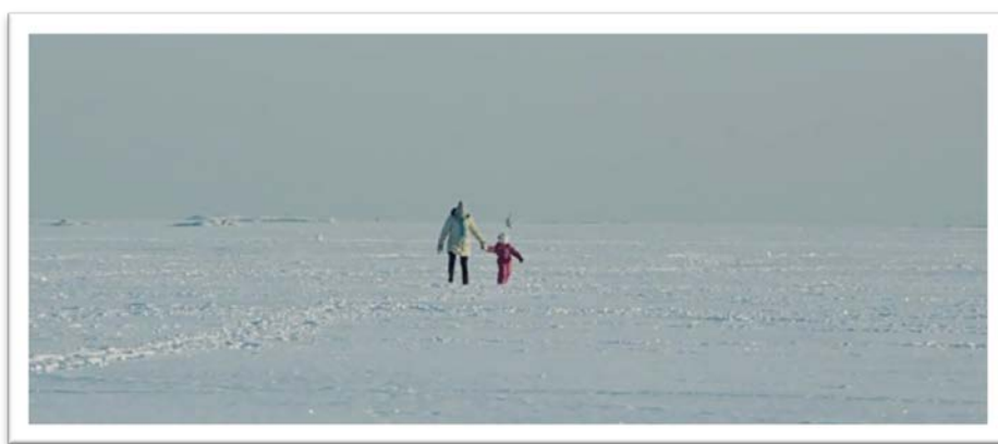
Kuva 3. Vuosaari-elokuva 00:00:07. Alkukohtaus jäällä.

taja osasi nähdä elokuvan talviset maisemat ja henkilöhahmojen elämäntilanteet toisiinsa liittyviksi. Kestoltaan 118 minuutin pitkän Vuosaari-elokuvan ulkokuvat on kuvattu talvisen Vuosaaren ympäristössä 98 . Elokuvan ensimmäinen otos osuu meren jäälle, jonka horisontissa kaksi hahmoa kävelee kohti kameraa. Ainoastaan elokuvan viimeiset otokset on kuvattu kesällä, jolloin kuvauspaikkana on avoimen meren kohtaama Vuosaaren ranta Aurinkolahdessa. Viimeiset yhteiskestoltaan 1,35 minuutin otokset alkavat Vuosaaren tunnelin päästä siintävällä kirkkaalla valolla, sitoen samalla episodien henkilöhahmojen kohdalolle toiveikkaat loput.