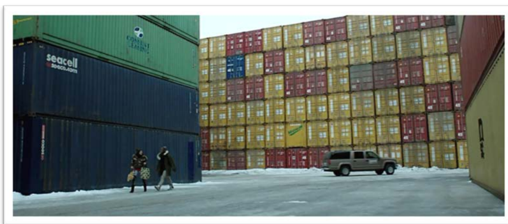
Kuva 5. Vuosaari-elokuva 01:42:00. Vuosaaren sataman jäi kirjoituksissa vähälle huomiolle.

Vuosaaren satama tulee esiin Vuosaari-elokuvan kahden eri episodin kuvauspaikkana. Otoksia on sijoitettu elokuvan keskelle ja loppuosaan. Suhteellisen nuori satama jää kuitenkin kirjoittajien teksteissä yllättävän vähälle huomiolle. Syynä saattaa olla myös elokuvan runsaat lähikuvat, jolloin elokuvan tila voi hahmottua katsojille tunnistamattomaksi varasto-alueeksi. Toisaalta satama sijoittuu Vuosaarissa kauaksi asutuksesta ja omana suljettuna alueenaan satama on saattanut jäädä etäälle kirjoittajien elämismaailmasta.