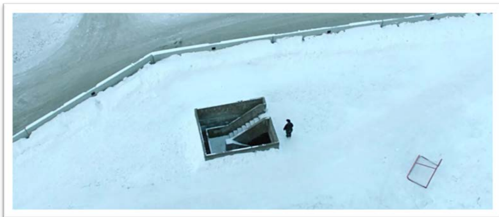
Kuva 2. Vuosaari-elokuva 01:50:37. Katsojalle (N21) tuttu näkymä.

Kirjoittajat huomioivat, että kauneus voi koostua eri elementeistä. Tähän osaltaan vaikuttaa myös se, onko kuvattu kohde vaikkapa tutussa kotiympäristössä. Koti viittaa paikkaan, jonka ihminen tuntee kodikseen. Kodissaan ihminen tuntee samalla olevansa osa paikkaa ja sen henkeä. Seuraavassa kirjoittaja kuvaillee elokuvan kohtausta, jonka kuvauspaikka on hänen asumansa talon oma pihaympäristö. Kirjoittaja näkee, että ohjaajan elokuvalliseen kerrontaan kuuluu esittää kuvattava ympäristö osana elokuvassa esiintyvän henkilön ahdistavaa olotilaa. Toisaalta elokuvasta tunnistettu tuttu kotiympäristö tuo kirjoittajalle positiivisia mielenyhtymiä.