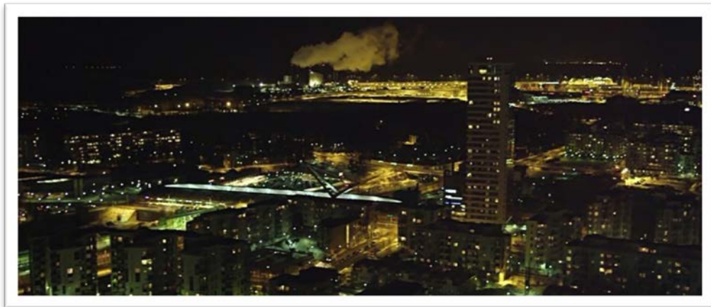
Kuva 1. Vuosaari-elokuva 00:19:03. Aku Louhimiehen Vuosaari on urbaani.

Aku Louhimiehen kuvatessa Vuosaarta urbaanina, esille tulevat muun muassa monet keskisen Vuosaaren katunäkymät sekä metron ympäristö. Elokuvaan ovat päässeet seiniin maalatut graffitit ja tægit. Vuosaaren urbaaniutta Louhimies on tuonut esiin myös ilmakuvien kautta, rajaten näkymää tiheästä kaupunkikuvasta. Louhimies jättää kuvauksessaan vähemmälle luontoon kuuluvat elementit. Luontoon viitataan lähinnä otoksissa, joissa kuvataan merta eri olomuodoissaan. Luonto esittyy elokuvassa myös vuodenaikana, talvi on osa ohjaajan mielenmaisemaa Vuosaaresta. Vuosaarta suuren kokonsa sekä asukasmääränsä myötä voidaan verrata moneen suomalaiseen keskikokoiseen kaupunkiin. Alue on myös osin rakennettu melko tiiviisti, joka luo urbaania tilaa. Kuusi kirjoittajaa kuvasikin Vuosaarta kaupungiksi kaupungissa.