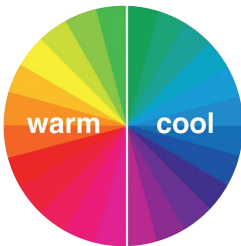
Kuva 1. Lämpimät ja kylmät värit.