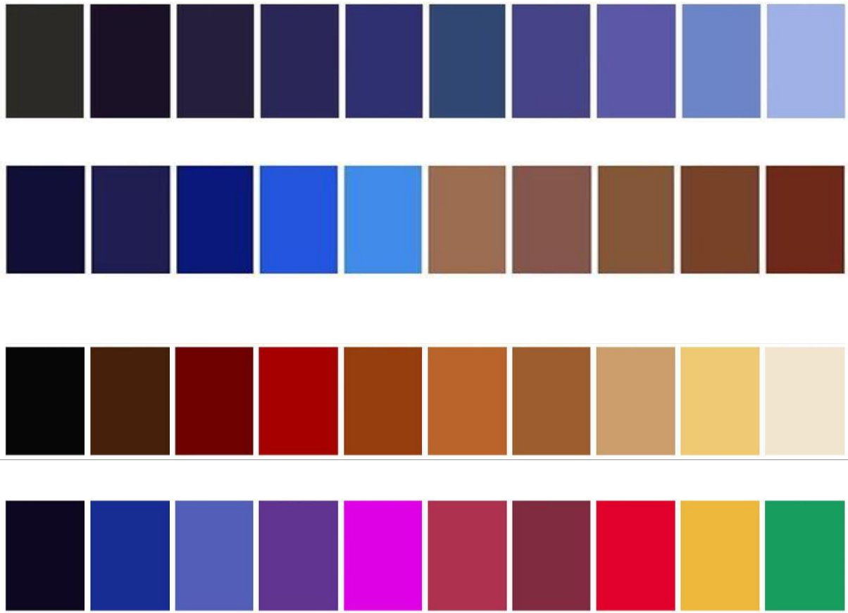
Kuva 3 Väripaletit elokuvan kohtauksista.

Yllä olevat väripaletit on poimittu eri kohtauksista Eyes Wide Shut -elokuvan aikana, jossa värit ovat tietyllä tavalla vastakkain tai enemmän sekoitettuna. Paleteista hahmottuu erityisesti sinisen värin keskeinen rooli elokuvan visuaalisessa maailmassa. Punainen sen sijaan esiintyy näissä otoksissa hillitymmin ja usein syvempinä sävyinä, kuten viininpunaisena tai tummanpunaisena. Näiden sävyjen toistuessa ja yhdistyessä siniseen muodostuu ruskean eri vivahteita, mikä vaikuttaa visuaaliseen rytmiin ja tunnelmaan.