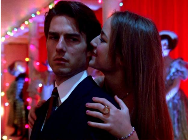
Kuva 4 Kuvakaappaus elokuvasta Eyes Wide Shut (Kubrick, 1999)