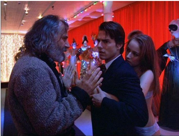
Kuva 5 Kuvakaappaus elokuvasta Eyes Wide Shut (Kubrick, 1999)