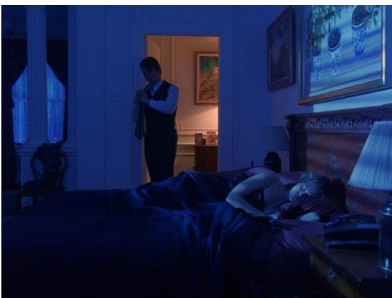
Kuva 7 Kuvakaappaus elokuvasta Eyes Wide Shut (Kubrick, 1999)