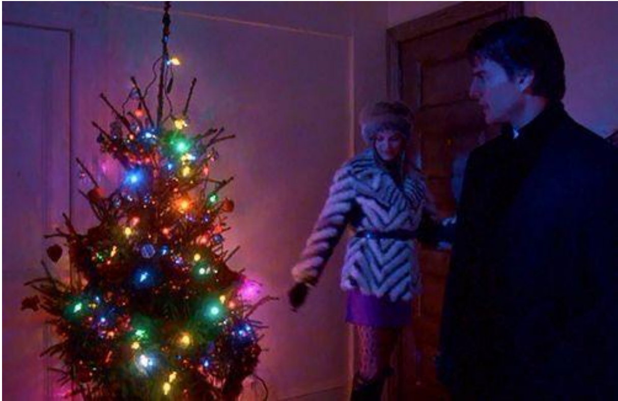
Kuva 8 Kuvakaappaus elokuvasta Eyes Wide Shut (Kubrick, 1999)