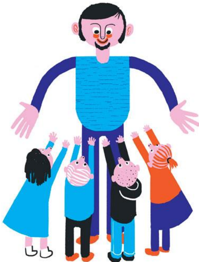
Liite 2.1. Neljä lasta haluaa miespuolisen henkilön syliin, joka on ottamassa heitä vastaan kädet avoinna.