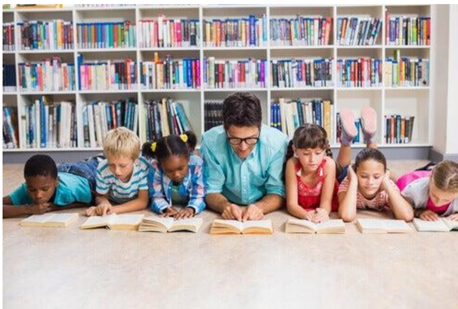
Liite 2.2. Miespuolinen opettaja lukee kirjoja oppilaiden kanssa kylki kyljessä lattialla maan.