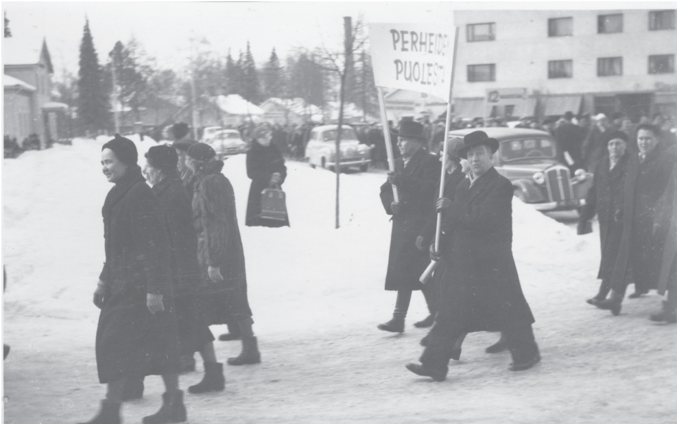
Kuva 33. Mielenosoituskulkue Forssan keskustassa yleislakon aikana vuonna 1956. Kyltissä lukee ”Perheiden puolesta”.

Seuraavan ryhmän suhteessa ammattiyhdistystoimintaan muodostivat henkilöt, jotka eivät kuuluneet ammattiyhdistysten hallituksiin tai toimineet luottamusmiehinä vaan olivat rivijäseniä. He eivät toimineet aktiivisesti yhdistyksessä, vaikka kannattivat sen toimintaa ja ideologiaa. Heille ammattiyhdistys oli tärkeä, vaikka he eivät halunneet rivijäsentä suurempaa roolia. Tämä ryhmä oli suurin tehdastyöntekijöiden keskuudessa. Ryhmän sisällä aktiivisuus vaihteli. Moni osallistui yhdistyksen retkille ja esimerkiksi pikkujouluihin. Joku lähti mukaan harvakseltaan, joku useammin. Osa kehotti järjestäytymättömiä työkavereita liittymään, mutta osa vain maksoi jäsenmaksunsa. 667