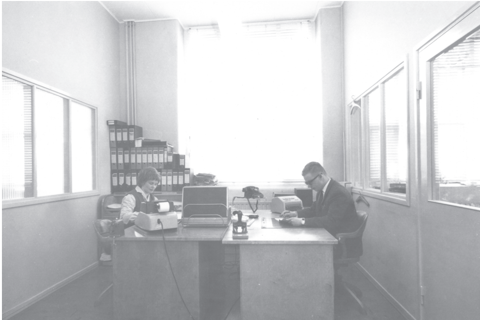
Kuva 6. Finlayson-Forssan Oy:n vanhan muovitehtaan konttoria 1960-luvulla.

puheeksi erityisesti kuvia katsottaessa. Ryhmäkuva helposti muistuttaa, että tuo henkilö lähti kuvanoton jälkeen Ruotsiin ja tuo perheineen Australiaan. Ruotsi näyttäytyi korkean elintason maana, josta sai helposti hyvän työpaikan, joten Forssastakin lähdettiin onnea etsimään. Osa jäi lopullisesti uusille kotiseuduille, osa palasi takaisin. 271