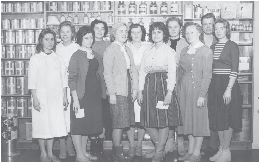
Kuva 3. Finlayson-Forssan tehtailla järjestettiin vuonna 1959 laboratorioapulaisten peruskoulutukseen liittyvä 38-tuntinen kurssi. Kurssille ottivat osaa kehräämön, viimeistämön ja muovitehtaan laboratorioissa työskennelleet.

nyttyä. 176 Tekstiiliteollisuus oli tehostamisprosessissa viimeiset 30 vuotta, joten monilla oli kokemuksia vaikeista ajoista, vaikka olisikin ollut itse toisessa työpaikassa tai jo eläkkeellä 2000-luvun lopulla. Osa suhtautui muutenkin tyyneesti elämänsä vaikeuksiin ja oli niiden kanssa sinut. Toisilla asioiden työstäminen oli kesken, ja työura tekstiiliteollisuudessa saattoi tuntua äärettömän raskaalta. Osa ihmisistä oli jäänyt katkeruuden alle, mutta nämä haastateltavat olivat pieni vähemmistö. Nämä haastatellut olivat minulle haastattelijana varmasti kaikkein raskaimmat, mutta haastateltaville ehkä vapauttavia