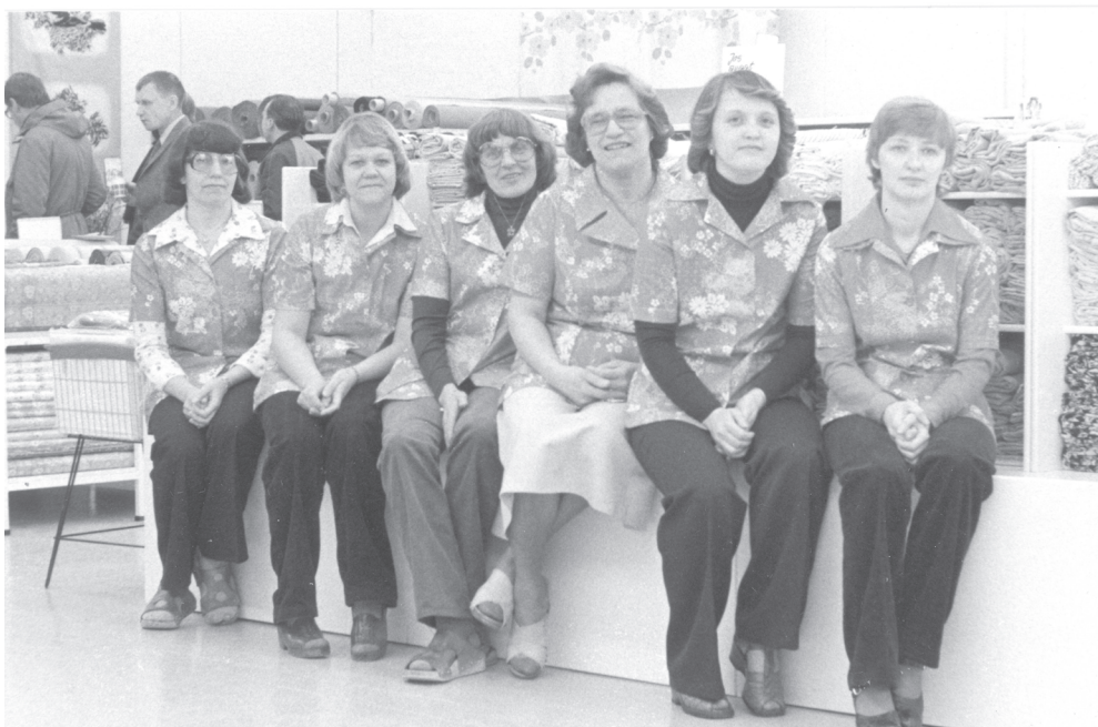
Kuva 27. Tehtaan kangaskauppa siirtyi Koskisillan pieleen vanhan puusepänerveaan rakennukseen vuonna 1979. Kuvassa myymälän henkilökuntaa avajaisissa.

Kertoja: Ja sitte oli kova valtti meillä nää sirosäkit. Se oli kova valtti. Nehän oli nää Puistolinnan asukkaatkin, niin ne oli monta kertaa ihan vihasia, kun nää maalaiset niin meni jonottaan sinne jo... Kun torstaihan oli tehtaalaisten päivä, aina. Niin sitten ne mitä niiltä jäi, niin nää maalaiset tuli jonottaan sinne. Sit nää oli tietysti vihaisia, nää asukkaat, ku ne viiden aikaan aamulla jo mölys siellä alapuolella. Kato ku pitivät kauheeta showta. Että niistä oli vähän niinku oikeen semmosta tappelua tavallaan, että ketä, semmosta oikeen rynnittiin sisälle. Se oli aina koomista.