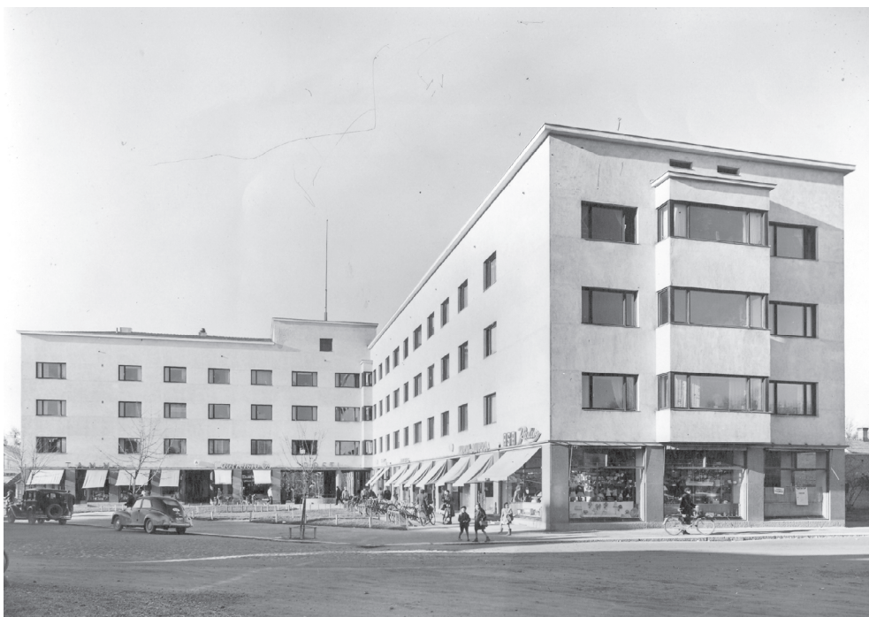
Kuva 24. Uutuuttaan hohtava Puistolinna kohoaa uljaana kauppalan keskuksena. Se oli monien mielestä paikkakunnan hienoin asuin- ja liikerakennus, jossa asuminen oli tyylikkyyden huippu.

Tarvittavien toimihenkilöiden määrän lisääntyessä Forssassa pohdittiin, miten osaavia ja ammattitaitoisia toimihenkilöitä voitaisiin houkuttaa paikkakunnalle. Tilava ja edullinen asunto nähtiin sellaisena houkuttimena, jonka avulla Forssa pyrki kilpailemaan Helsinkiä, Turkuja, Tamperetta sekä muita isoja kaupunkeja vastaan. Yhtiö ei enää rakentanut omia asuntoja toimihenkilöille vaan hankki asuntoja uusista rakennettavista kerrostaloista toimihenkilöitään varten. Usein muualta muuttaneet toimihenkilöt asuivat yhtiön asunnoissa jotakin vuosia ennen kuin alkoivat suunnitella oman asunnon hankkimista tai omakotitalon rakentamista. Jotkut hankkivat asunto-osakkeen sijoitusmielessä jatkaen asumista yhtiön asunnossa koko työsaolo-aikansa. Osa yhtiön omistamista taloista oli suuria ja vanhoja, joten osa niissä asuvista toimihenkilöperheistä pyrki yhtiön toisiin asuntoihin. Usein toimihenkilöille asuminen yhtiön asunnoissa oli hyvin edullista. Toisinaan omista asunnoista asuneet esittivät vaatimuksia käytännön muuttamisesta, sillä he maksoivat asumisestaan täyden hinnan, mutta saivat samaa palkkaa kuin yhtiön asunnoissa asuvat. 559