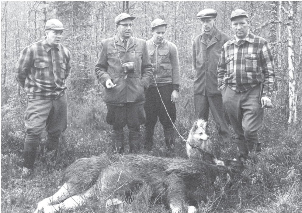
Kuva 37. Finlayson-Forssan henkilökuntaa hirvimetsällä syksyllä 1959.

1970-luvulla myös perheen merkitys ja yhdessä vietetyn ajan arvostus alkoivat nousta. Monilla työ oli mennyt aina kaiken edelle, mutta 1970-luvulla perhearvot alkoivat korostua. Kuten sitaatin miesjohtaja kertoo, uudet, nuoret johtajat halusivat viettää aikaansa myös perhepiirissä sekä itseä kiinnostavissa harrastuksissa. Enää yhdistäväksi tekijäksi ei riittänyt samanlainen asema yhteisessä työpaikassa. Nuoret ja hyvin koulutetut isät toimivat aktiivisemmin ja monipuolisemmin lastensa kanssa sekä osallistuivat kotitöihin vanhempaa kaarta innokkaammin. 712 Johtotehtävissä toiminut kertoja kuvaa ylimmän johdon kanssakäymistä 1950-luvulla: