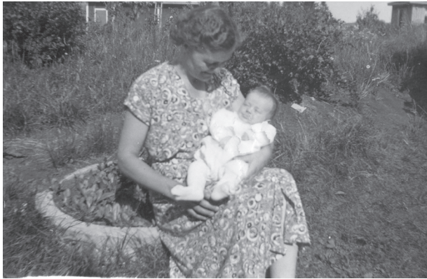
Kuva 15. Sota-aikana työ tekstiiliteollisuudessa oli osalle pätkätyötä. Pienten lasten äidit jäivät kotiin hoitamaan lapsia, jos töitä ei riittänyt tehtaalla kaikille.

kasta ja sisälsi paljon toistoja. Lyhyet synnytysslomat eivät edistäneet äitien terveyttä. Forssan tehtailla noudatettiin työntekijöiden kohdalla lain määräämää neljän viikon synnytysslomaa 1950-luvun alkupuolella. Keskinäisellä sopimuksella työntekijällä oli mahdollista olla pois jonkin verran pidempään työsuhteen katkeamatta. Toimihenkilöiden ja virkailijoiden synnytyssloma oli kaksi kuukautta. 424 Naisten luokka-asema siis määrätti synnytyssloman pituuden. Keskiluokkaisilla naisilla oli mahdollisuus olla pois töistä vauvan syntymän yhteydessä kaksi kertaa pidempi aika kuin työväenluokkasilla naisilla. Koska molemmilla synnytyssloma oli lyhyt, pyrkivät tulevat äidit käymään mahdollisuuksien mukaan töissä viimeiseen asti, jotta saisivat hoitaa vauvaa kotona synnytyssloman ajan.