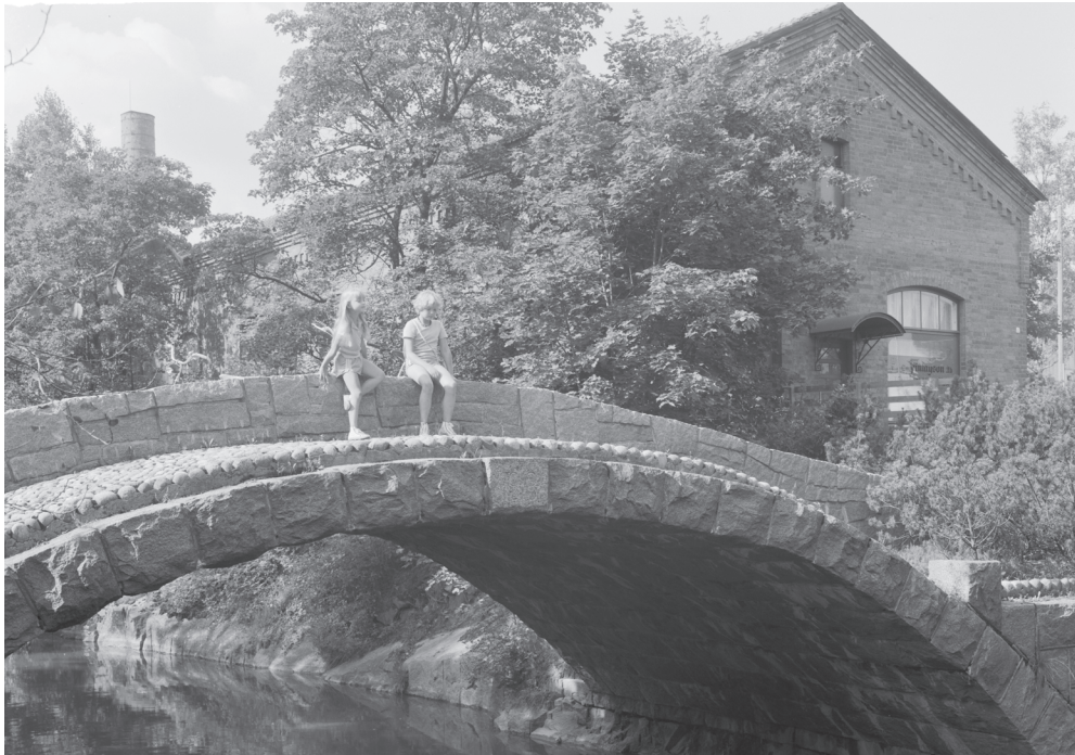
Kuva 30. Tytöt istuvat vanhalla Koskisillalla kesällä 1980. Oikealla Finlaysonin kangaskauppa.

Saunaa tutkinut Laura Puomies määrittelee saunan välitilaksi, jolloin se on juuri arjen ja pyhän sekä myös puhtaan ja likaisen välissä. 641 Lauantai oli yleinen saunapäivä, joka erotti työn ja vapaa-ajan. Lauantain ollessa vielä työpäivä, saunalla pestiin konkreettisesti pois työviikon hiet ja liat, mutta se toimi myös siltana työajan ja työntekijän oman vapaa-ajan välillä. Pesuveiden mukana huuhtoutui pois työnantajan määrittämä arki tehtaalla. Saunan jälkeen alkoi työntekijän vapaa-aika, jolloin hän sai itse päättää olostaan ja ajankäytöstään, kunnes alkoi taas seuraava työvuoro.