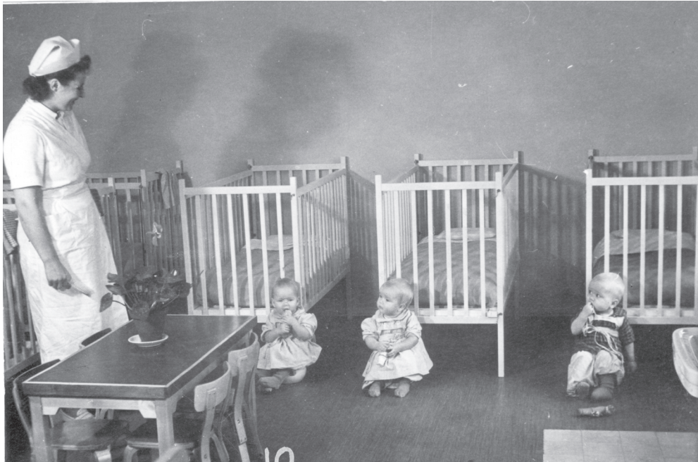
Kuva 17. Yhtiön lastentarhan seimiosastoa vuonna 1950. Aallon valokuvaamo. Forssan museon kokoelma.

1950–1960-luvuilla elintason noustessa lastenvaunuista tuli kuitenkin arkea helpotettava joka perheen varuste. 470