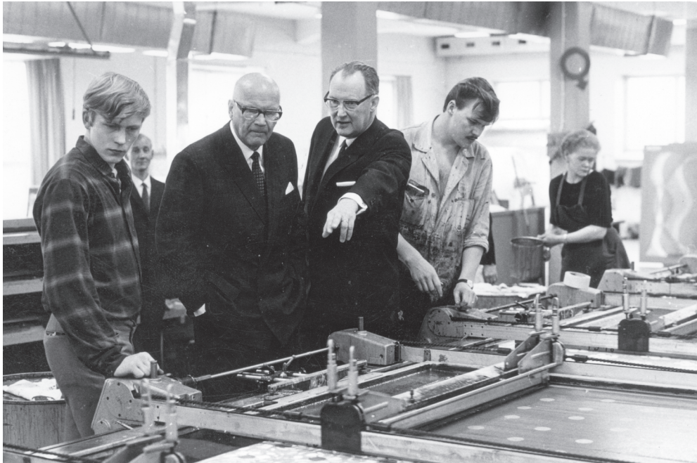
Kuva 2. Tasavallan presidentti Urho Kekkonen tutustui Forssan tekstiiliteollisuuteen keväällä 1969. Presidentti myönsi vuoden 1968 vientipalkinnon Finlayson-Forssalle. Kuvassa presidentille esitellään filmipainokonetta viimeistämössä.

ka piirsivät taiteilijoiden painomallit toistuviksi kuvioiksi, valmistivat työpiirustuksia sekä muokkasivat ostokuoseja. 29