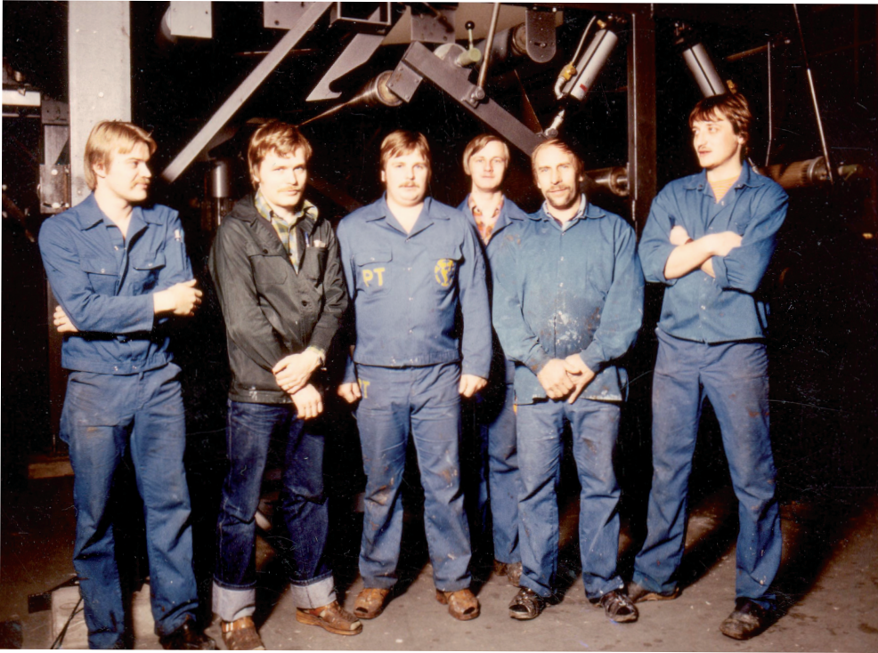
Kuva 9. Työntekijän ja esimiehen erotti tehtaalla myös vaatteista. Kuvassa muovitehtaan Stork-koneen 1. vuoron miehistö ja vuorotyönjohtaja, jonka tunnustaa erilaisesta pukeutumisesta. Kuva vuodelta 1980.

ja nätti, mutta ei liian ystävällinen tietenkään. Ja piti jaksaa loppuun saakka, ja ei saanu sylkeä lasiin. Aamulla piti olla pirteenä töissä. 345