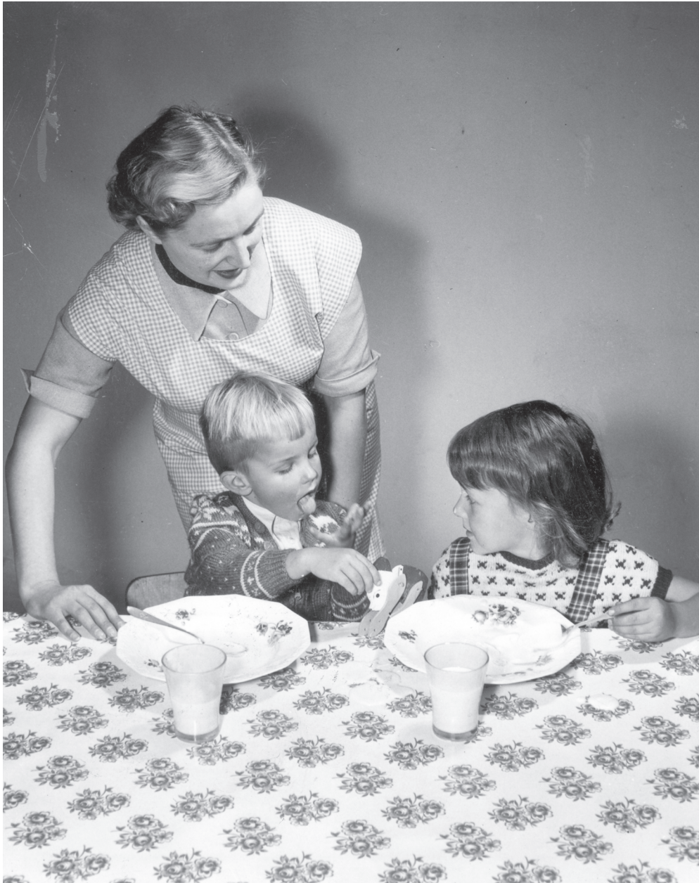
Kuva 14. Finlayson-Forssa Oy:n muovitehtaan kernimainos 1960-luvulta. Kuva viestittää, miten helpoitoinen kernipöytäliina helpottaa erityisesti äitien arkea lapsiperheissä. Forssan museon kokoelma.