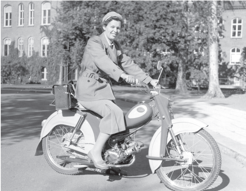
Kuva 32. Finlayson-Forssa Oy:n työterveyshoitaja 1950-luvulla.

ja fysikaaliset hoidot ja hieronnat ja tämmöset kuuluu sit siihen. Tällä hetkellä siellä on enää kai 280 jäsentä, mitä niitä on. Siinä muutama on semmonen kun on vielä töissäkin.