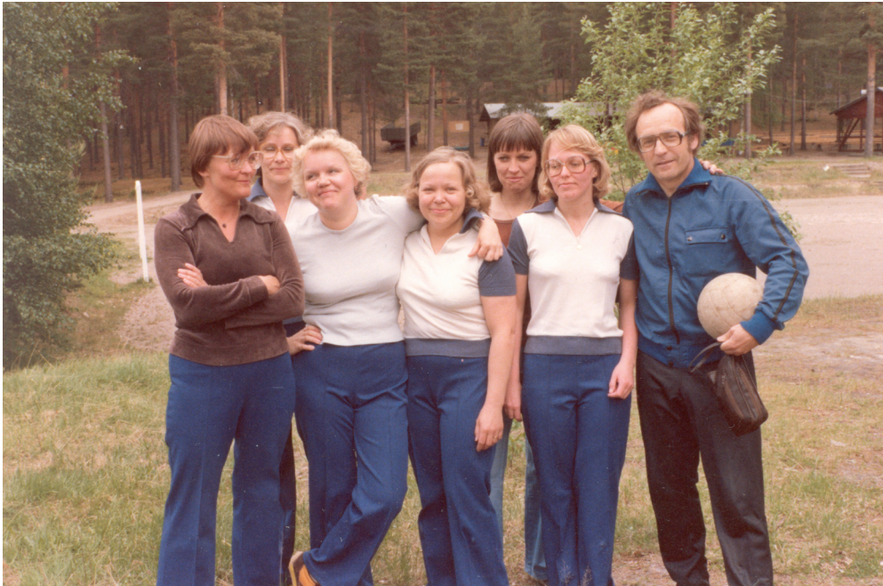
Kuva 38. Forssan tehtaan naisten lentopallojoukkue Julkujärvellä 10.6.1979.

maksuttomuutta tai alhaisia kustannuksia. Oli ehkä oikeutetumpaa äidinkin harrastaa, jos se oli ilmaista. He kokivat näin ehkä itse, mutta myös muiden silmissä. Äidit tasapainoilivat kodin ja työn välillä ja kokivat hieman huonoa omaatuntoa omasta harrastamisestaan, jota maksuttomuus lievensi.