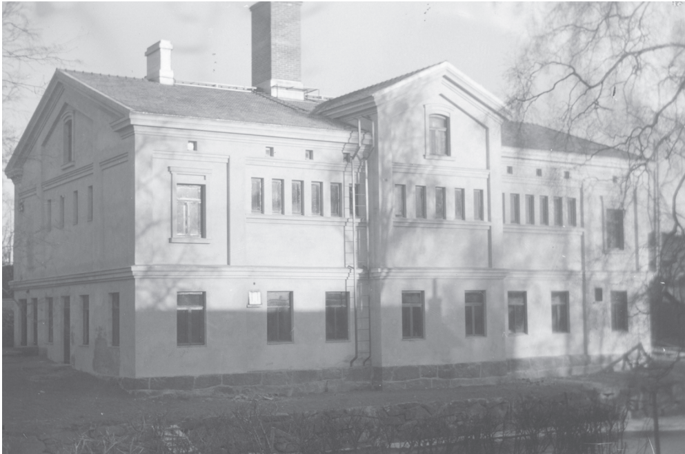
Kuva 31. Forssan Osake Yhtiön vuonna 1890–1891 rakennuttama kylpylärakennus eli Iso sauna kuvattuna 1950-luvun asussaan.

saattoi lähteä kauemmaksikin, mutta lehti oli huolissaan kylmemmistä vuodenaajoista. Saunan lopettaminen hankaloitti erityisesti eläkeläisten arkea, joilla ei ollut kotona peseytymismahdollisuuksia. Forssan viimeinen yleinen sauna sulki ovensa vuonna 1979. Peseytymismahdollisuuksia paransi kuitenkin huomattavasti vuonna 1968 valmistunut uimahalli. 650