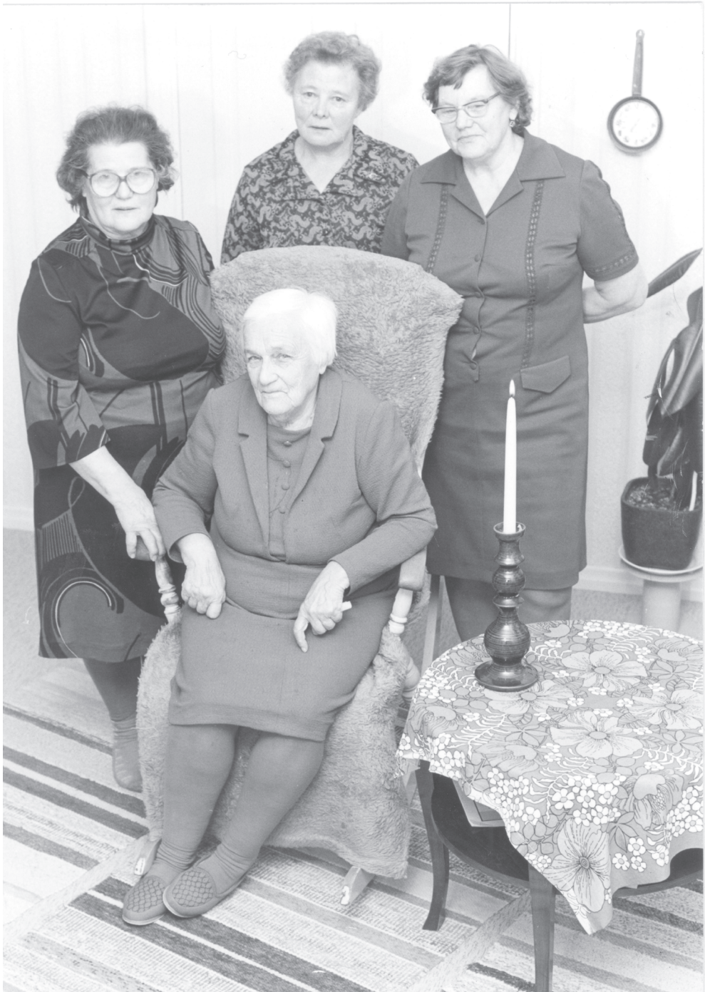
Kuva 23. Yhtiön vanhainkodin asukkaita vuonna 1977. Takana keskellä asuntolan emäntä.