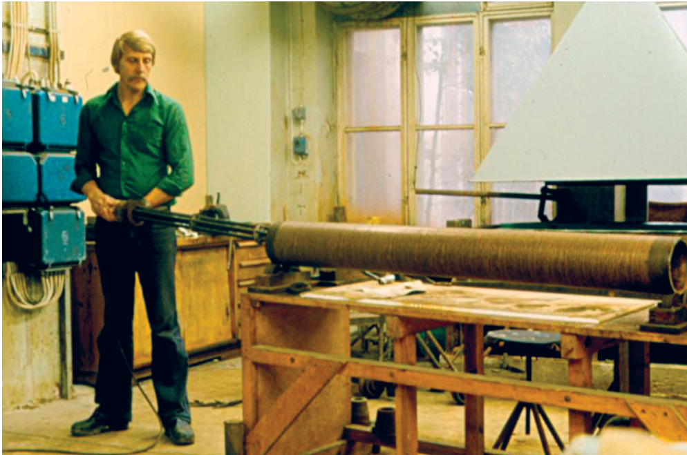
Kuva 11. Sorvari polttaa kopiointilakan valssiin kiinni 1970-luvun alkupuolella.

telee naisten tehneen värjäämössä avustavia tehtäviä, koska ne olivat kevyempiä ja vastasivat naisten kehollista kapasiteettiä.