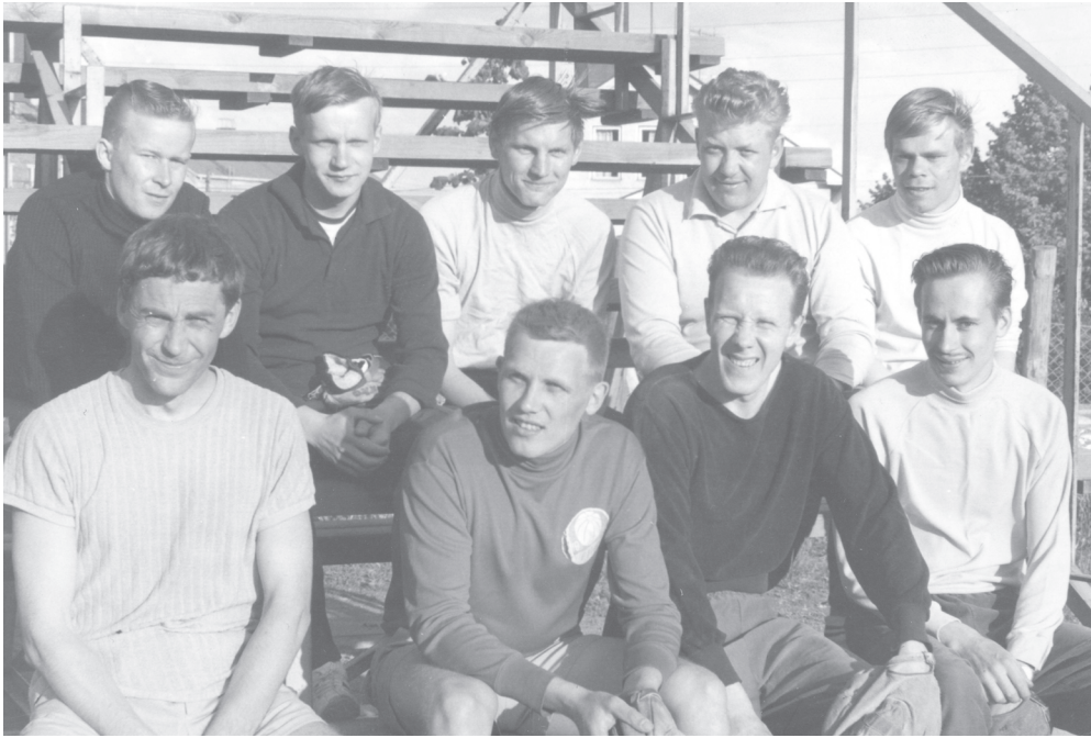
Kuva 39. Viimeistämön pesäpallojoukkue 1960-luvun lopulla Talsoilan pallokentällä Forssassa.

piiriin. 730 Toisaalta tutkimusaineistoani voi tulkita niinkin, että naiset uhrautuivat ja tekivät kaikki lapsiin ja kotiin liittyvät työt, joten miehillä ei ollut kodin piirissä oikein tekemistä. Naiset sulkivat miehet kodin ja perheen läheisyydestä tekemällä kaiken, jolloin miesten oli vapaa-aikana mahdollista suunnata aikansa ja tarmonsa muualle. Miehet jäivät ulkopuolelle kodin sisäpiiristä, jolloin heidän oleellisimmaksi tehtäväksi jäi perheen elatuksen turvaaminen.