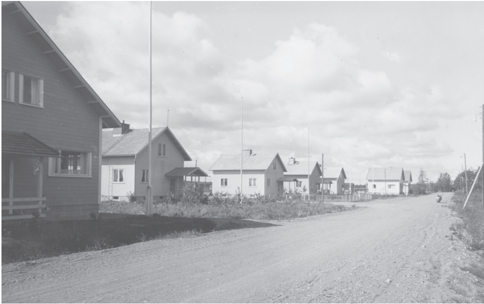
Kuva 26. Omakotitaloja Korkeavahan alueella vuonna 1959.

perinkin vuokraamista silmällä pitäen. Talon yhteyteen voitiin rakentaa myös autotalli, joka vuokrattiin ulkopuoliselle autonomistajalle. Myöhemmin oman tilanteen parantuaessa voitiin hankkia omakin auto. 620