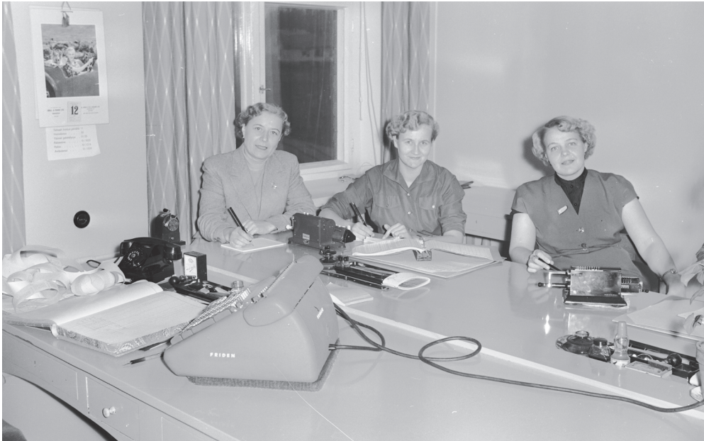
Kuva 5. Kehräämön konttorin naistyöntekijöitä 1950-luvulla.

empaa kukaan. Enkä tuntenut ketään. Ei ollut tuttavapiirissä. Se onkin aika erikoista, että ei osunut yhtään tuttavapiiriin ihmisiä, jotka olis ollu siellä töissä. 256