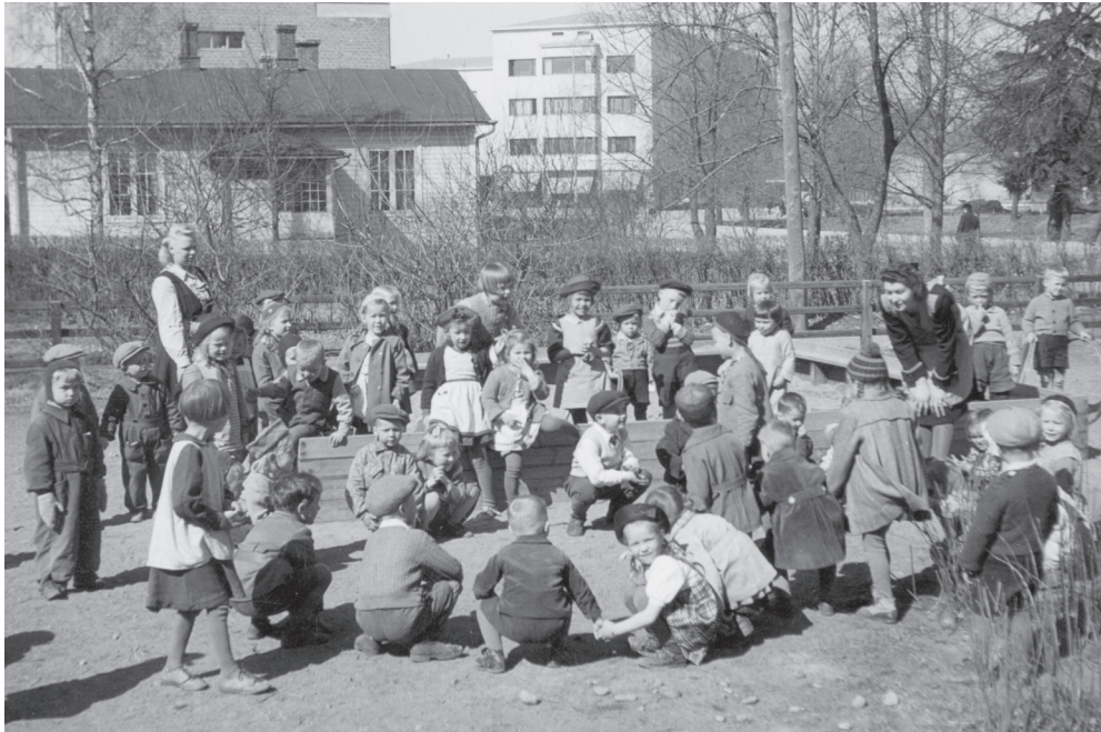
Kuva 16. Lapset leikkivät Finlayson-Forssan lastentarhan pihalla vuonna 1947. Päiväkoteja tutkineen etnologi Billy Ehnin mukaan arki päiväkodeissa on rutiinien täyttämää. Aikuisten aikataulut määrittävät päiväkodin rytmin. Lastentarhan päiväohjelmassa toiminnot seuraavat toisiaan. Ne toimivat päiväkodin arkea ylläpitävänä ja uusintavana rakenteena (Ehn 1983, 72–80).

mihenkilöitä. Moni heistä koki erityisesti lastentarhan mahdollistavan oman työssäkäyntinsä.