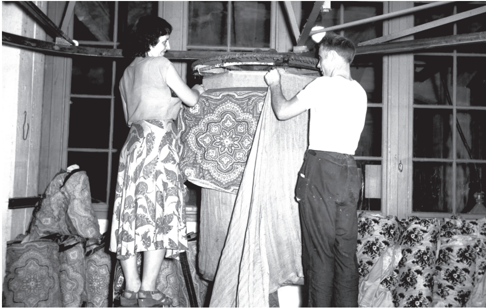
Kuva 10. Finlayson-Forssan Oy:n viimeistämöstä 1950-luvulta. Huivikangasta kiinnitetään ”tähtihöyryyn”, laitteeseen, jossa painoväri kiinnitettiin höyryttämällä. Tähtihöyryä käytettiin myös painetun froteen värien kiinnitykseen. Forssan museon kokoelma.

Muovitehdas oli yksi forssalaisen tekstiiliteollisuuden osa-alue. Se oli oma erillinen Finlayson-Forssa Oy:n yksikkönsä, vaikka toimi yhteistyössä muiden osastojen kanssa. Muovitehtaalaiset olivat finlaysonilaisia, mutta vahvasti myös muovitehtaalaisia. Koska työntekijät saattoivat työskennellä eri osastoilla työuriansa aikana, heille muodostui käsityksiä eri yksiköistä ja niiden tavoista toimia. Muovitehtaan koettiin usein edustavan uudempaa, modernimpaa aikaa verrattuna yhtiön varsinaiseen tekstiilipuoleen, jolla oli sata vuotta vanhemmat perinteet työn tekemiseen sekä sen valvontaan. Muovitehtaalakin koneet määrivät tuotannon työntekijöiden arkea, mutta paikka koettiin vapaamuotoisemmaksi kuin kutomo. Muovitehtaalla ei ollut perinteiden taakkaa velvoittamassa toimintaa vaan se otti kevyemmin käyttöön uusia toimintamalleja. 355