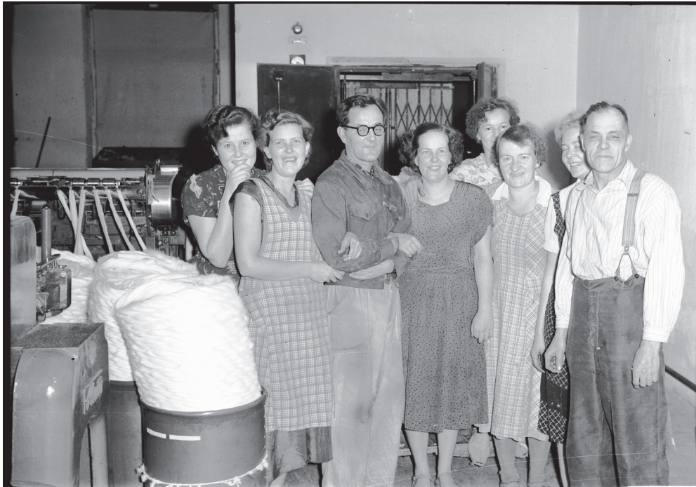
Kuva 7. Kehräämön työntekijöitä ryhmäkuvassa venytyskoneella 1950-luvulla.

nähty muitakaan vaihtoehtoja. Se tarjosi myös nopean tien kiinni omiin ansioihin. 277 Työ toi nuorille itsenäisyyttä ja vahvisti näiden roolia aikuisina. 278 Perheen kulttuurinen pääoma vaikutti nuorten opiskelumahdollisuuksiin. Keskiluokkaisissa perheissä lasten opiskeluun oli enemmän taloudellisia mahdollisuuksia, mutta niiden lisäksi muitakin resursseja, kuten tietämystä eri opiskeluvaihtoehdoista. Opiskelu oli yhtä luonnollinen valinta kuin työväenluokan nuorten nopea siirtyminen työelämään. 279