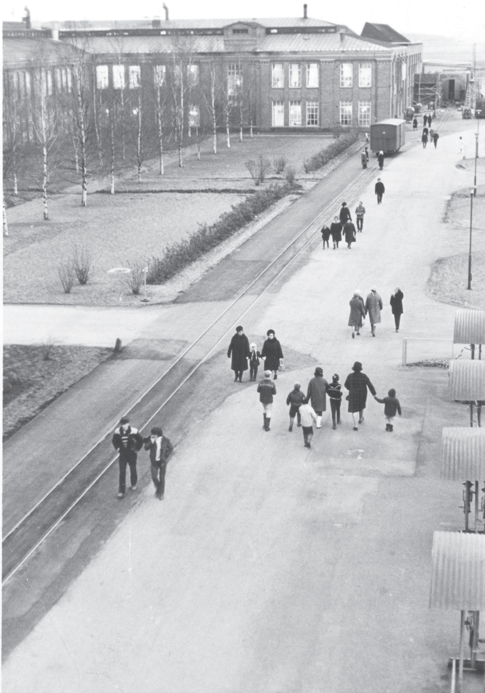
Kuva 20. Finlayson-Forssa Oy:n piha-alueetta Kutomolla. Työntekijöitä on tulossa töihin, ja osa on vuorostaan lähdössä kotiin. Kuvassa näkyy myös useita lapsia.