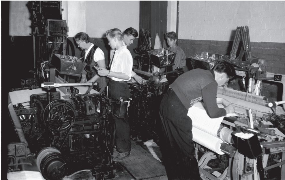
Kuva 8. Kutomakoneilla kutoja ja laitosmiehiä Finlayson-Forssan kutomon oppikopilla eli työhuoneella, jossa työnopastajat opettivat uusia työntekijöitä 1950-luvulla.

sikin jäänyt saamatta, kuten esimerkin naisella. Hänelle tehdastyö oli jo tuttua, joten esimies katsoi, että parhaiten nainen oppisi erilaisen koneen käytön harjoittelemalla itseksensä. Tärkeintä oli, että koneet pysyivät käynnissä.