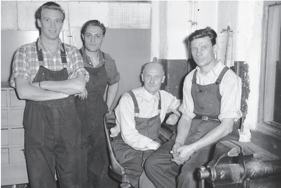
Kuva 4. Kehräämön laitosmiehiä on asettunut ryhmäkuvaan 1950-luvulla.

Aikaisemmin valokuvan ottaminen oli rituaali jo itsessään. Yleensä kuvia otettiin vain jonkin tietyn tilanteen tai tapahtuman yhteydessä. Kuvaamiseen myös valmistauduttiin. Valokuvaa varten voitiin pukeutua ja laittaa tukka kauniisti. Sitä varten voitiin mennä valokuvaamoon tai pyytää tuttavaa kuvaamaan omaa perhettä, jos omaa kameraa ei ollut. Valokuvuihin asetuttiin huolella ja tietyllä tavalla. Kameroiden yleistyessä kuvaaminen lisääntyi ja arkipäiväistyi, mutta vielä 1950-luvulla ihmiset usein asetuivat kameras eteen ennalta mietityllä tavalla. Nykyään kuvia voidaan ottaa koska tahansa hyvin helposti ja rajattomasti. Valokuvaamista varten ei tarvita välttämättä mitään valmisteluja, mutta halutessaan jokainen voi muokata kuvia mieleisekseen. 207 Tehtaalla 1950-luvulla työnantajan toimesta otetuissa kuvissa työntekijät ovat asettuneet kuvattaviksi lähimpien työtovereiden kanssa, kuten luojat 208 , heidän apulaisensa ja ryhmän laitosmies. Ihmisiä on kuvattu myös heidän työnsä ääressä, mutta harvoin vapaamuotoisissa tilanteissa.