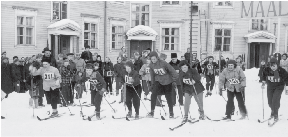
Kuva 34. Eri osastojen väliset hiihtokilpailut Viksbergin maastossa vuonna 1952. Kuvassa naisten viestihiihdon lähtö. Taustalla näkyy yhtiön asuintalo, Viksbergin Isotalo. Forssan museon kokoelma.

osaltaan helpottivat uusien tulokkaiden sopeutumista joukkoon ja tutustuttivat heitä toisiin työntekijöihin. Kuten Heinilä toteaa, kontaktien ja ystävyysuhteiden puute eivät edistäneet tulokkaiden liittymistä urheiluseuroihin ja osallistumista kuntourheiluun. 689