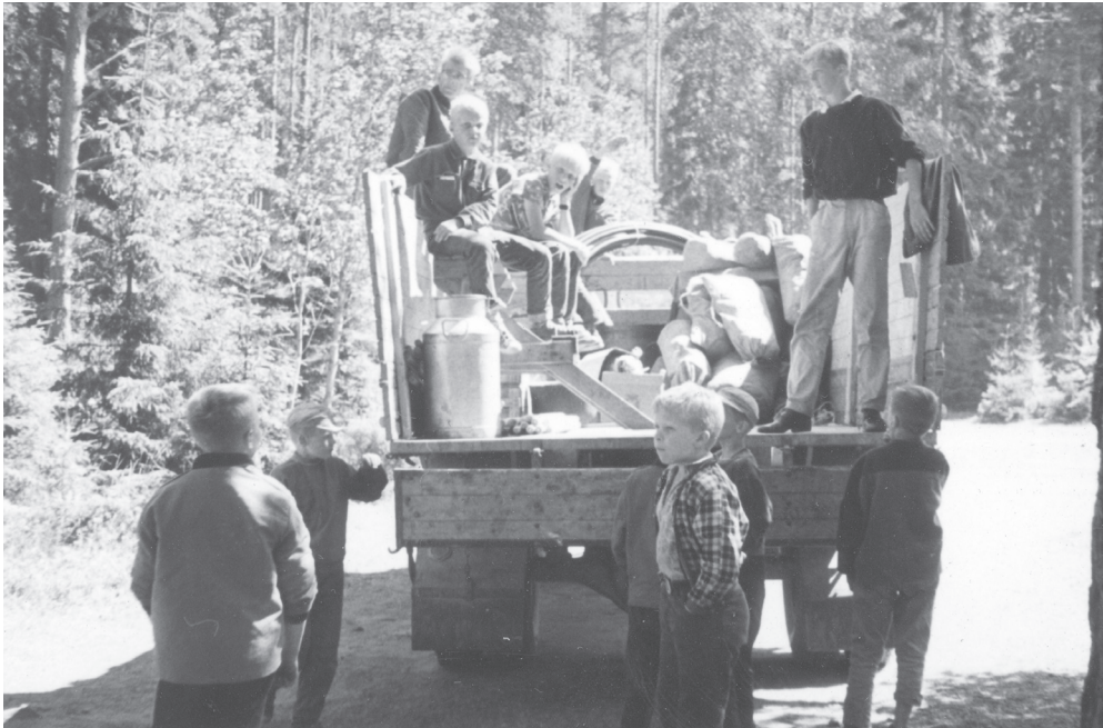
Kuva 22. Lapset lähdössä yhtiön kesäleirille Ruostejärvelle 1960-luvun alussa.

Tehdas-yhtiö oli siis mukana työntekijöiden lasten elämässä myös muilla tavoilla kuin lastentarhan kautta. Työnantaja järjesti myös muun muassa hiihtokilpailuja ja luistinradan tehtaan työntekijöiden lasten iloksi. 526 Vanhempien kanssa lapset pääsivät mukaan asumaan yhtiön asuntoihin, saunoihin, kuusijuhliin sekä esimerkiksi saivat osansa tehtaan kangaskaupasta hankituista tuotteista. Vanhempiansa tavoin monelle tehdasyhteisössä kasvaneelle paikka oli koko maailma, jolle myös oma elämä rakennettiin. Kaikki eivät halunneet tähän valmiiseen pakettiin, mutta monet huomattuaan kasvoivat finlaysonilaisuuteen tehdasyhteisön arjessa.