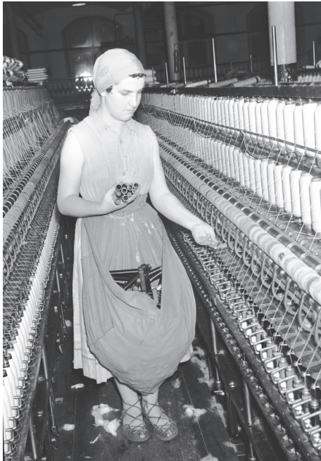
Kuva 29. Kehräämön säätitytöllä on yllään rökkö eli pupinapökö (puoliesiliina), josta hän täyttää tyhjiä puolita rengaskehruukoneeseen 1950-luvulla. Säätitytöt vaihtoivat täydet puolat tyhjiin, kun veivaaja eli säätinhuutaja, puhalsi pilliin.

Alennuksen tehtaalla kangaskaupasta sai yhtiön henkilökortilla. Siihen olivat oikeutettuja työntekijät sekä jo eläkkeellä olevat. Vuosien saatossa käytännöt hieman vaihtelivat. Teoriassa alennukset tehtaalla kaupassa olivat henkilökohtaisia eikä korttia olisi saanut lainata. Yleinen käytäntö kuitenkin oli, että korttia lainattiin sitä tarvitseville sukulaisille ja ystäville. Keskusteltuani useiden tehtaalla kangaskaupassa työskennelleiden kanssa he kaikki kertoivat samaa. Alennus annettiin, jos ostajalla oli kortti, vaikka myyjät olisivatkin tienneet kortin lainatuksi. 636