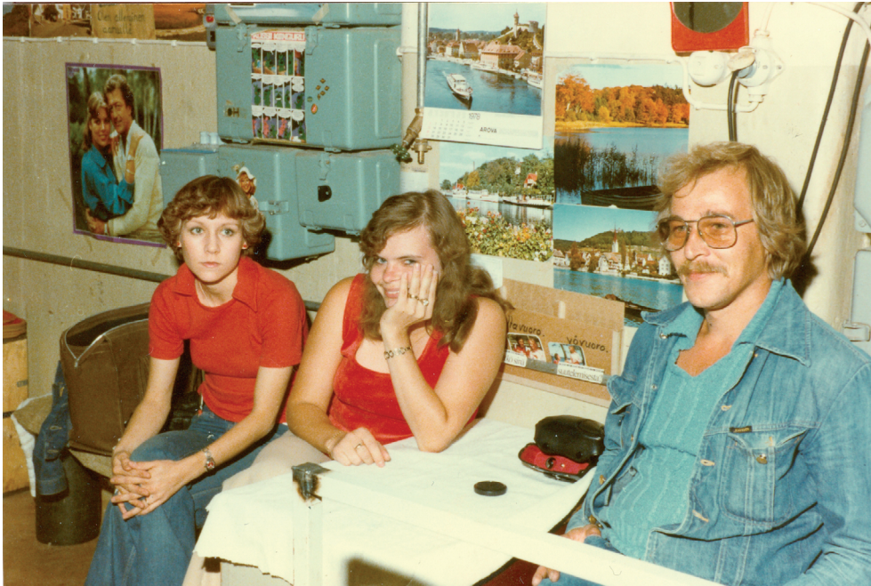
Kuva 12. Trikoo-osaston nuoria työntekijöitä tauolla vuonna 1978.

koltiaisia. Nuoria kun oltiin. (...) ne oli vanhempia, ne oli sodassaki ollu ja kyllä ne aina puhu. Me oltiin Syvärilläki ne puhu. 381