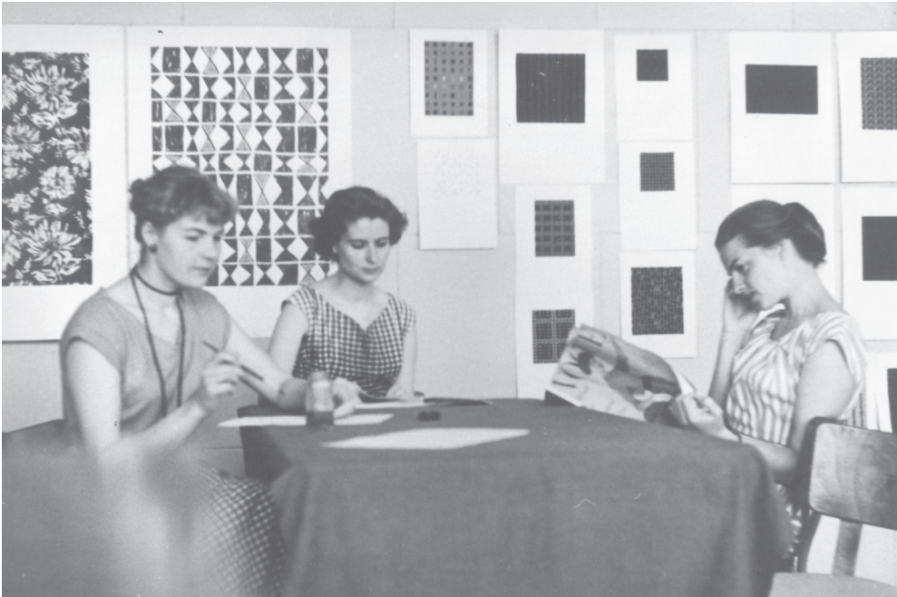
Kuva 1. Finlayson-Forssa Oy:n tekstiilitaiteilijoita ateljeessa vuonna 1956. Taustalla kuosipiirroksia.

maaseudulla elintarvikkeisiin sodan aikana. Molemmista oli pulaa, mutta tekstiiliteollisuuden työntekijät saivat helpommin käsiinsä kangasta, kun taas maalla ruokaa oli enemmän. Finlayson-Forssa Oy:n tehdasrakennuksia pommitettiin paikkakunnalla, mutta ne eivät kärsineet merkittäviä vaurioita. Sotien jälkeen forssalainen tekstiiliteollisuus lähti jälleen nousuun 1950-luvulla. Tehtaiden konekanta uusittiin sekä kehitettiin värjäystoimintaa ja viimeistämöä. Vuonna 1956 työntekijöitä oli noin 2300, joista toimihenkilöitä oli noin 115. Työntekijöistä naisia oli 60–65 prosenttia. 28