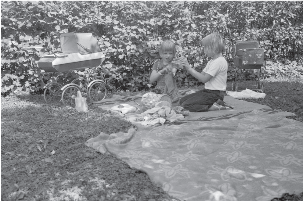
Kuva 25. Lapset leikkivät kotinsa pihalla Wahreninkadulla kesällä 1980.

muistuttamaan, että asuinalueet olivat yhtiön omistuksessa ja määräysvallassa. Tekemissäni haastatteluissa kuvataan, kuinka asuinalueet olivat täynnä lapsia. He myös ottivat tiloja haltuunsa ja levittäytyivät kaikkialle kokeillen sallitun ja kielletyn olemissä ja tekemisen rajoja.