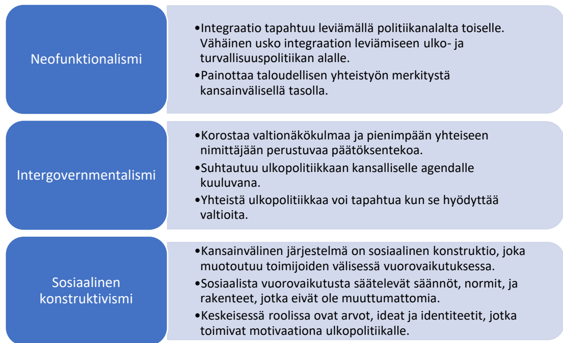
Kuvio 2. Integraatioteorioiden suhde ulkopoliittikkaan.

Integraatioteoriat painottavat eri elementtejä suhtautumisessaan ulkopoliittikkaan. Ne korostavat valtioiden roolia ulkopoliittikan pääasiallisina toimijoina, mutta eivät kiistä yhteistyön merkitystä tietyillä ulkopoliittikan aloilla. Konstruktivistinen integraatioteoria korostaa vuorovaikutuksen ja identiteettien merkitystä paitsi integraatiota vauhdittavana tekijänä, myös ulkopoliittikassa. Alla olevassa kuviossa havainnollistan neofunktionalismin, intergovernmentalismin sekä sosiaalisen konstruktivismin suhdetta ulko- ja turvallisuuspolitiikkaan. 53