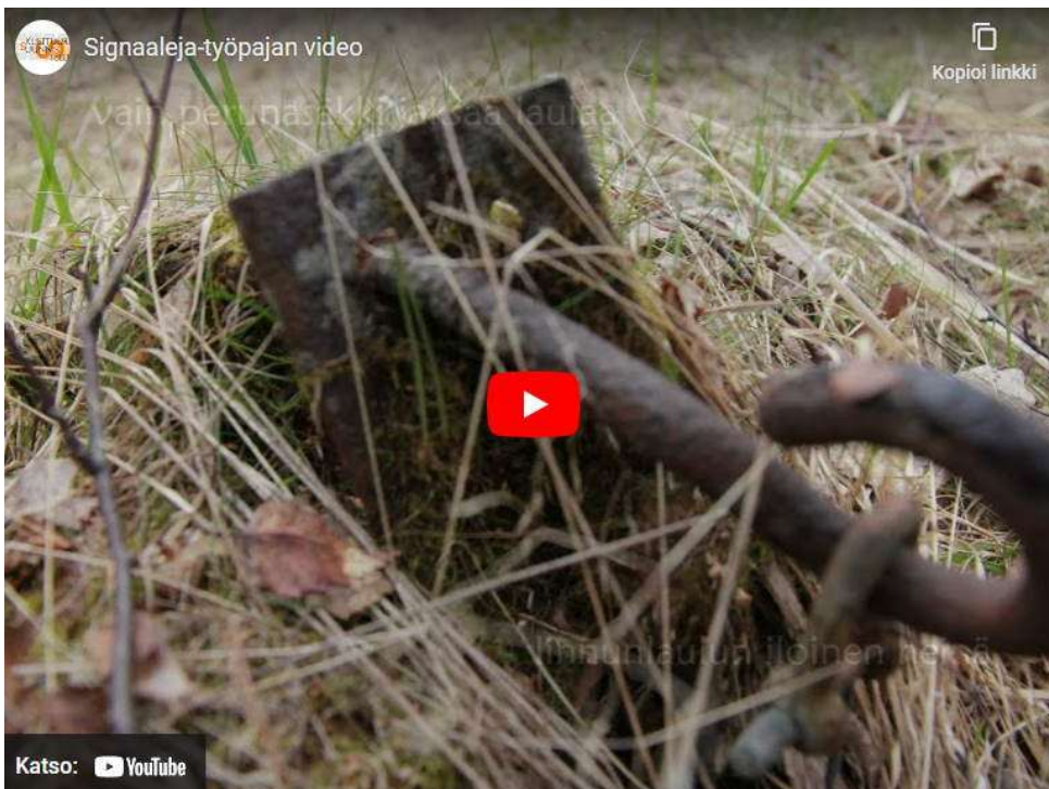
Video 1. Kuvat ja tekstit Signaali-pajoihin osallistuneet nuoret. Videon editointi Ville Kirjanen.

Nuorten jälkeen jättämät runot koostin ensin tiedostoiksi jokaiselle luokalle erikseen ja he saivat vielä työstää niitä luokissa. Työstämisen jälkeen koostin niistä yhden tiedoston, johon keräsin toistuvia tunnelmia ja ryhmittelin niitä kokonaisuudeksi aiheiden mukaan. Tämä kokonaisuus meni vielä luokille hyväksyttäväksi. Näistä työstetyistä runojen fragmenteista ja kuvista tehtiin myös videokooste pajojen tuloksista, joka oli esillä radioaseman avoimissa ovissa.