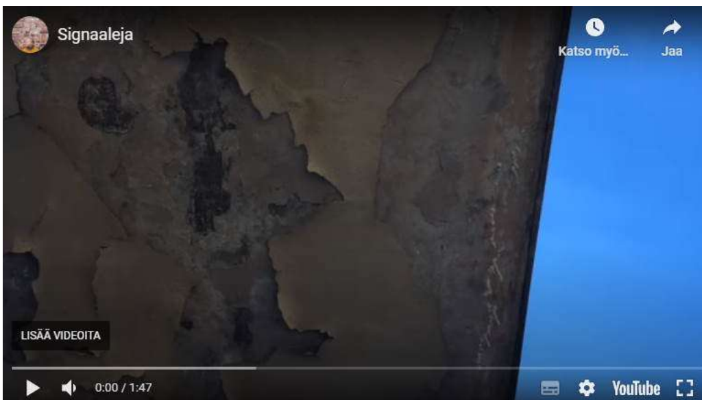
Video 2.

Tavoitteeni on välittää tunnelmia, niin suorita ja kehollisia kuin mahdollista. Haluan olla astumatta representaatioiden tontille. Tässä avuksi tulevat taidelähtöisen julkaisemisen muodot. Seuraava video ääniraitoineen välittää suoran havainnoinnin tunnelmaa.