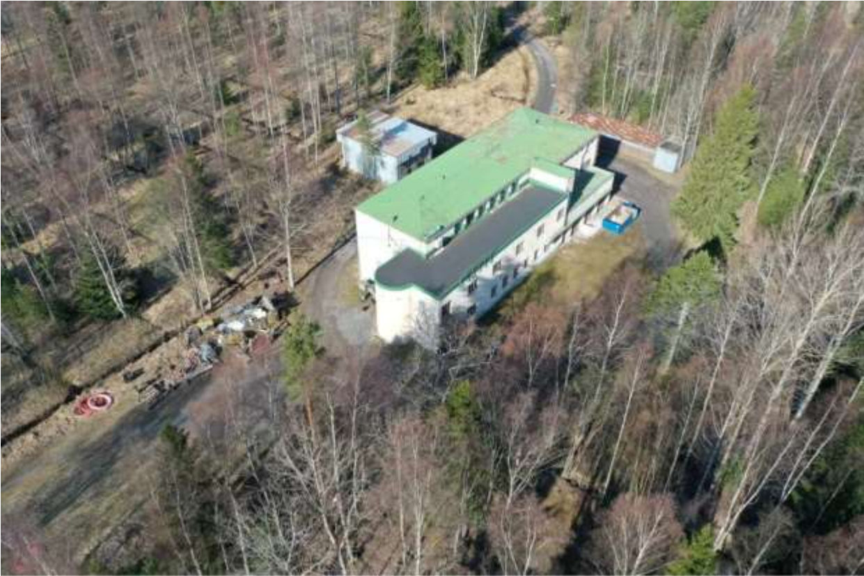
Kuva 1. Radioasema ja sitä ympäröivä puisto keväisessä asussa ennen silmujen puhkeamista keväällä 2021.