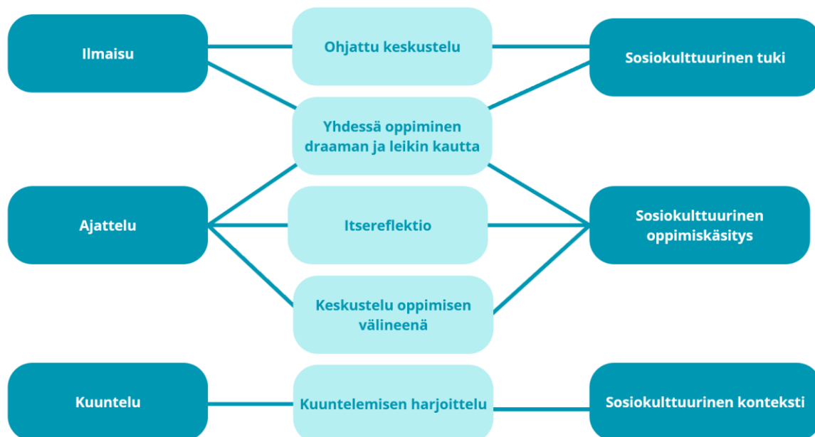
Kuva 4. Teorioista löydetyt yhteneväisyydet

Edellä esitetyn tutkielman tulosten mukaan yläkoulun elämäkatsomustiedon tunneilla keskustelutaitojen kehittymistä tukevia keinoja on runsaasti ja opettajat soveltavat niitä laajalti omissa luokkahuoneissaan. Analyysivaiheessa toteutetut luokittelut aineistolle tarjoavat näkökulman kahden erillisen aineiston yhteneväisyyksille. Tutkielmassa laajalti käsitelty dialogisuus ja sen peruseriaatteet korostuivat niin tehtävissä, kuin haastatteluissakin. Analyyseissä hyödynnettyjen Vygotskyn (1978) ja Eskelä-Haapasen ja kollegoiden (2015) teorit yhdistivät haastattelujen ilmaisuja sekä analysoituja tehtäviä, kuten kuva neljä havainnollistaa. Sosiokulttuurisen tuen piiriin kuuluvat ohjatut keskustelut sekä draamallisen yhteisoppimisen hyödyntäminen korostuivat ilmaisua kehittävässä tehtävissä. Yhdessä oppimisen toinen ulottuvuus on puolestaan sosiokulttuurisessa oppimiskäsityksessä, jossa korostuvat myös itsereflektio sekä keskustelu oppimisen välineenä. Näiden yhteys ajattelua kehittäviin tehtäviin oli selkeästi havaittavissa. Kuuntelun harjoittaminen, joka on merkittävä osa keskustelutaitojen harjoittamista, oli oma kategoriansa tehtävien luokittelussa, mutta voidaan kytkeä myös sosiokulttuuriseen kouluympäristön kontekstiin.