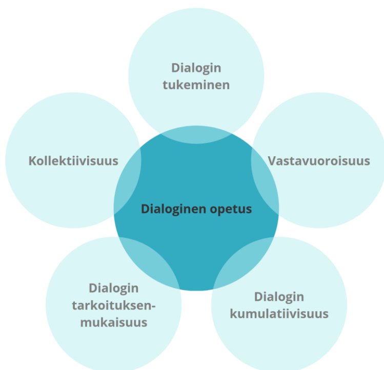
Kuva 2. Dialoginen opetus Alexanderin (2008) mukaan.

ja pyritään rikastamaan opetuskeskusteluja luokissa (s. 7). Aiemmin esitelty Alexanderin (2008) dialogisen opetuksen malli tarjoaa konkreettisen näkökulman luokkahuonedialogin tarkasteluun. Malli koostuu viidestä osa-alueesta, kuten kuva kaksi esittää, nämä ovat kollektiivisuus, vastavuoroisuus, dialogin tukeminen, dialogin kumulatiivisuus ja sen tarkoituksenmukaisuus. Kollektiivisuudella viitataan opettajan ja oppilaiden yhteisoppijuuteen, jolloin molemmat osapuolet oppivat yhdessä sekä toisiltaan. Vastavuoroisuus tarkoittaa, että kaikki osapuolet aktiivisesti kuuntelevat ja kuulevat toisiaan. Dialogin tukemisella luodaan turvallinen ilmapiiri, jotta jokainen uskaltaa osallistua opetustilanteeseen omana itsenään, ilman pelkoa nolatuksi tulemisesta. Kumulatiivisuuden myötä luokkahuoneessa yksittäisistä ideoista ja ajatuksista rakennetaan yhdessä yhtenäiset ajatusmallit. Dialogin tarkoituksenmukaisuudesta huolehtii opettaja, joka suunnittelee ja ohjaa luokkahuoneessa tapahtuvan keskustelun tukemaan oppimistavoitteita (s. 38).