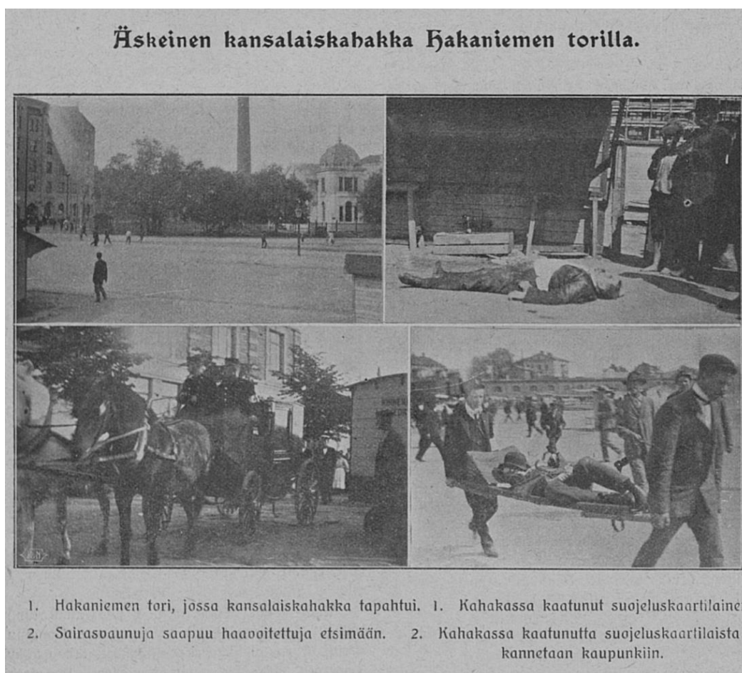
Kuva 2. Helsingin Kaiku 4.8.1906, 1. Hakaniemen kahakka.

Viittaus kuvatekstin Hakaniemen kahakkaan tarkoitti suurlakon aikaista 2.8.1906 Hakaniemen torilla tapahtunutta väkivaltaista mellakkaa, jossa vastapuolina olivat ylioppilaiden suojeluskaarti ja punakaarti sekä muutamia kapinallisia venäläisiä matruuseja. Se oli siis muistutus aseellisesta mellakasta, jonka välienselvittelystä oli seurauksena laukaustenvaihtoa ja yhdeksän kuollutta. Näistä seitsemän suojeluskaartista ja kaksi punakaartista. Aseellinen kahakka dokumentoitiin myös lehdissä, mikä on nähtävissä kuvassa 2. Mellakan seurauksena senaatti päätti lopettaa punakaartit. Näin päätti myös sosialidemokraattinen puolue, jolle kaartit olivat alkaneet muodostua ongelmaksi. 207