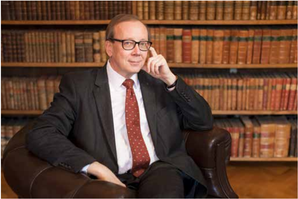
Kansallisarkiston pääjohtaja Jussi Nuorteva

sekä maakunta-arkistojen liittäminen kiinteäksi osaksi Kansallisarkistoa.