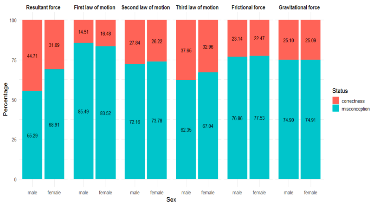
Taulukko 1: Väärinkäsitysten määrä sukupuolittain kuudella eri voiman ja liikkeen osa-alueella [2]

Opiskelijan sukupuoli mainitaan useassa tutkimuksessa yhtenä väärinkäsitysten taustatekijänä [1][2][7]. Vuosina 2011-2017 noin 30 000 opiskelijalla toteutetun tutkimuksen mukaan väärinkäsitysten määrä vähenee miehillä enemmän opiskelun myötä. Naisilla väärinkäsitykset vähenivät tutkimuksen aikana 21% ja miehillä 28%. [7] Bangkokissa 522:lla julkisen puolen opiskelijalla toteutetun tutkimuksen mukaan sukupuolten välillä eroa on huomattavissa vain kokonaisvoiman laskemisen osa-alueella. Kyseisessä tutkimuksessa opiskelijoiden suorittaman FCI-testin (Force Concept Inventory) tulokset on esitetty taulukossa 1. Tulokset on jaettu kuuteen eri voiman ja liikkeen osa-alueeseen, joissa väärinkäsityksiä voidaan FCI-testin avulla havaita. Vain yhdellä osa-alueella siis on huomattavissa jokseenkin merkittävää eroa miesten eduksi.