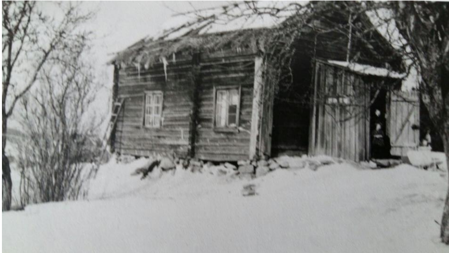
Valokuva huonokuntoisesta talosta, johon monilapsinen evakkoperhe asettui. TYKL/dg/7746.

elämänsä Karjalasta lähdön jälkeen. (N1949; Sähköpostiviesti 3.4.2017.) Talosta otettu vanha valokuva kulminoituu näin ollen muistin paikaksi, jossa kantaa sekä evakkouden että siitä selviämisen muistoja.