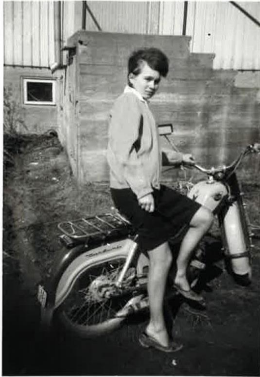
Tunturi-merkinen mopo, jonka päällä nuori nainen poseeraa. TYKL/dg/6387.

työmatkoihinsa. (N1947b, 1949.) Toinen mopomuisto 1950-luvulta käsittelee sekin mopoa ensisijaisesti välineellisesti; eräs sukuseuran jäsen toi mukanaan valokuvan, jossa poseeraa mopon kanssa. Kuvan saatetekstissä hän mainitsi, että ajoi mopolla tarvittaessa kauppamatkoja kirkonkylälle.