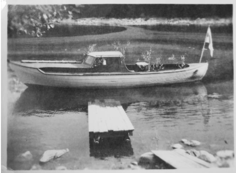
Vesiliikenteessä käytetty keskimoottorivene, kuvassa koivunoksin koristeltuna. TYKL/dg/6553.

Vesiväylät – sula-aikaan veneellä tai jäiden kantaessa reellä – olivat miehen lapsuudessa vielä tärkeimmät kulkureitit saaresta mantereelle. Samoin hevoset olivat oleellinen osa maaseudun arkea sekä liikkumisessa paikasta toiseen kuin maatalous- ja metsätöissäkin, ja perheen isä ansaitsi sivutuloja myös hevosten kengittäjänä. (M1943.)