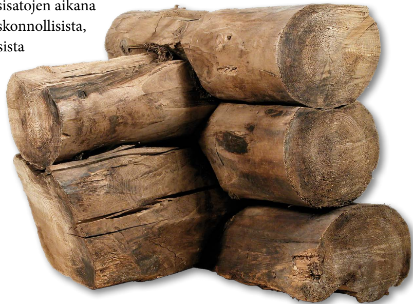
Olkasalvottu nurkka 1300-luvulle ajoitetusta rakennuksesta.

Rakennuksiin ja infrastruktuuriin kohdistuneiden muutosten lisäksi reformaation vaikutus näkyi kaupunkialueen käytössä ja asutetun alueen laajentumisena. Kirkon omistuksessa olleiden maa-alueiden takavarikointi mahdollisti kruunun aktiivisemmän rakentamis- ja asutuspolitiikan niillä alueilla, jotka olivat aiemmin tuottaneet tuloja kirkolle tai muutoin palvelleet kirkon toimintaa. Kun tarkastelemme Turun kaupunkikuvaa ja sen muutoksia kokonaisuudessaan 1500-luvun alkupuolella, voidaan kuitenkin todeta, että reformaatiota enemmän muutoksia aikaansaivat kaupunkia tuhonneet tulipalot, jotka antoivat mahdollisuuden kaupunkikuvan muutoksille raivaamalla pois vanhaa uuden tieltä. Suuremmat asemakaavalliset muutokset tapahtuivat Turussa kuitenkin vasta 1600-luvun puolella. Vuosisatojen aikana tapahtuneista hävityksistä sekä uskonnollisista, poliittisista ja ideologisista muutoksista huolimatta kaupungin symboleina ovat sen perustamisesta lähtien olleet Aurajoen suulle rakennettu linna ja Unikankareen kummulle rakennettu tuomiokirkko, jotka tervehtivät Turkuun saapuvia tulijoita yhä tänäkin päivänä.