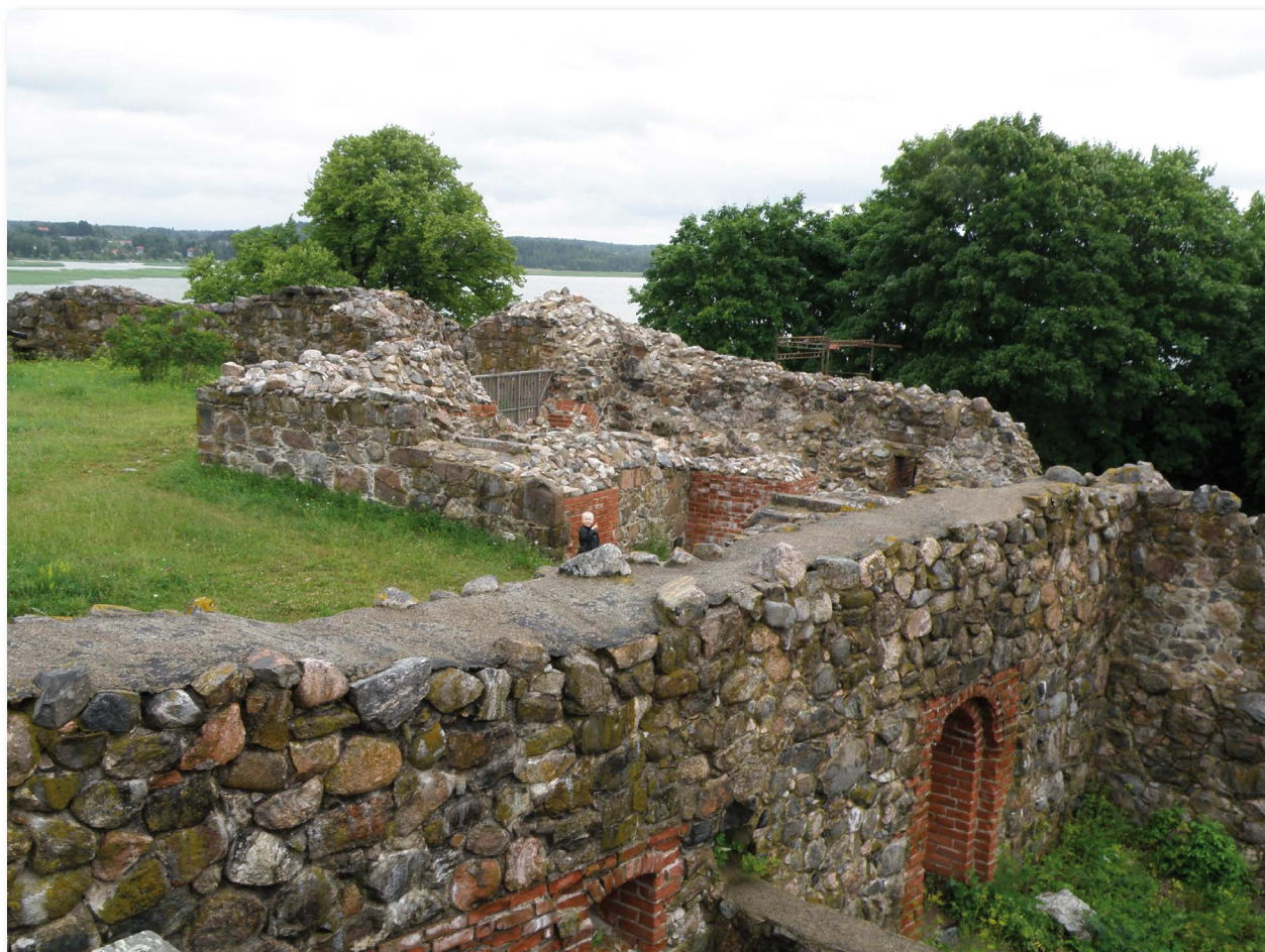
Kuusiston piispanlinna raunioitui reformaatioaikana. Nykyisin linnasta voi vielä hahmottaa ensimmäisen kerroksen huoneita, linnapihoja ja esilinnan muureja.

sekä puolustusmuurit: päälinnan tiilestä rakennettu kehämuuri, esilinnan muurit sekä kolmantena paaluvarustus meressä, joka löydettiin vuonna 1992. 63