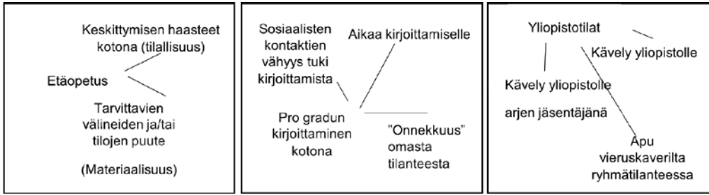
KUVIO 1. Esimerkki analyysikartasta

yksikkönä olivat erilaiset pandemia-ajan opiskelukieoumat eli se, miten opiskelukokemuksissa yhdistyivät aika, tila ja paikka. Tämänkaltaisen työskentely mahdollisti joustavamman tavan tarkastella aineistoa.